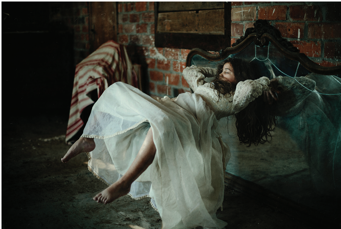
Reflejos II (2021). Fotografía Fine Art: Frank Diamond. Prohibida su reproducción en obras derivadas.

Kant, Immanuel (1876), Crítica del juicio seguida de las observaciones sobre el asentimiento de lo bello y lo sublime , Biblioteca Virtual Miguel de Cervantes Saavedra, disponible en: http://www.cervantesvirtual.com/obra-visor/critica-del-juicio-seguida-de-las-observaciones-sobre-el-asentimiento-de-lo-bello-y-lo-sublime--0/html/