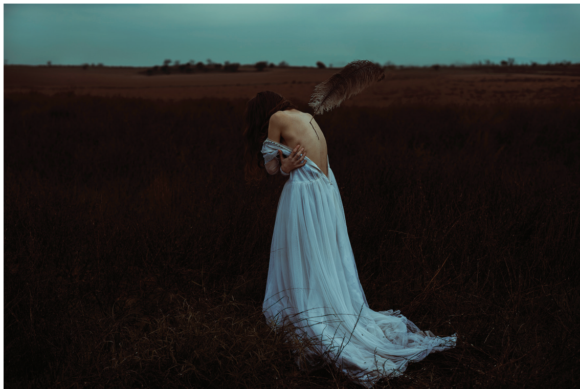
Dark Feather (2016). Fotografía Fine Art: Frank Diamond. Prohibida su reproducción en obras derivadas.