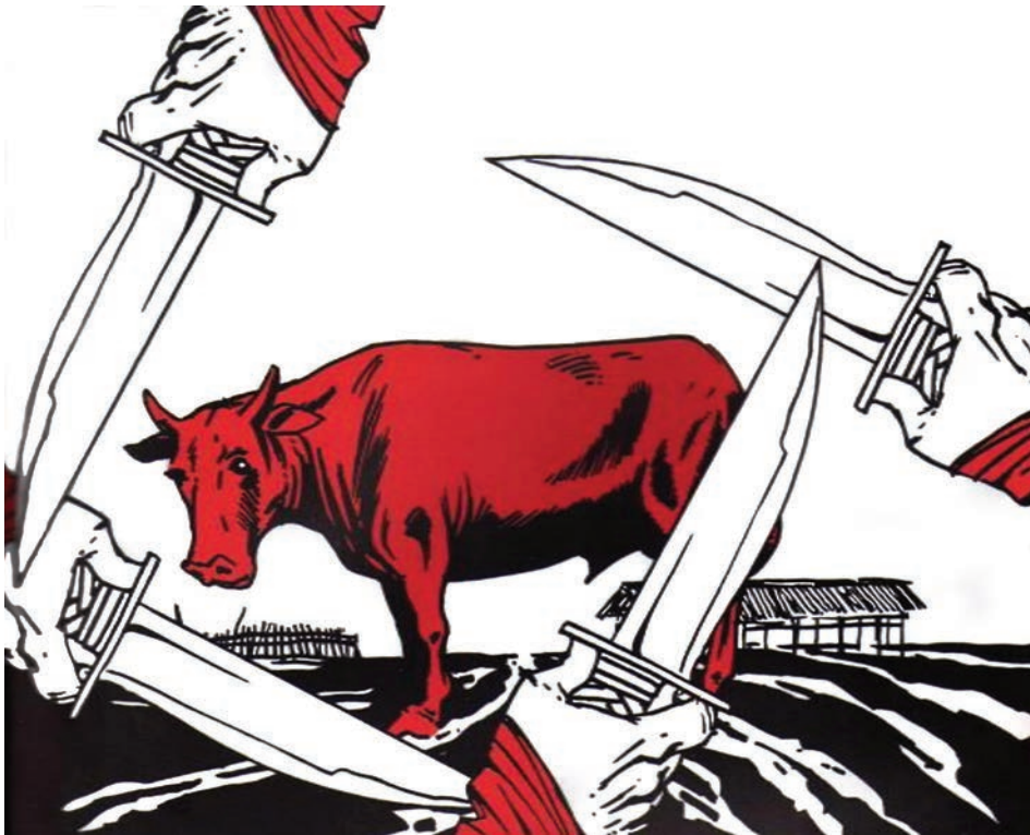
El matadero , V&R Editorias (2011). Microfibra de punta gruesa, pluma, pincel y tinta china negra y retoques digital de color: Óscar Capristro.

Prohibida su reproducción en obras derivadas.