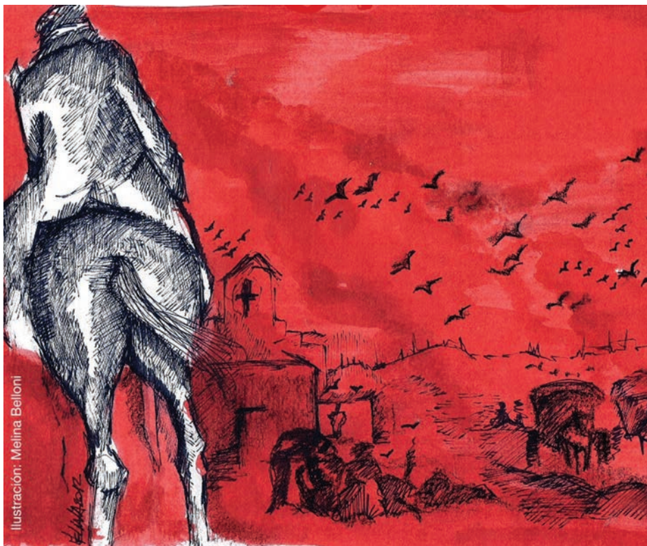
El matadero , Editorial Caligrafías (2021). Tinta china y microfibras sobre papel: Melina Belloni. Prohibida su reproducción en obras derivadas.

Podría verse en Marcia Schwartz el puente entre las interpretaciones plásticas más tradicionales y las modernas. Pertenece a una generación de artistas que crecieron a la sombra de Jorge Rafael Videla y se consolidaron en los años posteriores a la dictadura, por lo que su memoria necesariamente está compuesta con el material del terror, la resistencia y, en su particular caso, la nostalgia que provoca el exilio. Heredera de posturas políticas definidas y robustas, la propuesta de ilustración de Schwartz tiene dos impulsos creativos. Por un lado, en su búsqueda de la formalización plástica —en palabras de la propia pintora—, de “lo peor de la cultura argentina, asociada con la carne, la matanza y la bestialidad”, confecciona los marfiles más ominosos de la tradición de ediciones ilustradas de El matadero . A la vez, no obstante, forja imágenes en las que la gente de los corrales está plásticamente configurada con una solemnidad dignificante. Estas dos formas de materializar a los