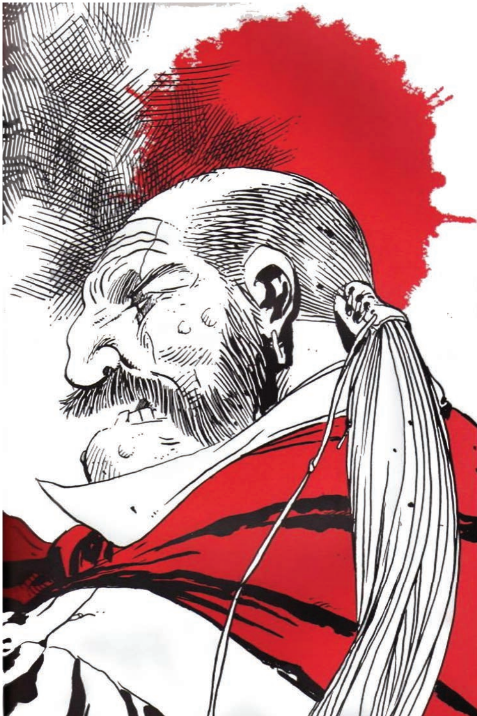
El matadero , V&R Editoria (2011). Microfibra de punta gruesa, pluma, pincel y tinta china negra y retoques digital de color: Óscar Capristo.

Prohibida su reproducción en obras derivadas.