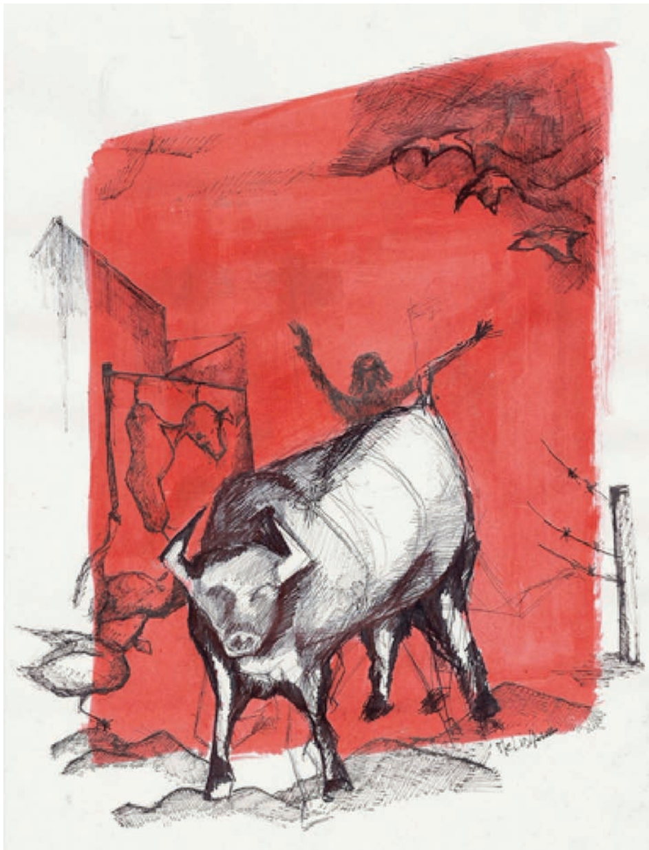
El matadero , Editorial Caligrafías (2012). Tinta china y microfibras sobre papel: Melina Belloni. Prohibida su reproducción en obras derivadas.