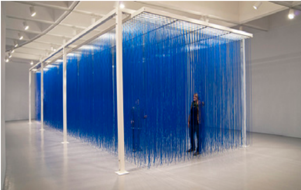
Imagen 2. Jesús Rafael Soto, Blue Penetrable, 1967 (reconstrucción 2012).