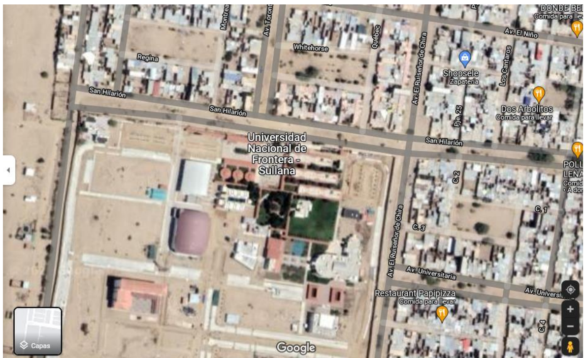
Figura 2. Ubicación de la Universidad Nacional de Frontera

Para la medición de la variable percepción estudiantil se utilizó como instrumento de medición un cuestionario conformado por 10 ítems que permitió medir la variable. Para el análisis de datos se empleó el análisis descriptivo.