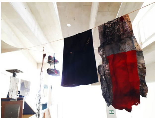
3. Registro de la obra "Lo Que Será Será Y Así Fue". Se observan telas guindadas en cuerdas, en referencia a la ropa que se seca en un patio bajo el sol.

mentos logra representar la estructura de una casa: un sitio donde sentarse, fumar, escuchar música a todo volumen o colgar la ropa. En resumen, un lugar donde habitar.