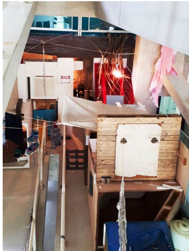
1. Imagen en picado de la pieza “Lo Que Será Será Y Así Fue” en la cual se nota la yuxtaposición de diferentes materiales que crean ambientes internos y externos por los cuales transitar o tenderse.

Uno de estos, (Ver figura 2 y figura 3) a través de la presencia y agrupación de algunas formas dentro del mismo espacio, remite a un tendedero: nos en-