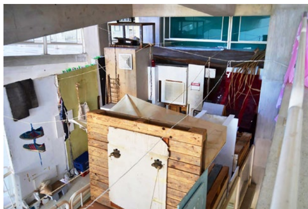
4. Registro de la obra "Lo Que Será Será Y Así Fue" donde se visualiza la reutilización de materiales de desecho y la acumulación de objetos de diferente naturaleza

tres. Mike Davis (2004) expone que la expansión descontrolada de estas áreas constituye un problema en los países con dependencia en la misma medida en que la extensión descontrolada de las áreas residenciales lo es en las potencias.