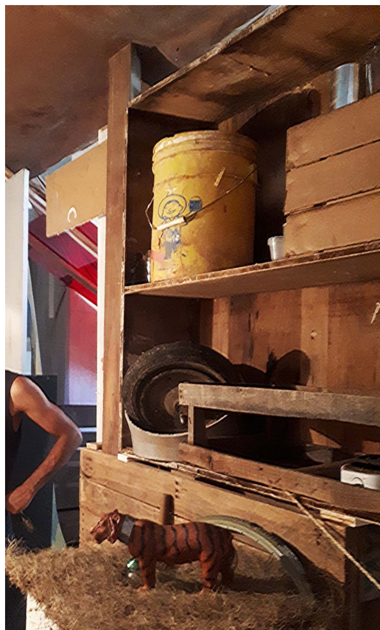
6. Área interior de la obra “Lo Que Será Será Y Así Fue” donde se pueden observar objetos y materiales desgastados que fueron tomados del depósito del museo para la construcción de la estructura, fotografía de Ariane Holz (2017)

La materialidad de la obra se ubica dentro de un espacio de poder, dentro de una institucionalidad, pero este microterritorio dentro de un territorio mayor –a saber, dentro de un espacio museístico–, busca escapar de la lógica institucional normativizada y deviene en un no-lugar, en una parodia de la realidad de la sala expositiva, y visibiliza el espacio del habitar de un grupo social específico, es decir, las personas en los asentamientos informales, para que los sujetos que transitan en la obra puedan cuestionarse lo que ocurre afuera, puedan evocar fácilmente lo que sus ojos le permiten percibir. Para su construcción, se utilizaron objetos dejados por el museo, lo cual refiere a la manera en que estas casas son construidas, con materiales que sus habitantes encuentran (Ver figura 6).