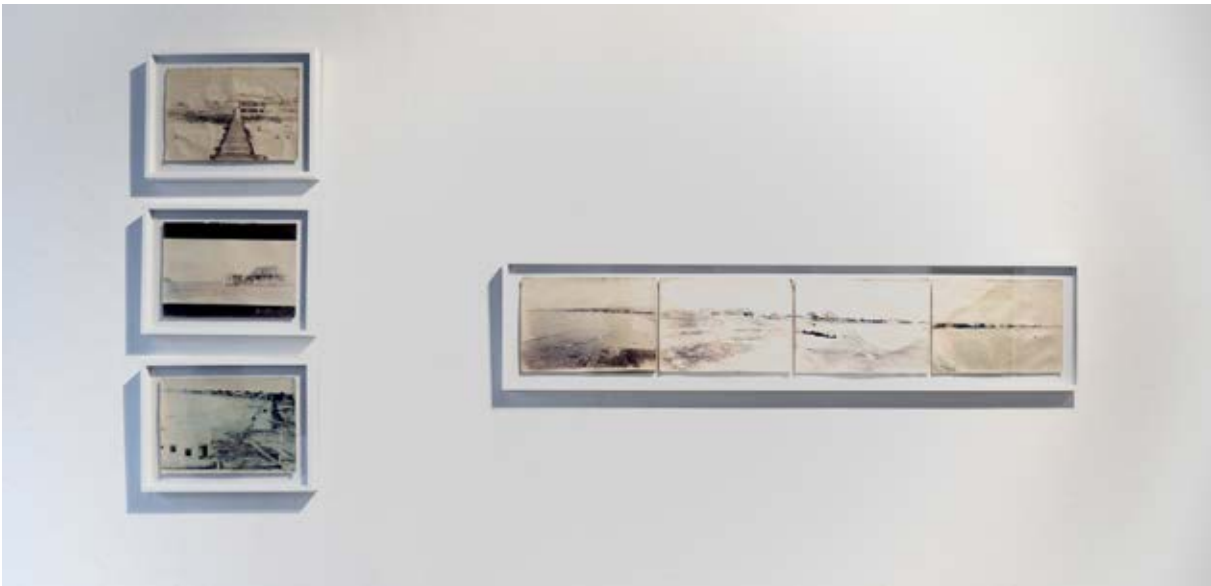
Figura 2. Contrapulsión , Fotografía de Nicolás Saavedra, 2019.