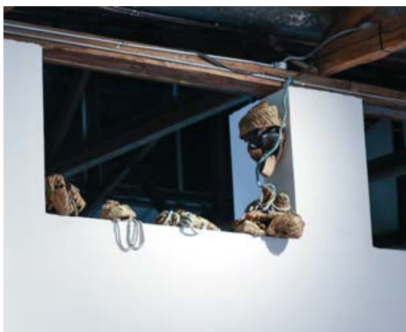
Fig.11. Múltiples presencias , 2019.

La obra titulada Múltiples presencias (2019), parte de la idea de lo monstruoso como concepto clave para el desarrollo creativo, pues permite explorar desde la materialidad orgánica formas que denotan una extraña sensación de algo que está germinado, gestado. Son formas sin inicio ni final. En conjunto podrían considerarse como esféricas u ovaladas, pero en realidad son numerosos cuerpos enroscados y sobrepuestos entre sí. Al crearlas, la artista indaga sobre la percepción y la sensorialidad que produce verlas, es una sensación de sobrecogimiento en la piel, de hecho, a ratos quisiera perder su carácter humano.