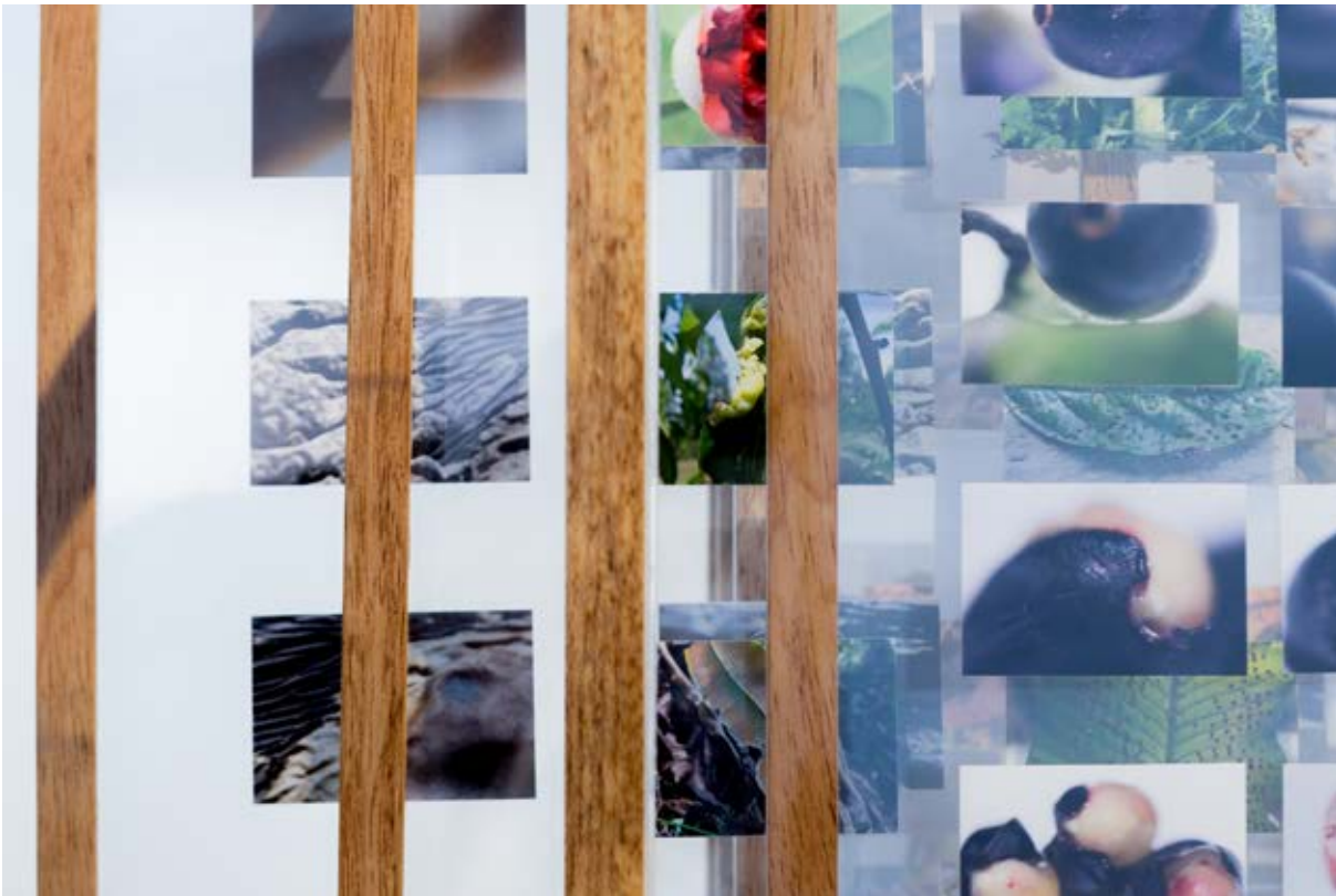
Figura.9. Herbario parásito , 2019.

poco temerarios y monstruosos, lo cual las convierte, para la percepción científica, en un ecosistema invasor para la comunidad vegetal. Desde este lugar, el carácter parasitario ha quedado como una rama de la botánica, estudiada desde la Teratología, cuyo nombre proviene de dos palabras griegas: “ Teratos , un presagio temeroso enviado por los dioses y, por lo tanto, un ser monstruoso. Logos un discurso o tratado. Las dos palabras en conjunto; el tratado de los monstruos ” (Plantefol, 2014, p. 1).