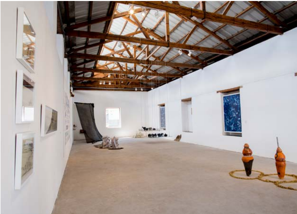
Fig. 1. Vista general de I(N)EQUÍVOCAS Museo Interactivo de Ciencia .Fotografía de Daniela Merino, 2019.

I(N)EQUÍVOCAS se inauguró el día sábado 9 de marzo de 2019 en las instalaciones del Museo Interactivo de Ciencia de Quito y se mantuvo abierta al público durante 48 días. La exposición fue el resultado de un proceso de investigación que duró aproximadamente un año y fue concebido como parte del proyecto de titulación de tres estudiantes de la Universidad San Francisco de Quito.