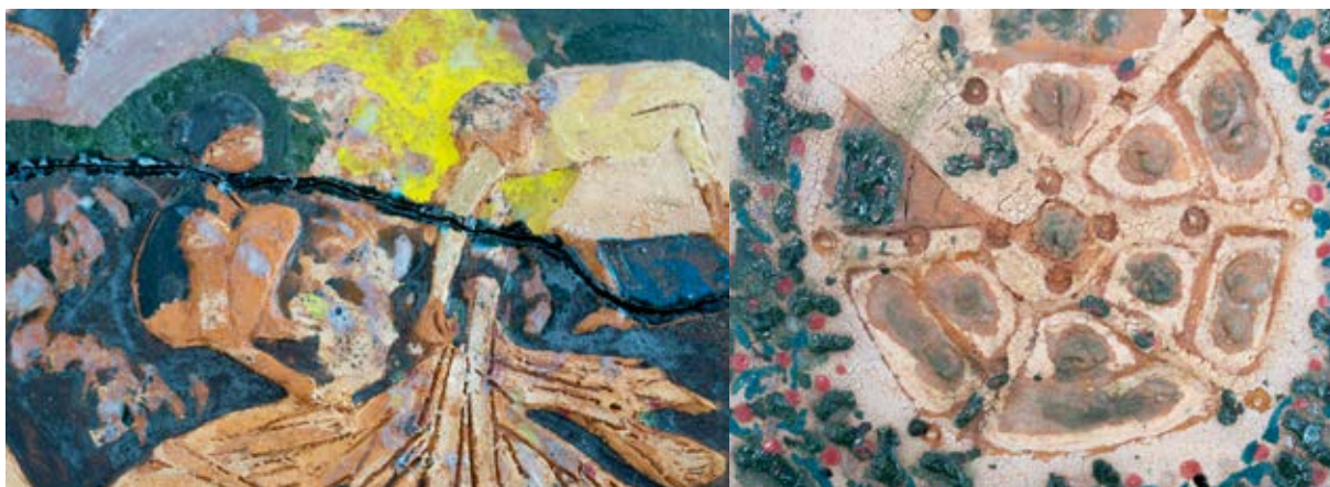
Figuras 13-14. Con Tacto , 2019. Fotografías de Nicolás Saavedra, 2019.

Por otro lado, en “Producción 2019” (2019), se junta el diseño y los elementos de construcción de la compostera con lo que resulta de ella. La artista dispone material compostado dentro de 10 saquillos de tela blanca en 4 montones separados. Se busca representar las diferentes alturas que diseña en territorio, para asegurar la movilidad de la materia por derrame y lograr así una economía de esfuerzos. Sobre cada columna la artista ubica un elemento que narra su proceso de construcción y de pensamiento: grapas de techo, piezas cerámicas encontradas en la excavación más profunda, un folleto y un guante con sus notas de campo.