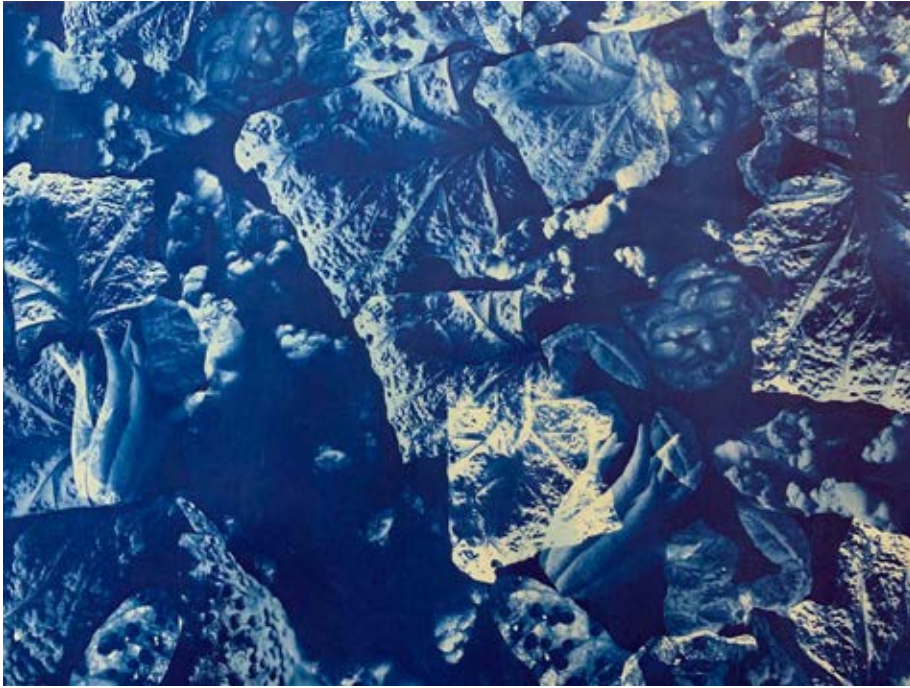
Figura 6. Teratos , 2019.