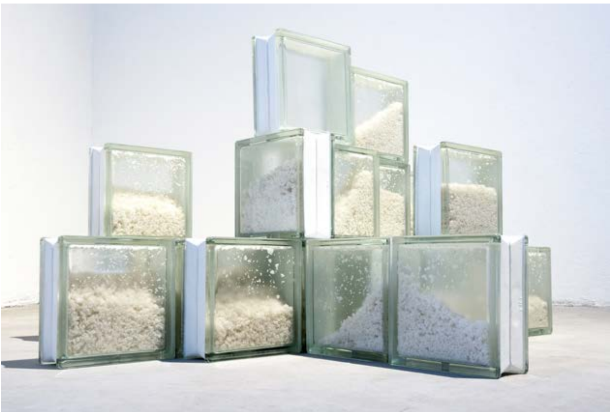
Figura 3. Población Flotante , 2019.