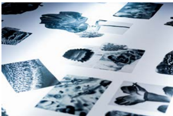
Figura 10. Herbario parásito , 2019.

La obra titulada Múltiples presencias (2019), parte de la idea de lo monstruoso como concepto clave para el desarrollo creativo, pues permite explorar desde la materialidad orgánica formas que denotan una extraña sensación de algo que está germinado, gestado. Son formas sin inicio ni final. En conjunto podrían considerarse como esféricas u ovaladas, pero en realidad son numerosos cuerpos enroscados y sobrepuestos entre sí. Al crearlas, la artista indaga sobre la percepción y la sensorialidad que produce verlas, es una sensación de sobrecogimiento en la piel, de hecho, a ratos quisiera perder su carácter humano.