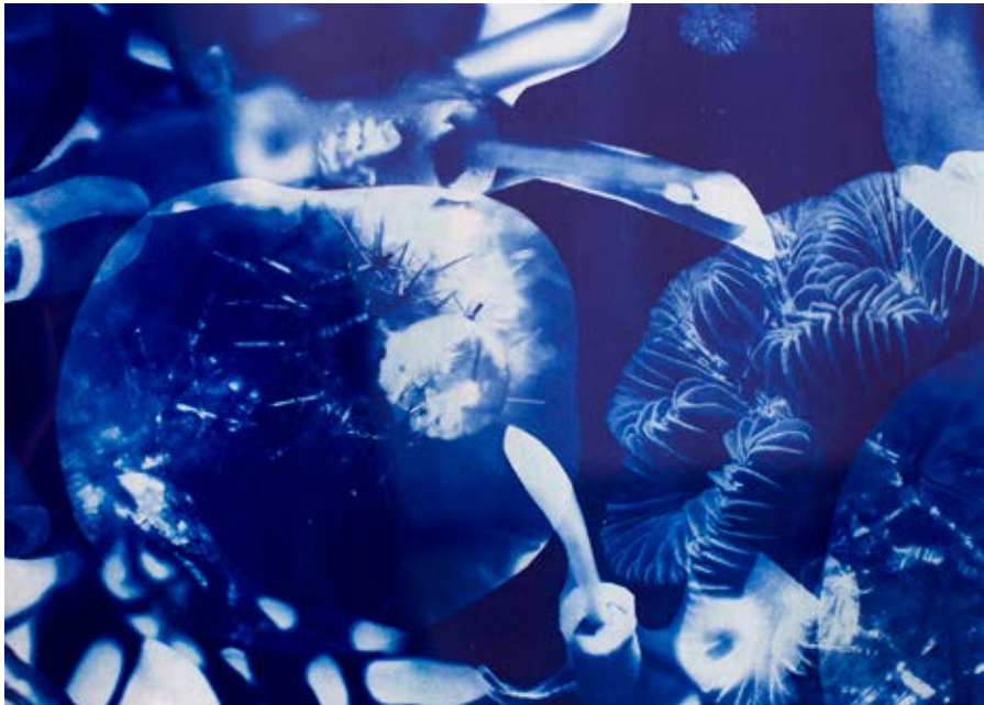
Fig. 7. Teratos , 2019.