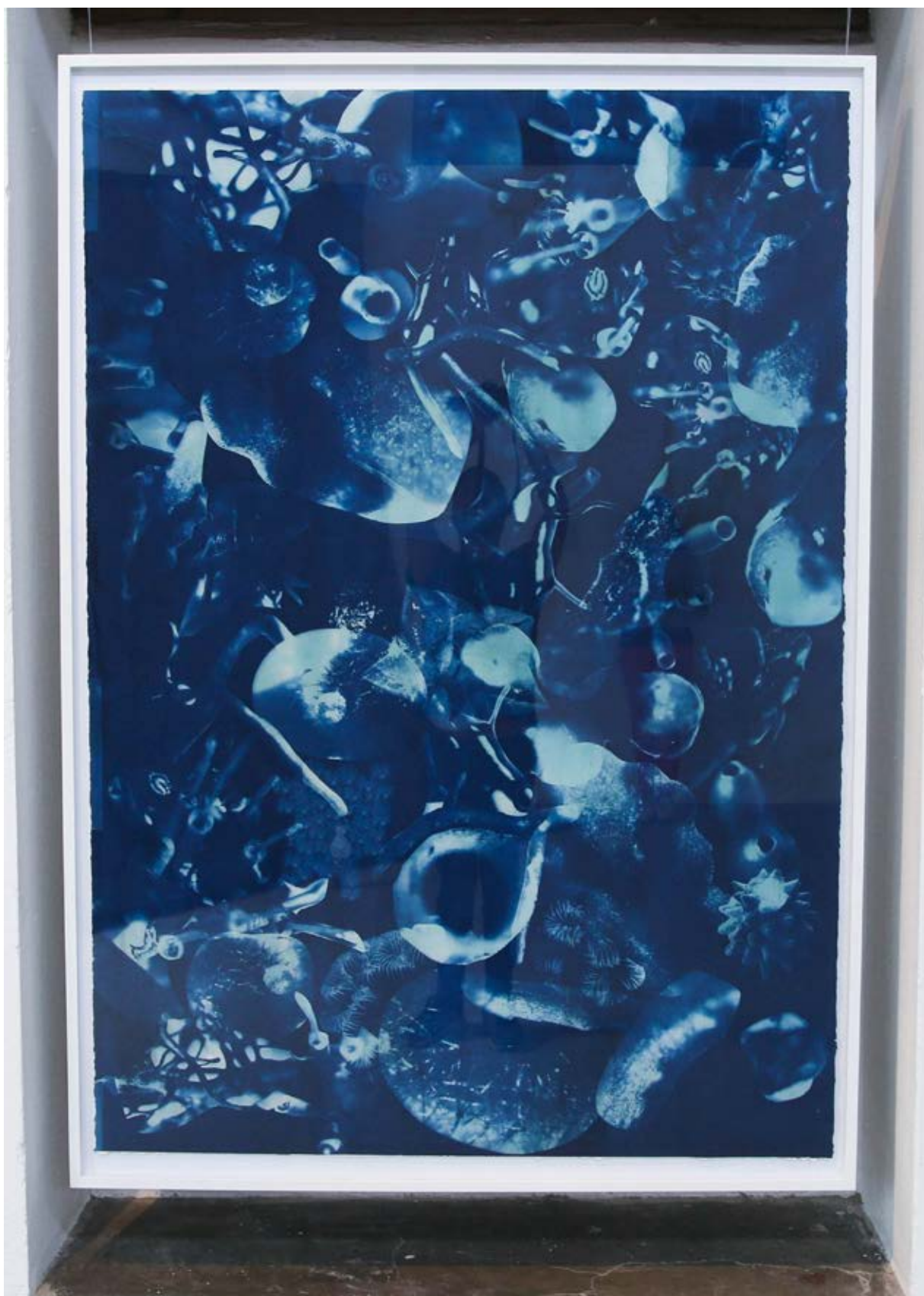
Figura 8. Teratos , 2019.