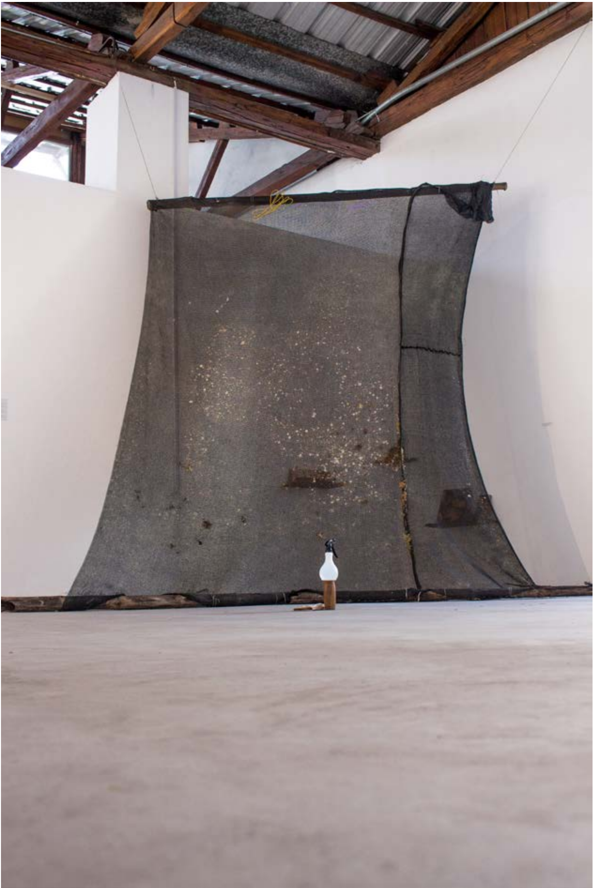
Figura 12. Evidencias 3 x 3 , 2017.