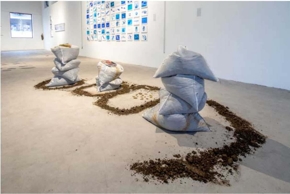
Figura 15. Producción 2019 , 2019.