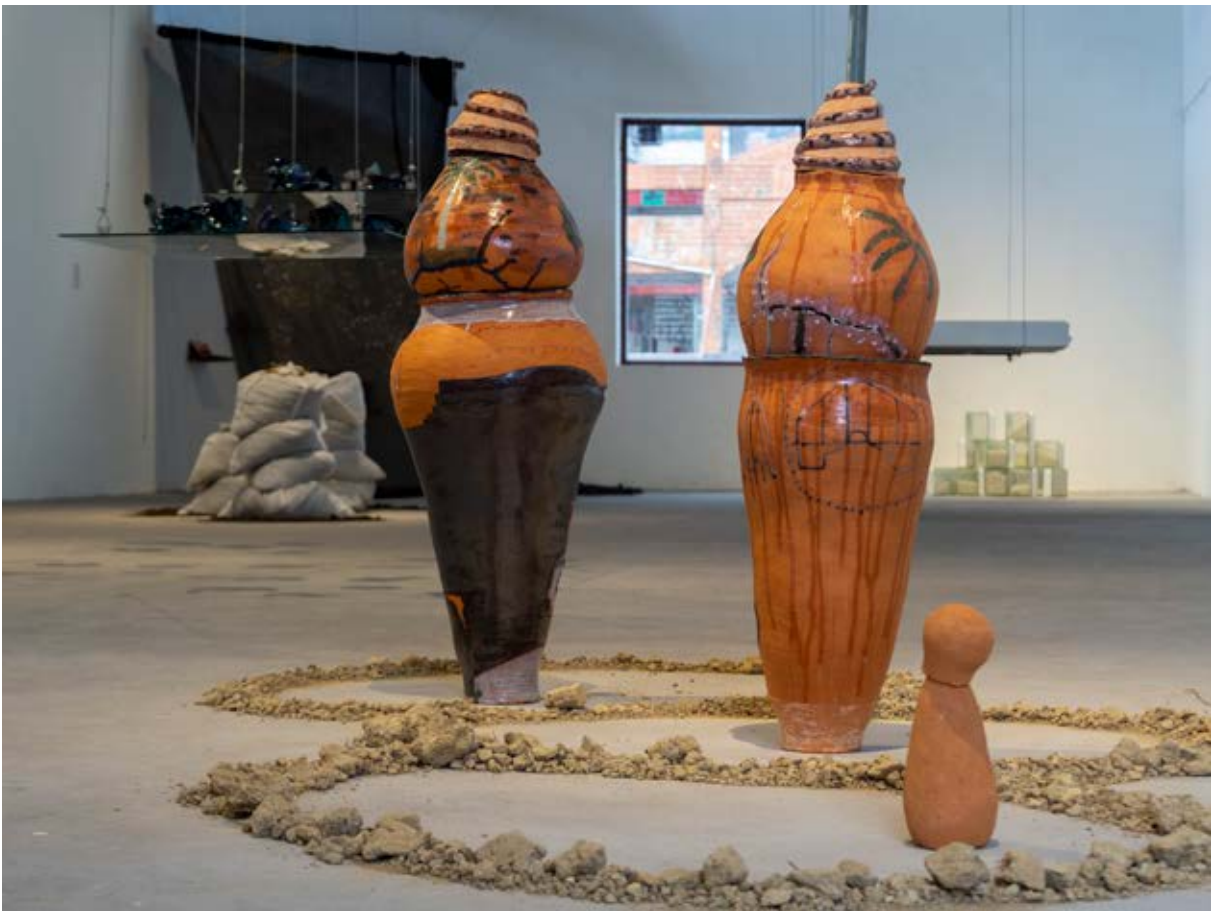
Figura 16. La Cura , 2019. Fotografía de Nicolás Saavedra, 2019.