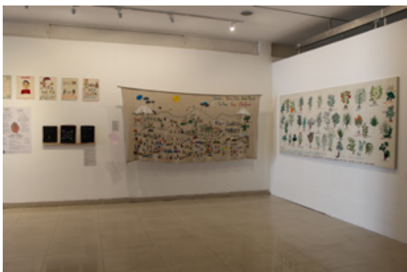
Figura 6. Vista parcial del grupo Hilar lo común. Memorias de lo vital . Experiencia Mujeres Bordando (2017) de Alejandro Cevallos y María Elena Tasiguano en Estrategias sublevantes...

Hilar lo común. Memorias de lo vital (fig. 5 y 6)