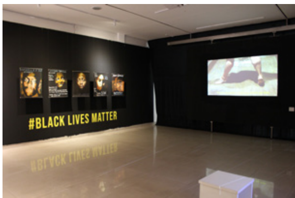
Figura 9. Vista parcial de Intersecciones. La insurrección