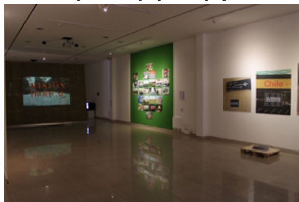
Figura 7. Vista parcial de Irreverencias. Crear en medio del abuso en Estrategias sublevantes...

se planteó como una aproximación narrada desde dos experiencias complejas y llenas de belleza en múltiples sentidos, en su esfuerzo por restaurar la energía creadora de dos comunidades azotadas por el poder dominante. Por un lado, desde el bordado ( Mujeres Bordando ), por el otro desde las artes escénicas, con el Colectivo Yama ( Memorias de Agua ). En uno, desde las mujeres que han migrado del campo a la ciudad, las mujeres del mercado de San Roque, en Quito, quedando despojadas a la fuerza de sus rutinas cotidianas y modos de relacionamiento; y, en otro, desde la comunidad campesina de Masín en el Alto Perú, golpeada y desarticulada en sus principios de autonomía por la violencia de la guerrilla y del Estado en los años 80 del siglo XX. Pero, en ambos casos, revitalizadas en lo pequeño desde la activación de su reflejo en el bordado como espacio pedagógico en doble vía, la economía feminista y la acción teatral, devenida festival anual como devolución al pueblo del que partió la propuesta.