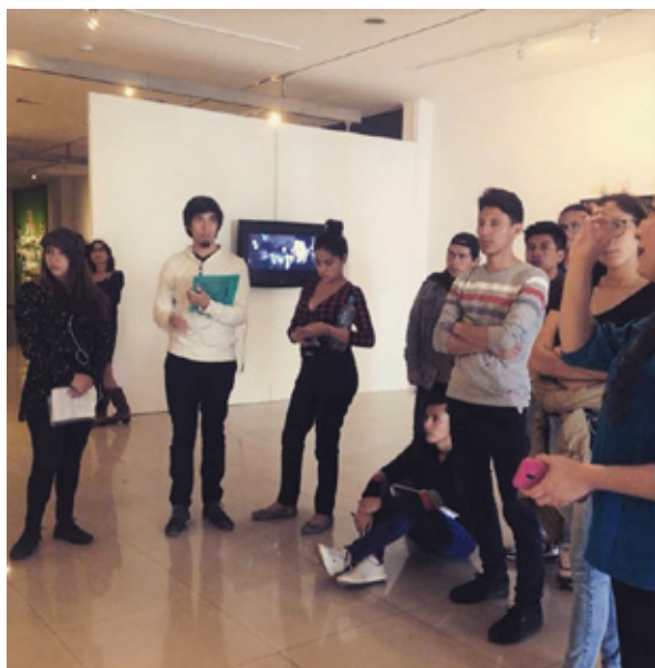
Figura 2. Visita de estudiantes de la UCE a Estrategias sublevantes ...

Estrategias sublevantes. Lo sensible en acción fue inaugurada el 11 de diciembre de 2019 en la galería FLACSO Arte Actual con la asistencia numerosa e interesada del público, y el despertar de varios debates dentro y fuera de la sala (fig. 2). Muchos diálogos fueron posibles entre les artistas participantes en la muestra, el público y sus curadores, a través de las que FLACSO Arte Actual llama visitas mediadas.