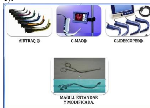
Figura 1.- Laringoscopios y pinzas de Magill utilizados en el estudio

Se ha diseñado este estudio para comparar las pinzas de Magill estándar (rectas) con pinzas de Magill modificadas (inclinadas o curvadas), durante la intubación con laringoscopia indirecta, con la ayuda de tres laringoscopios indirectos (Airtraq®, C-MAC® y Glidescope®) para pacientes con Vía Aérea Difícil conocida (VAD), por vía nasotraqueal (Figura 1).