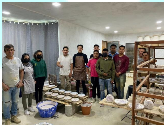
Figura 3. Artesanos de San Pablo del Monte

El grupo de artesanos expresó entre las principales razones para decidir integrarse al oficio de la talavera: (a) motivación personal, (b) invitación de parte de algún familiar o amigo, (c) tradición (d) observación directa; y (e) experiencia en el trabajo en barro. En este sentido, se reconoce que los motivos que condujeron a los participantes a inmiscuirse en la elaboración de las artesanías en talavera son diversos, destacando la cercanía o el contacto con el oficio, el vínculo por herencia familiar, el reconocimiento de esta actividad mediante terceros o por conocimiento previo de la misma.