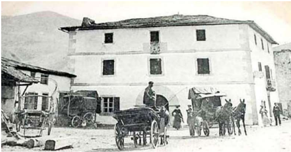
Antigua vista de la carretera por Valcarlos.

El acto terminó con un magnífico banquete, del que se conserva documento escrito de las viandas que en el mismo se sirvieron. El banquete se llevó a cabo en el Hotel Ferran. Constó de ocho platos sucesivos más postres, bien regados todo con “vinos franco-españoles”. Comenzó con tapioca, seguido de salmón a la chapitela, costillas de Burguete y bocados a la Ibañeta. Por si esto fuera poco, se sirvió a continuación lievre (sic) valcarlina y perdiz de Gorosgaray, Bisaltos de Gaindola (una variedad de guisantes) y Espinacas de Pertole, pavos rellenos de Gainecoleta y gigot de Roncesvalles (pierna de cordero), terminando con un plum puding navarro. Como se observa, un auténtico triunfo de los productos de proximidad, o de “kilómetro cero” como se dice ahora. Lo que no señalan las crónicas es cómo terminaron los estómagos de los “sufridos” comensales. Las mismas crónicas indicaron que el banquete dio inicio a las cuatro de la tarde y que duró hasta las once de la noche. No es de extrañar dado el pantagruélico menú servido.