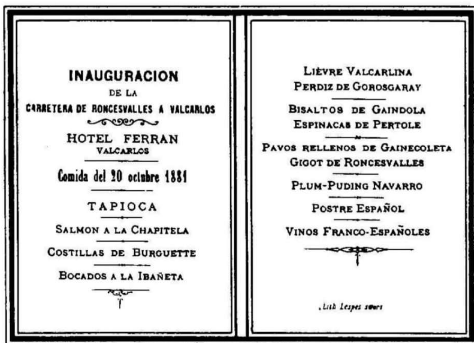
Tarjeta con el menú servido en el banquete de Valcarlos.