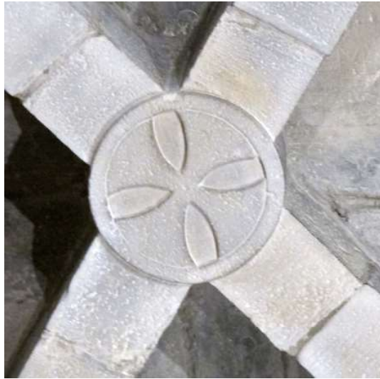
Iglesia de Santiago de Sangüesa. Detalle