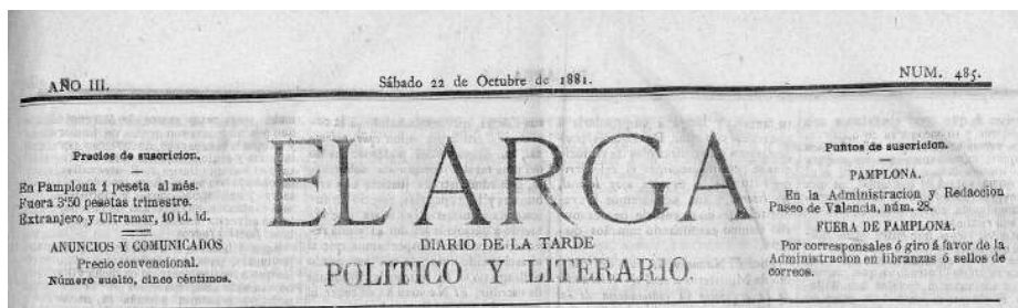
Cabecera del periódico ARGÁ, del día 22 de octubre de 1881.

Un documento que llegó a nuestras manos, con el menú que se sirvió en los actos de inauguración de la carretera de Roncesvalles a Valcarlos, ha sido el origen de este artículo que ahora presentamos. Dicha inauguración tuvo lugar el jueves 20 de octubre de 1881. La grandiosidad y variedad del menú no puede sino asombrar hoy en día; por ello hemos rastreado en la prensa de la época tal acontecimiento. Los datos de nuestro trabajo proceden de la crónica del evento, escrita con detenimiento por un articulista del que no se indica nombre. Lo hizo en dos números del periódico ARGÁ; concretamente se trata del número 483, correspondiente al día 20 de octubre de 1881 (pg. 2) y el número 485, correspondiente al día 22 de octubre de 1881 (pgs. 2-3).