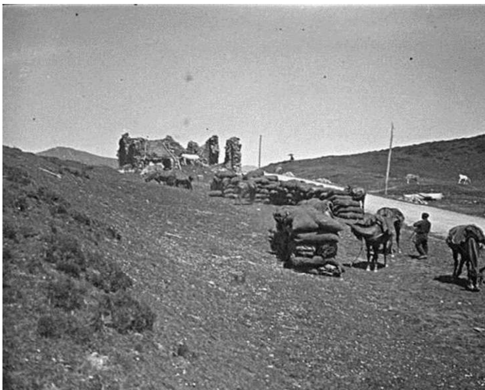
Alto de Ibañeta, con las ruinas de la antigua ermita. En ese lugar se procedió a la inauguración de la carretera.