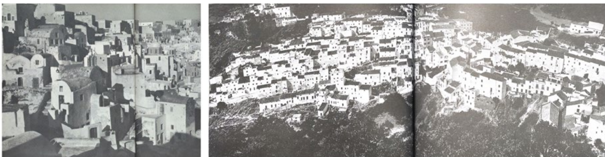
Identidad - Paisaje