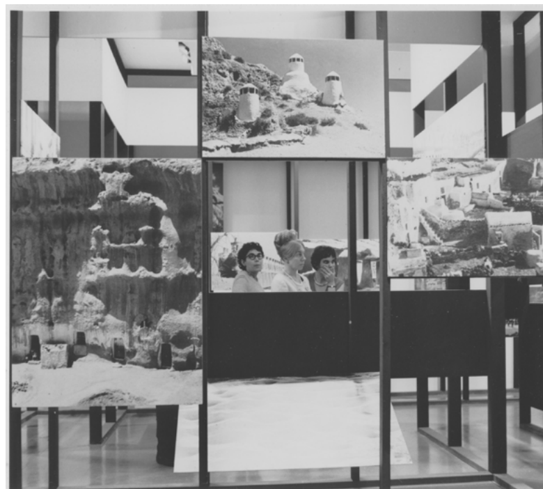
Figura 3: Fotografía de la exposición de Bernard Rudofsky Architecture Without Architects , celebrada en 1964 en el MoMA de Nueva York

El viaje, que Rudofsky entendía como un medio de conocimiento, es un elemento esencial en su obra. Desde sus primeros años en la Technische Hochschule de Viena Rudofsky pronto descubrió su pasión por el viaje, que le permitió conocer y estudiar las formas de vida y la arquitectura de todos aquellos lugares que visitó. Pronto su afán de descubrimiento le llevó a los lugares más recónditos tanto de Europa como de otros continentes, donde pudo analizar la arquitectura y las formas de vida locales. El viaje