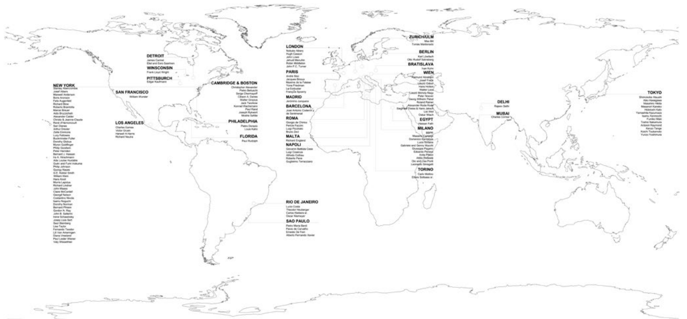
Map of Rudofsky's Personal And Professional contacts

We are the sum of the people we meet. The people we love, those who have brought something to us, who have appreciated us, from whom we have learned, with whom we have shared ideas, and with whom we have spent time. It would be vain and inappropriate, in this book, to attempt to describe the nature of the relations Rudofsky had with all the people he met, or to include an anecdotal or chronological reconstruction of them.