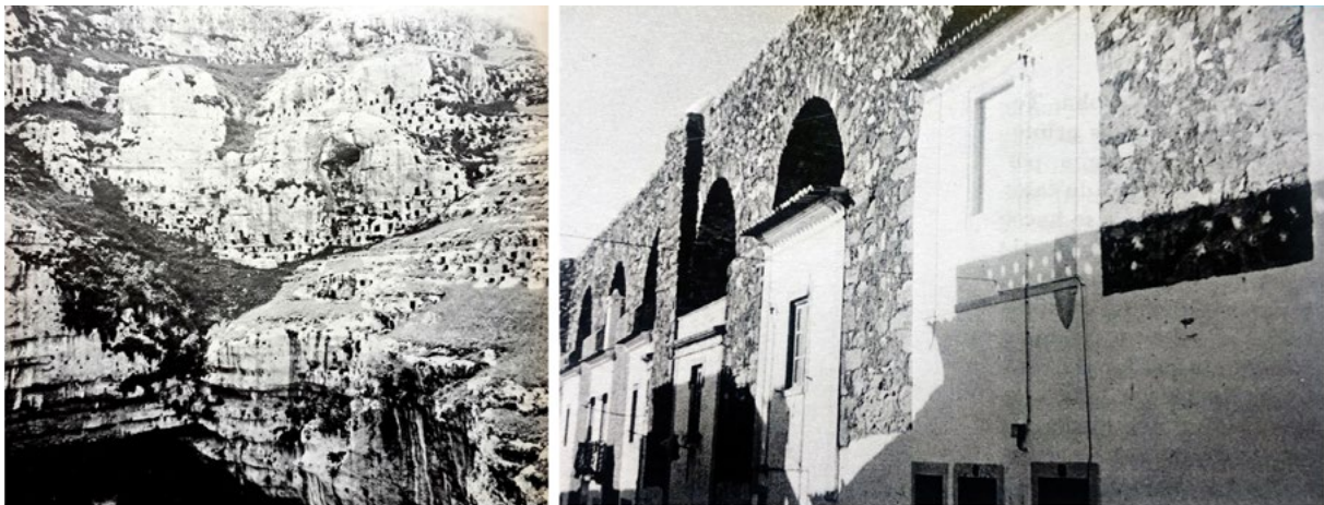
Versatilidad - Transformación

De este modo, se ha podido verificar la hipótesis de la propia dicotomía discursiva dentro del propio trabajo de Rudofsky, una dicotomía que habla de la desvinculación de cada discurso particular dentro de uno general que los abarca y reconoce. Así mismo, se ha visto refrendado el entendimiento del material de estas obras como parte de un discurso gráfico con una forma y un significado propios.