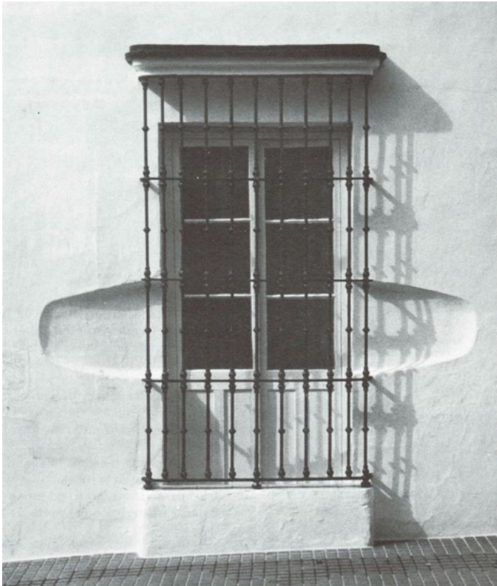
Figura 2: Fotografía de Bernard Rudofsky aparecida en la publicación The Prodigious Builders , 1977