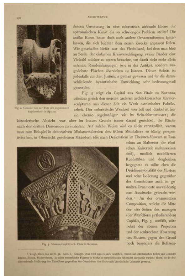
Figura 1: Página completa de la publicación Die spätromische Kunst-Industrie nach den Funden in Österreich-Ungarn de 1901, de Alois Riegl, tomada de Lockard 2016

La singularidad metodológica de Rudofsky tiene algunos precedentes, como la obra de 1901 Die spätromische Kunst-Industrie nach den Funden in Österreich-Ungarn (El Arte Decorativo Romano-Tardío según los Descubrimientos en Austria-Hungría) del historiador del arte austriaco Alois Riegl (1858–1905). Su metodología descriptiva y analítica bien pudo influir en la de Rudofsky. De especial relevancia es la reflexión que el autor austriaco realiza sobre la información que puede ser transmitida a través del texto de una obra y aquella que puede serlo a través de las ilustraciones que lo acompañan, así como sobre el diálogo que se establece entre ambos. Este enfoque, que causó cierta controversia, parece que pudo haber servido como referencia a Rudofsky. En Die spätromische Kunst-Industrie nach den Funden in Österreich-Ungarn el propio Riegl señaló el rechazo que su aproximación sufrió por parte de la Academia, por haber realizado una valoración artística de los objetos tardo-romanos y altomedievales como elementos pertenecientes a un contexto específico, alejándose de la objetividad analítica propia del discurso dominante.