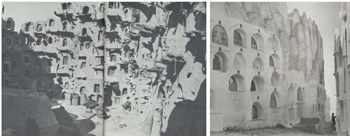
Forma - Espacio