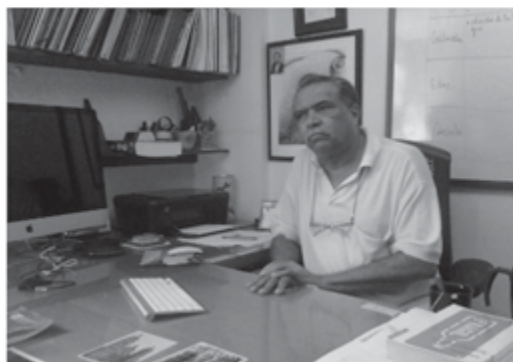
Fotografía tomada por las autoras, desde un dispositivo móvil en el estudio de su residencia en Riohacha, La Guajira (2012).

El Maestro en sus reflexiones se planteaba la siguiente pregunta: “¿cómo debo actuar con los estudiantes para que éstos se pongan en disposición de aprender? Indudablemente que siendo ‘mediador’, ser mediador lo ‘intento a conciencia’, procuro encontrar elementos que puedan ser más comprensibles sin bajarle el nivel teórico o conceptual, me encanta ver que me captan a través de los diagramas y mapas conceptuales, siento la fuerza de su alegría y de su gozo porque entendieron” Pérez (2012).