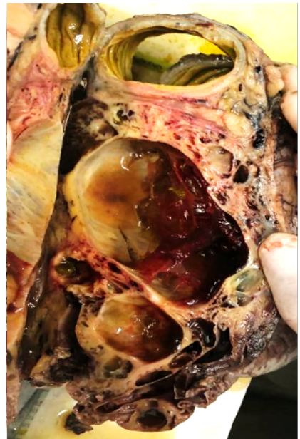
Figura 1. (A y B) Masa íntimamente adherida a la pared del colon transverso, de aspecto multiquístico y altamente vascularizada.