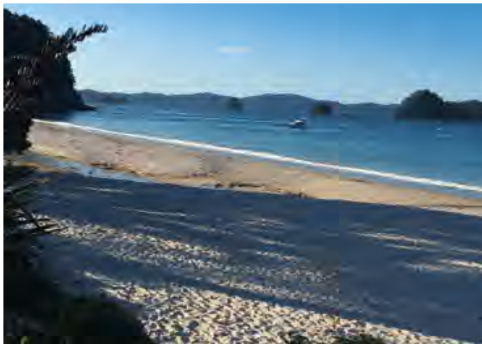
Hahei, Whitianga & Rotorua. New Zealand.