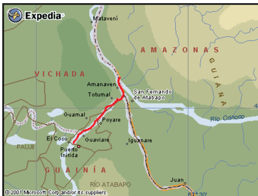
Figura 1. Río Atabapo

El río Atabapo Está localizado en el extremo oriental de Guainía; marca el límite entre Colombia y Venezuela. Las poblaciones cercanas son Puerto Inírida y Amanavén, en la desembocadura del Guaviare (Colombia) y San Fernando de Atabapo (Venezuela). Marca el límite entre Colombia y la hermana República de Venezuela en casi todo su recorrido, lleva en su lecho aguas negras brillantes que se convierten en rojas en pequeña cantidad. Es inmensamente ancho, casi dos kilómetros, para su relativamente corta longitud (Figura 1).