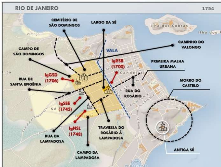
Foto 6 – As afroconfrarias estabelecem a toponímia dos logradouros

limites desse novo perímetro, conformando, junto com a IgGSD, a nova fronteira urbana de uma cidade expandida e “integrada”.