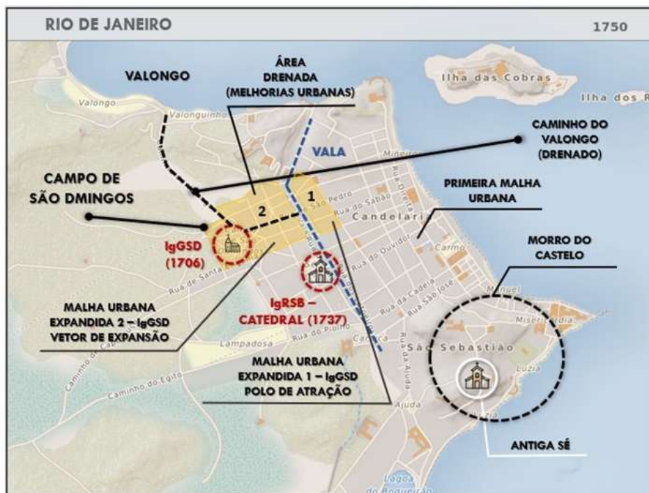
Figura 4 – IgGSD, promotora da expansão e da “drenagem” urbanas Mapa elaborado pelo autor

As disposições da sinodal baiana nos atestam que os edifícios de culto das irmandades negras estavam expressamente proibidos de serem construídos em lugares indecentes, insalubres e de pouca comodidade. E mesmo assim o foram. Por isso importa aqui demonstrar que essas exigências – não cumpridas, é claro – confirmam o papel das afroconfrarias como um “instrumento saneador” de primeira ordem ante os imperativos deterministas da ambiência.