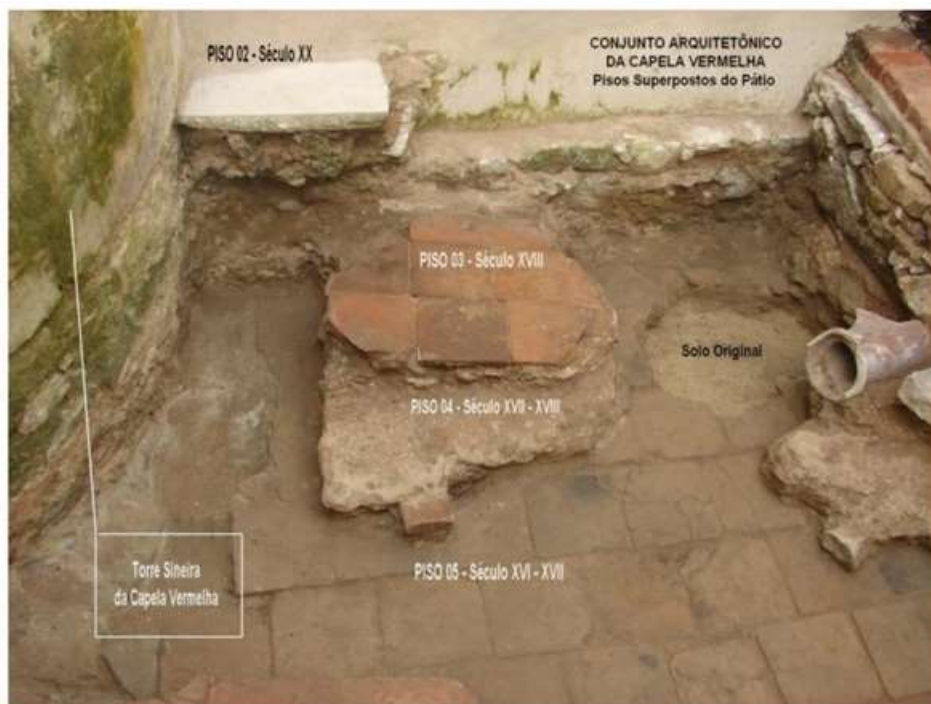
Figura 5 – Sobreposição de pisos, ao longo dos séculos, demonstrando a capacidade dos templos como “instrumentos saneadores” de superfícies pantanosas

arquitetônicas (NETO, 2021, p. 236-304), ele também funcionou, em paralelo, como uma grande “espoja de concreto”, sendo responsável por absorver, drenar e obliterar metros quadrados de uma superfície aquosa e pestilenta. Assim acreditamos que função similar exerceu a IgGSD e os demais “templos negros” no Rossio da cidade (Figura 5).