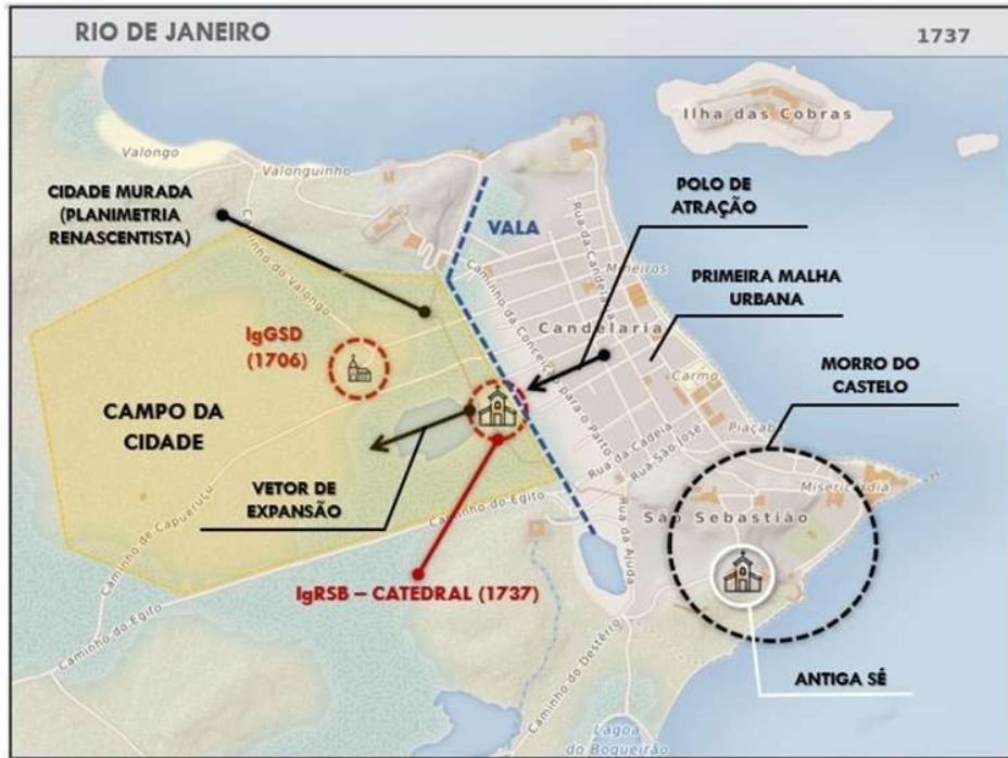
Figura 1 – IgRSB como polo de atração e vetor de expansão urbana Mapa elaborado pelo autor