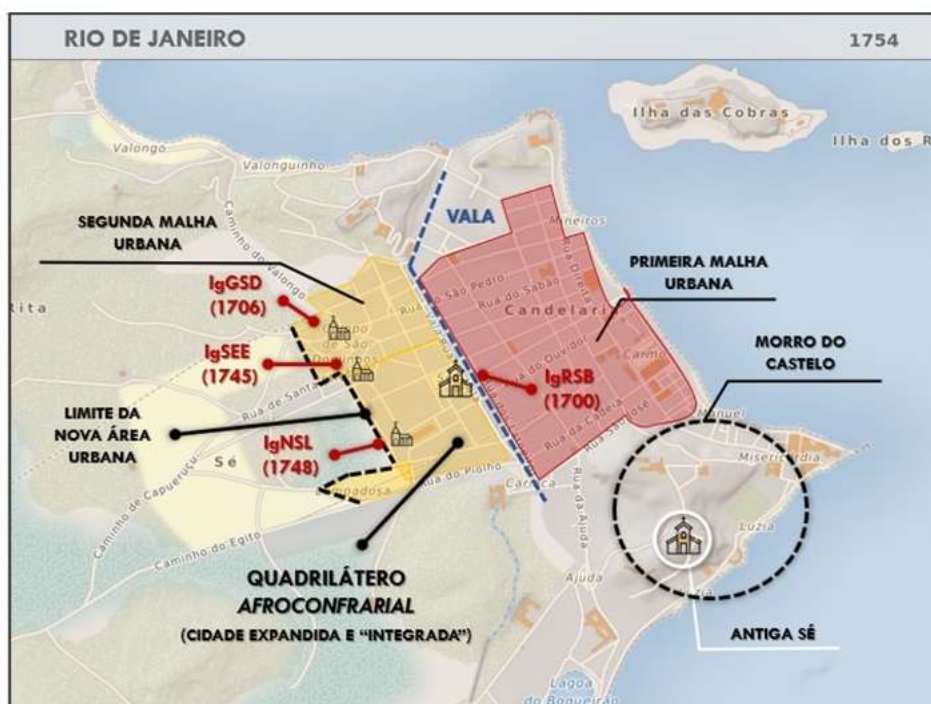
Figura 7 – O urbanismo e o quadrilátero “afroconfrariais”

Forjou-se, então, fruto de uma iniciativa subalterna, o “urbanismo afroconfrarial”: um tipo de produção do espaço urbano constituída a partir das “fábricas” construtivas de “templos negros”, promotoras da segunda malha urbana periférica transformada em arrabalde – o quadrilátero “afroconfrarial” (Figura 7). Igrejas que se constituíram em “raias” ou “marcos” espalhados por um tecido que sistematicamente ajudaram a “sanear” e urbanizar (MARX, 1989, p. 116), retratando os processos de parcelamento e acumulação de propriedades fundiária e imobiliária (FRIDMAN, 2017, p. 15). Acrescentamos que a presença física dos templos trouxe certa ordem urbana, aguçando ainda mais a procura por lotes neste espaço e fazendo da arquitetura religiosa negra, na tentativa de minimizar a política de afastamento social, um campo de interlocução com a matriz dominante. Quando o tema é o processo de urbanização do Rio de Janeiro durante o século XVIII, procuramos assegurar que o “urbanismo afroconfrarial” entrasse na memória e na história da cidade com o mesmo protagonismo e importância alcançados pelas instituições eclesiásticas hegemônicas – eis a envergadura da diáspora africana na produção do espaço urbano carioca.