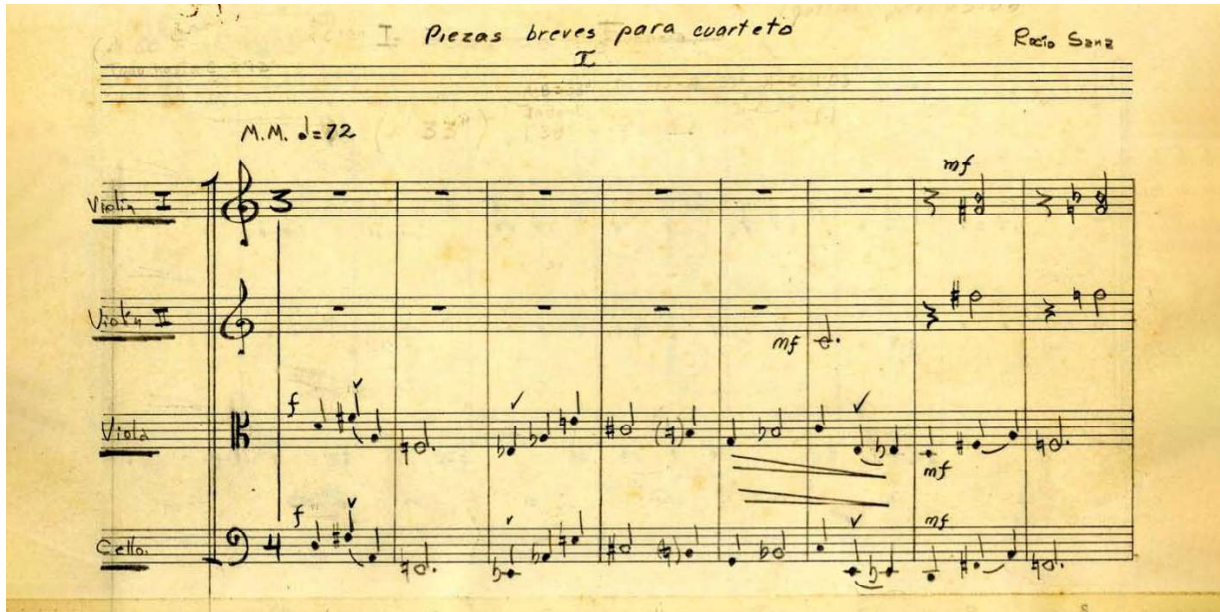
Imagen 3. Incipit Ms Pieza breve para cuarteto I de Rocío Sanz Quirós