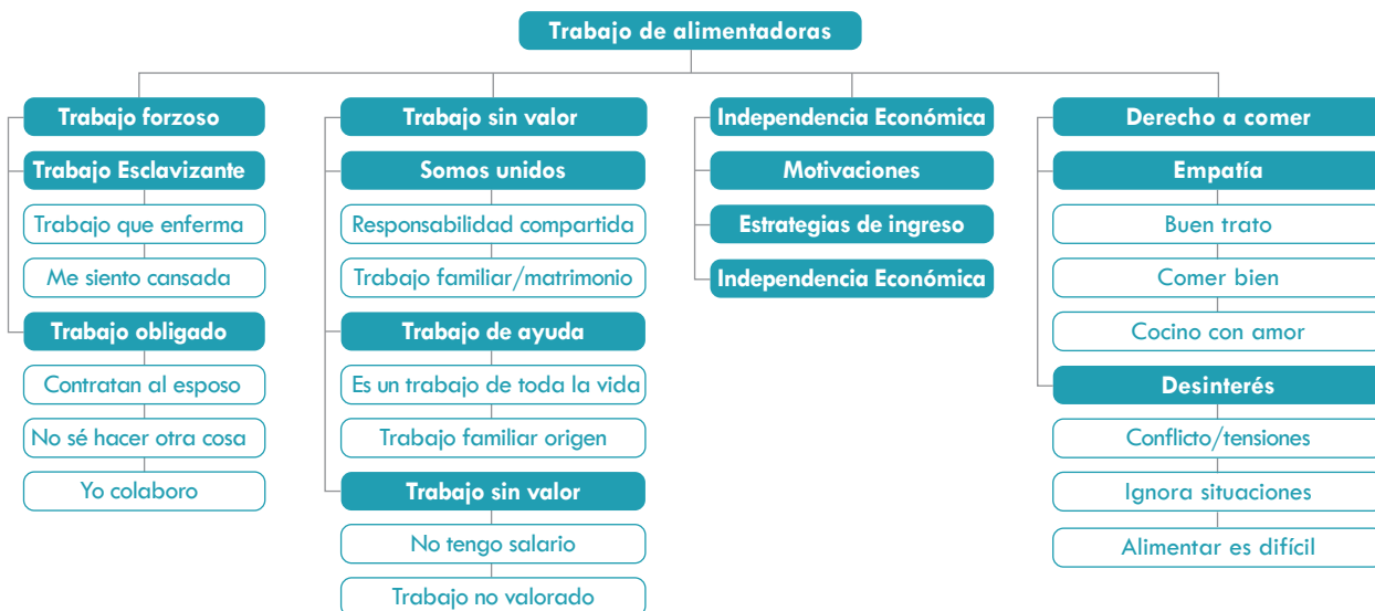
Figura 3. Mapa conceptual “Trabajo de alimentadoras”