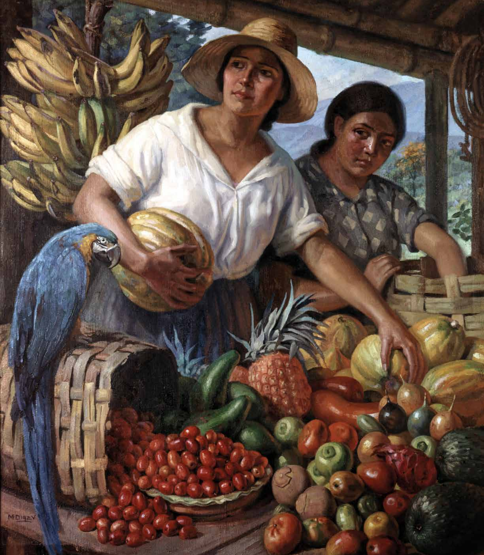
Figura 7 Miguel Díaz V Vargas. Mercado, pintura V (óleo/tela) 128,5 x 110,5 cm Fuente: Díaz (1944)