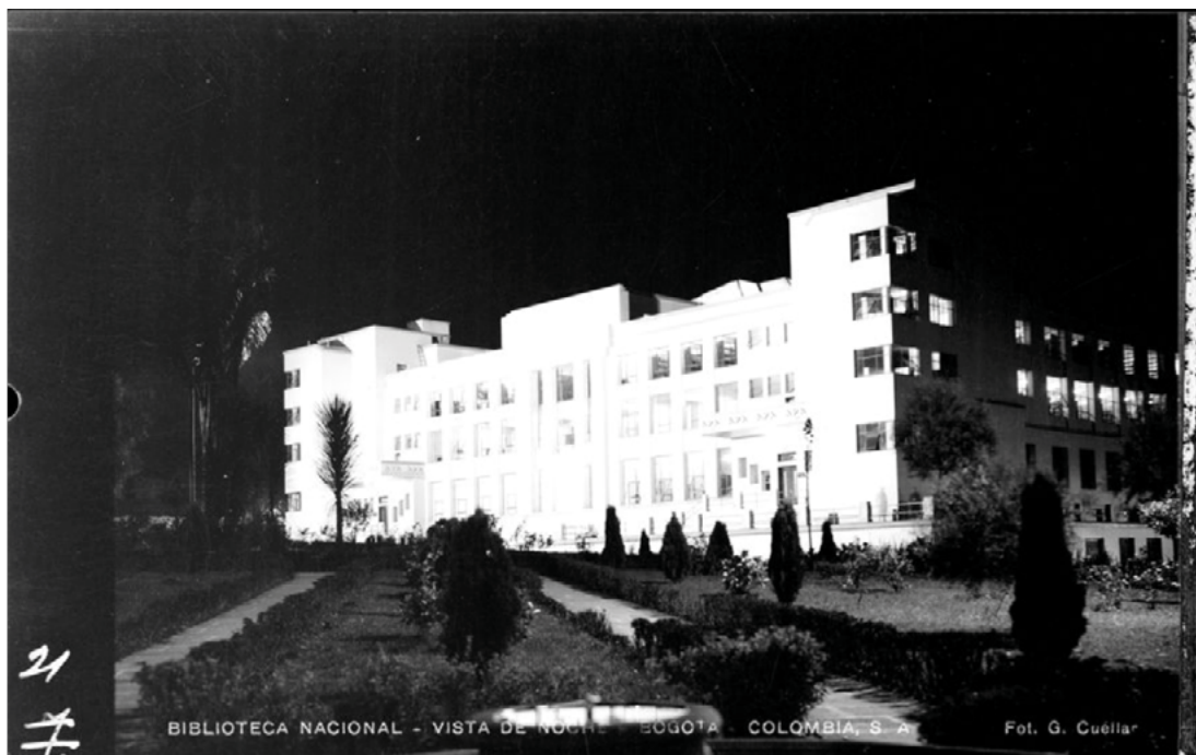
Figura 2. Vista nocturna de la Biblioteca Nacional de Colombia

Regresando al discurso de Gaitán, es relevante recordar que su importancia ha sido resaltada, como se indicó, porque es concebido como uno de los primeros indicios de democratización cultural del país, además de ser el gesto público mediante el cual se institucionalizó este programa, del que también se ha dicho es producto de muestras que lo antecedieron. 6 De acuerdo con lo planteado por María Elvira Iriarte, la institucionalización del Salón Nacional de Artistas ya se venía organizando desde antes que Gaitán asumiera la cartera de educación del presidente Eduardo Santos: “La iniciativa de instituir los Salones Nacionales, propuesta por doña Teresa Cuervo Borda, fue parte de una reestructuración de la Sección Cultural y de Bellas Artes,