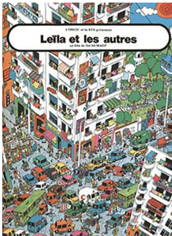
Figura 3. Portada de Leïla et les autres