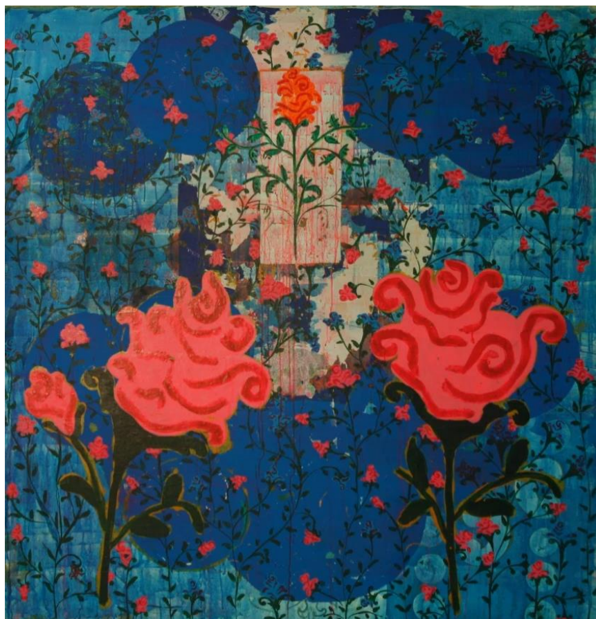
Estive Feliz de Saber que Você Está Bem, Beatriz Milhazes – 1990.

La reunión que se inicia hoy es la primera que, en el ámbito de la cooperación UMCE-UnB, se realiza de manera presencial después de dos años y medio de distanciamiento social impuesto por la crisis del CORONAVIRUS y del COVID-19. La pandemia del COVID-19 impuso a todos nosotros –chilenos y brasileños y al resto del mundo– la distancia social, pero no el alejamiento afectivo e intelectual, pues en estos últimos 30 meses estuvimos presentes – delante de las pantallas de nuestras computadoras–, online , y buscamos mantenernos unidos, pensando acerca de la experiencia extrema que estamos viviendo, experiencia traumática en la que algunos de nosotros –lamentablemente– han perdido familiares, amigos, compañeros de trabajo o vecinos. A lo largo de este período, nosotros intentamos estar cercanos los unos a los otros, ser resilientes y actuar. Según registró el escritor y filósofo Frédéric Lenoir al reflexionar acerca de la pandemia: “Nosotros actuamos comprobando el carácter inestable del juicio que