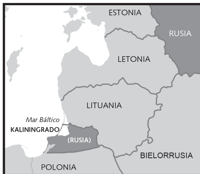
Figura 1. Mapa y situación de Kaliningrado.