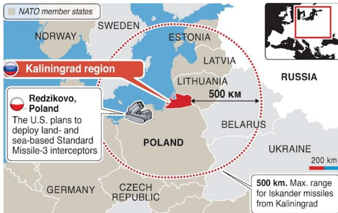
Figura 2. Mapa del perímetro de alcance de los misiles Iskander desplegados en Kaliningrado.

Tomado como una nueva afrenta, el Kremlin ordenó la instalación de los polémicos misiles Iskander en respuesta al nuevo escudo antimisiles. Las notables y sofisticadas cualidades de este tipo de proyectiles hicieron sonar las alarmas en las estructuras de defensa de los aliados. Los Iskander pueden alcanzar una velocidad de match 5 (hiper-sónica), y pueden volar a 40.000 metros de altura, por encima del reconocimiento de la inmensa mayoría de radares. No obstante, su punto débil es su fragilidad electrónica, ya que pueden ser desviados o entorpecidos por señales de radiofrecuencia 34 . Aún a pesar de este inconveniente, su riesgo, velocidad y habilidad para esquivar radares suponen un potencial peligro para las fronteras de la UE y la OTAN. Hasta ahora, esta ha sido, quizá, la mayor amenaza rusa a Europa desde el fin de la Guerra Fría y la caída de la URSS.