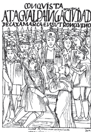
Conquista / Atagualpa Inga está en la ciudad de Cajamarca en su trono. Usno / Almagro / Felipe Indio, lengua / Pizarro / Fray Vicente (Valverde) / Usno, trono. Asiento del Inca / se sienta Atahualpa Inca en su trono.

GUAMAN POMA EN SU Nueva crónica y buen gobierno (ca. 1616) presenta casi 400 ilustraciones que registran las secuencias históricas y alegóricas relatadas en su texto. Una de esas ilustraciones, titulada «Conquista Atagualpa Inga esta en la ciudad de Cajamarca en trono usno» (véase imagen 1), coloca en escena visual a Atahualpa, quien, sentado en un usno , oye las palabras que pronuncia Vicente Valverde a partir de la lectura de un libro. En esta acción comunicativa, destaca una presencia mediadora que permite —al menos formalmente— llevar a cabo el intercambio verbal entre ambas partes, el intérprete Felipe Indio. 2 En la imagen, además, se encuentran Francisco Pizarro, Diego de Almagro y la corte que acompañan a Atahualpa hacia el encuentro de Cajamarca. La cruz, las armas y la mask'aypacha son los elementos que completan la imagen.