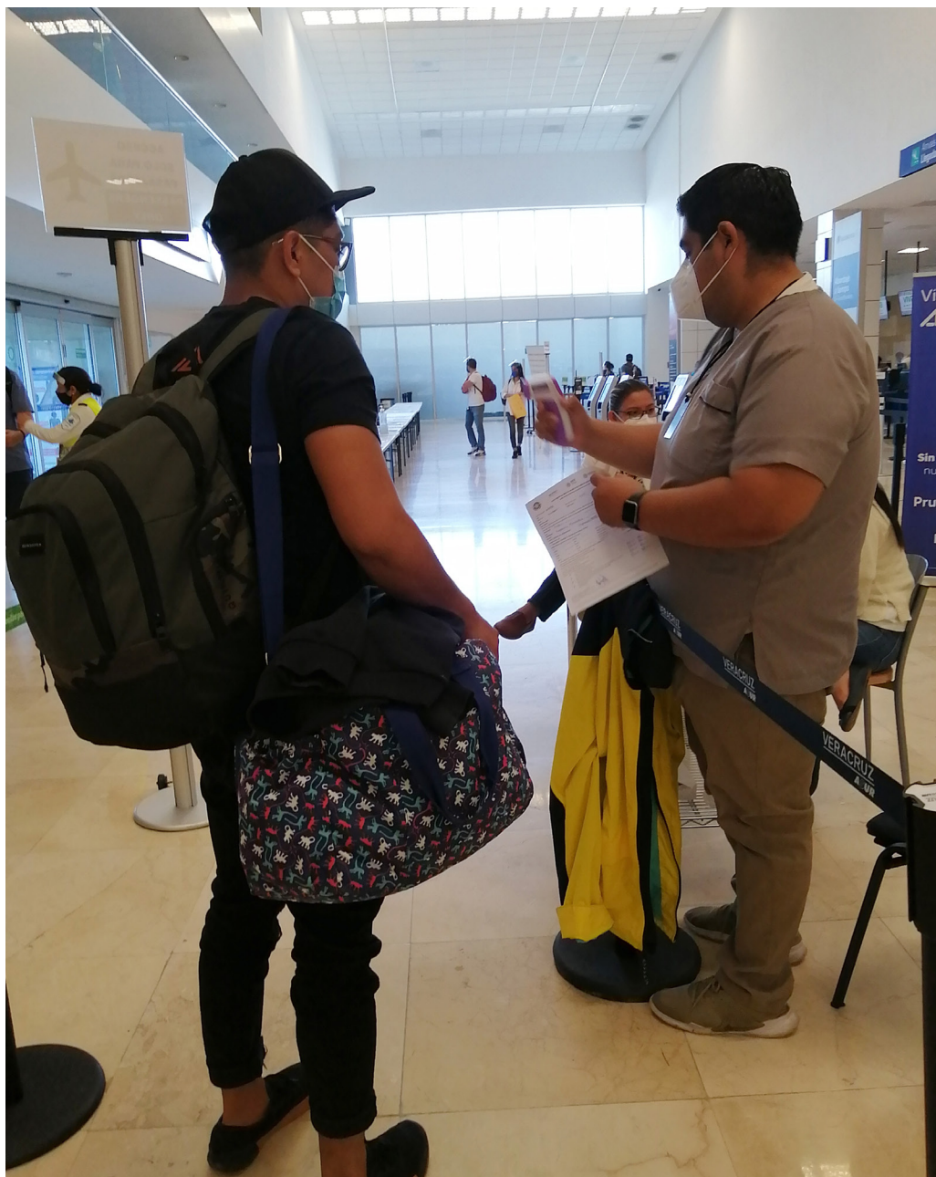
Figura 4. Módulo de revisión sanitaria antes de ingresar a la fila de documentación (Veracruz, 2020).