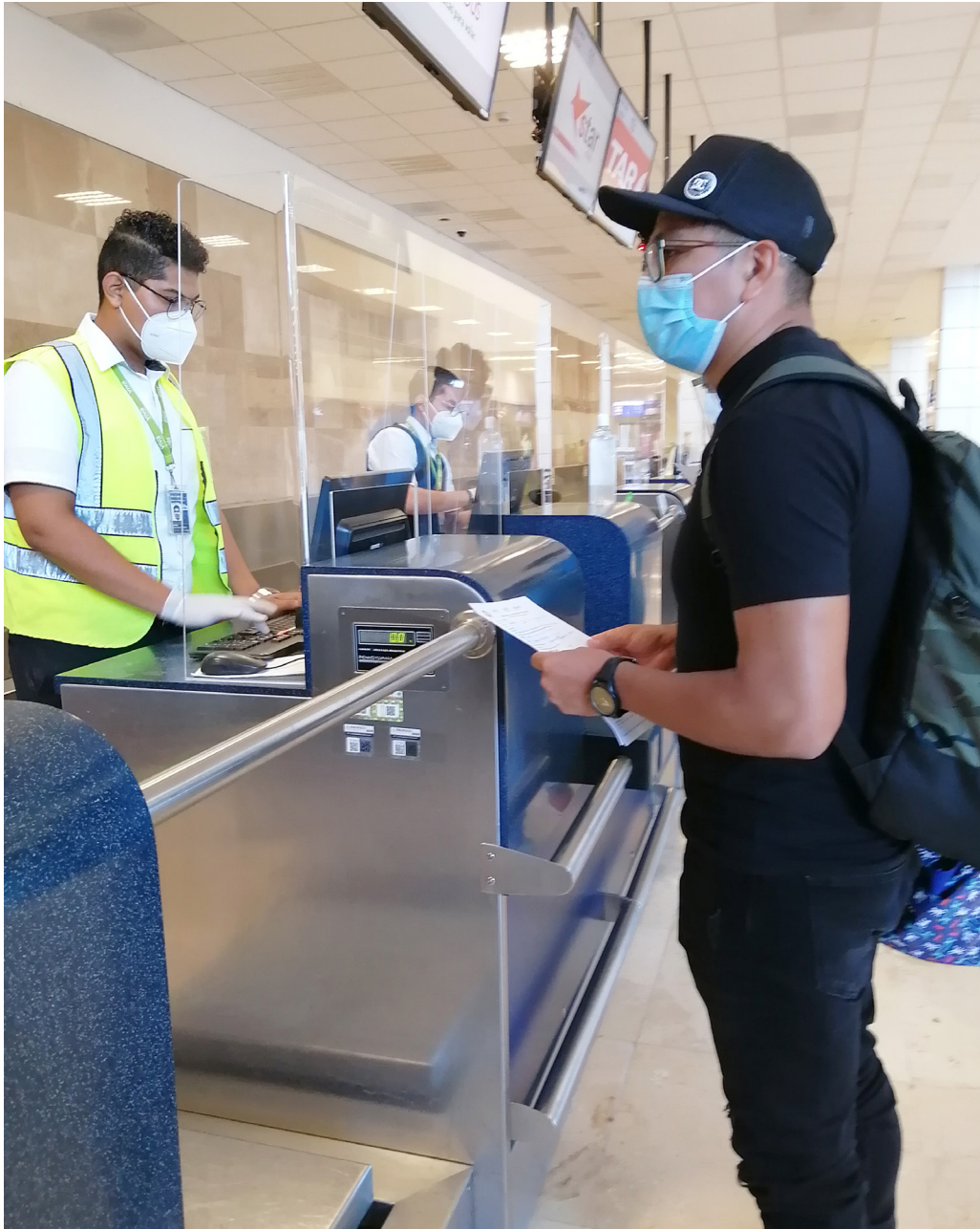
Figura 6. Mostrador de la aerolínea para atención al pasajero (Veracruz, 2020).