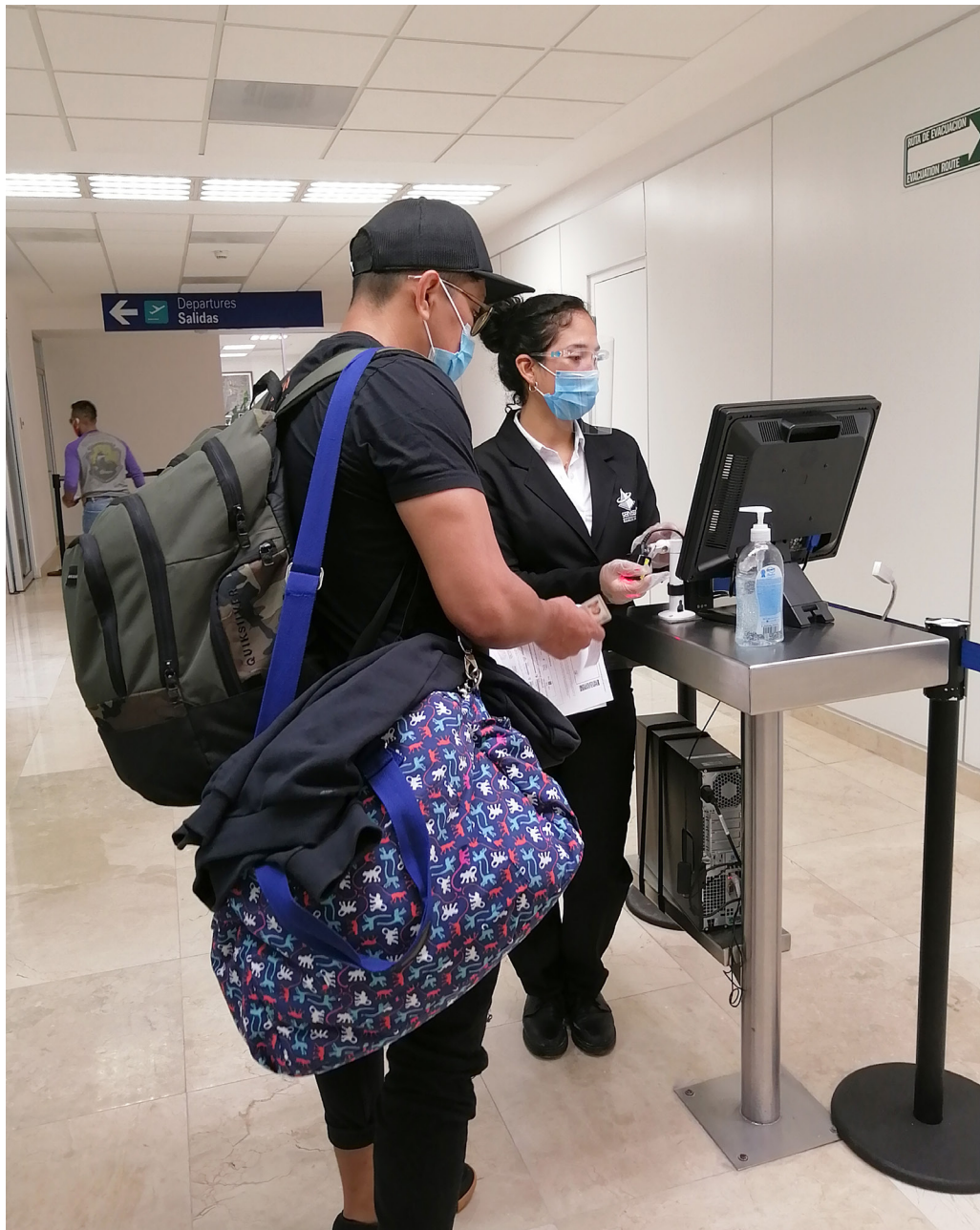
Figura 8. Puesto de control de seguridad para pasajeros (Veracruz, 2020).