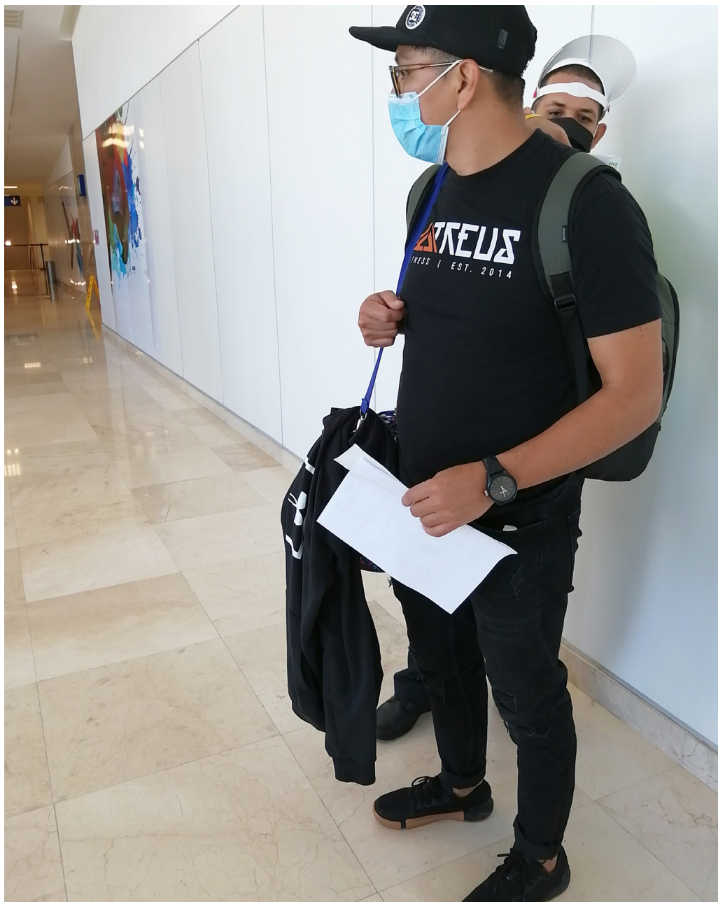
Figura 10. Revisión de equipaje y documentación por personal de la aerolínea en la sala última de espera (Veracruz, 2020).