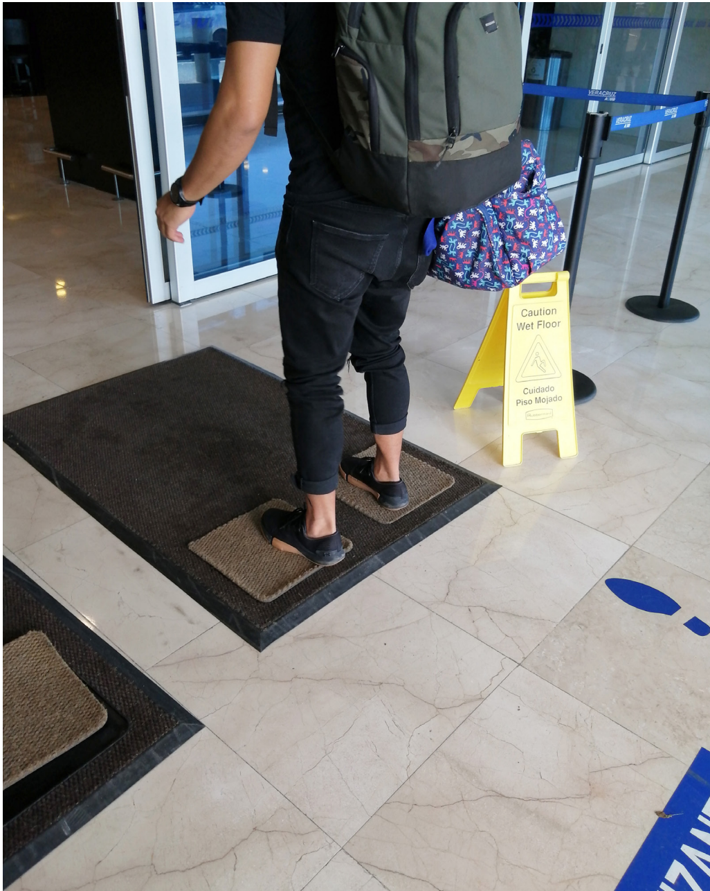
Figura 2. Turista es recibido con gel antibacterial y alfombra desinfectante (Veracruz, 2020).