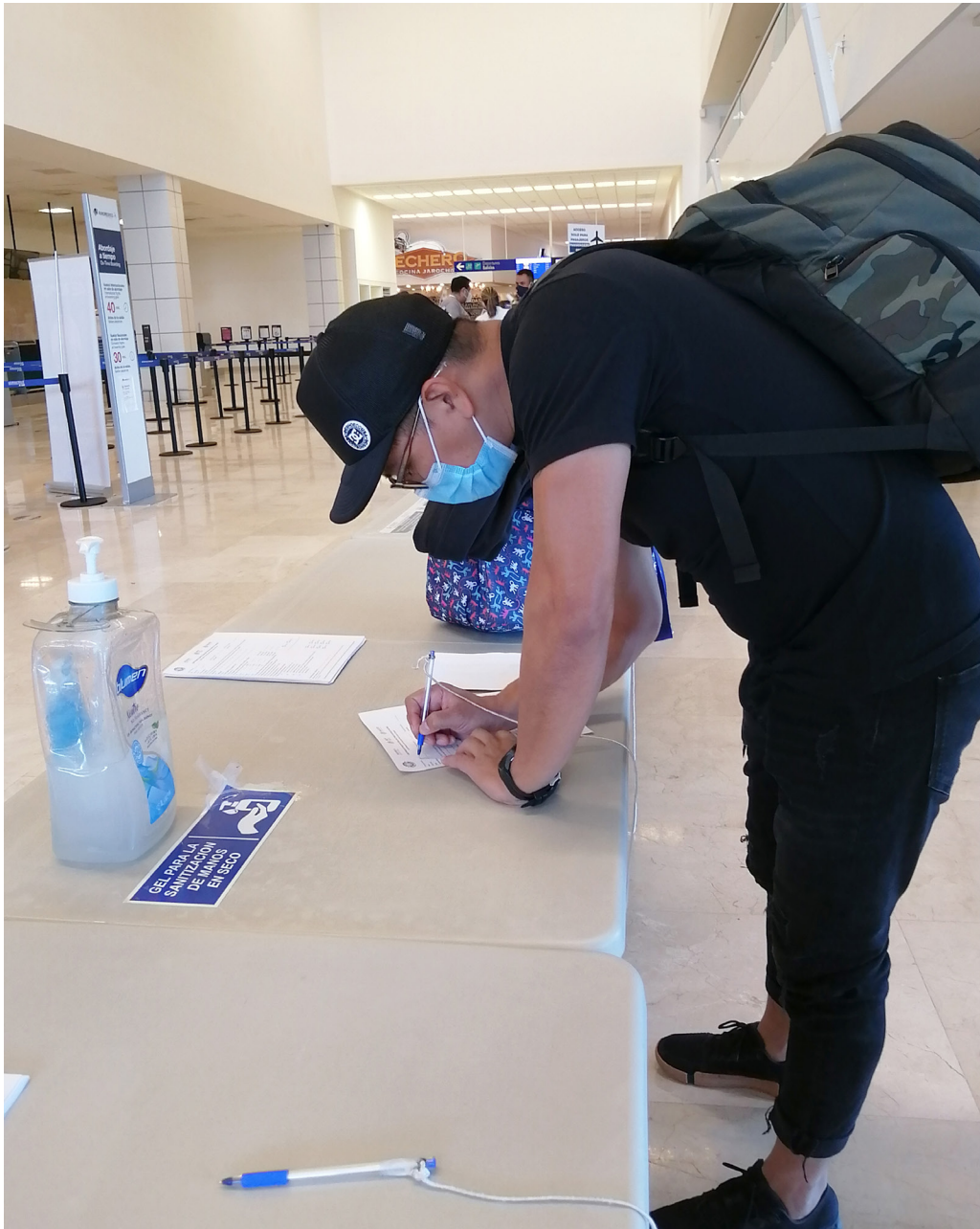
Figura 3. Área para llenar el cuestionario de identificación de factores de riesgo en viajeros (Veracruz, 2020).