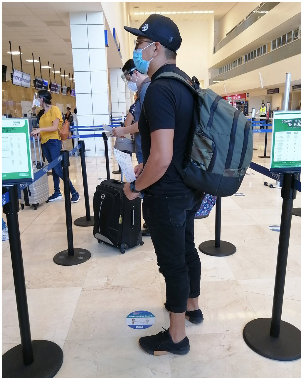
Figura 5. Fila para documentar (Veracruz, 2020).

En la fila para documentar, se observaron etiquetas de vinil adhesivo en el piso para mantener una sana distancia de 1.5 metros entre pasajeros. Seguidamente, en el mostrador de atención al pasajero, las aerolíneas dispusieron de paneles de acrílico de protección.