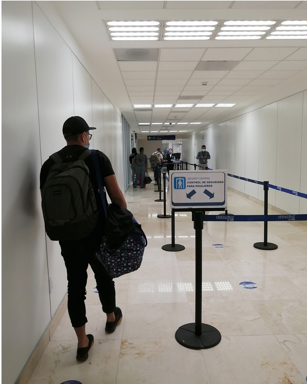
Figura 7. Fila de acceso al puesto de control de seguridad para pasajeros (Veracruz, 2020).

Posteriormente, se continuó el trayecto al punto de inspección de pasajeros y equipaje de mano, donde el personal de limpieza desinfectaba las bandejas de plástico una vez usadas. Seguidamente, se pasaba por el puesto de control de seguridad para pasajeros. En este, revisaban el pase de abordar y la credencial de elector. En la sala última de espera, los asientos a ocupar estaban señalados uno si y uno no, para mantener la distancia social. En todo momento del trayecto, se puso a disposición del viajero puntos de suministro de gel antibacterial.