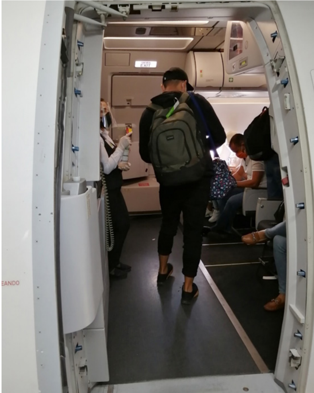
Figura 11. A la entrada del avión, el sobrecargo proporciona gel antibacterial y señala la ubicación del asiento (Veracruz, 2020).

Por último, durante el abordaje, la pasarela de acceso al avión contaba con señales en el piso para mantener una distancia de 1.5 metros entre los pasajeros. A la entrada del avión, el sobrecargo proporcionaba gel antibacterial al pasajero y señalaba la ubicación del asiento. Se observó, que tanto el personal del aeropuerto como el de la aerolínea hacen uso en todo momento de cubreboca, careta y guantes.