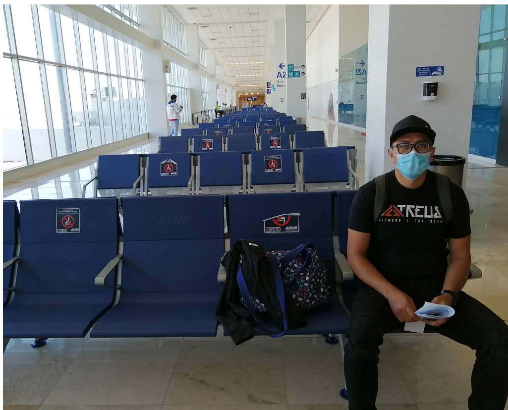
Figura 9. Sala última de espera para abordar (Veracruz, 2020).