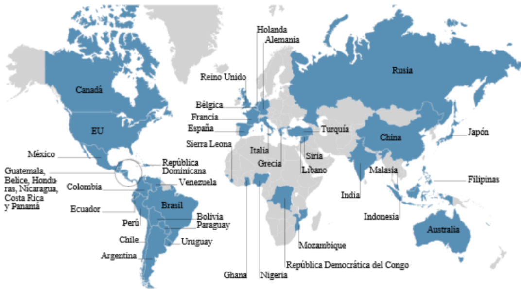
Figura 1. Países con presencia del Cártel de Sinaloa (54).

Como reveló el juicio del Chapo, el Cartel de Sinaloa es responsable de haber exportado ilegalmente 154 toneladas de cocaína, así como volúmenes aún superiores de otros estupefacientes, realizando operaciones estimadas en 14 mil millones de USD (Duclos, 2018). En 2016, esta organización funcionaba como una multinacional, con operaciones en 54 países a nivel mundial (Figura 1), a través de alianzas con otras organizaciones criminales, el usufructo de sus rutas, y la contratación de traficantes de armas conocidos como “facilitadores sombra”, con los que negociaba por intermedio de sus socios en las FARC (Gómora, 2016).