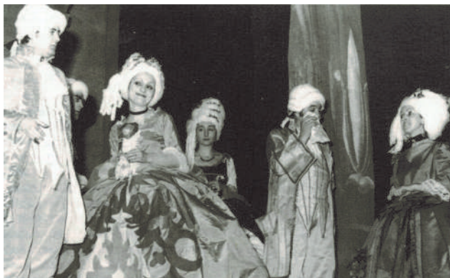
El Lebrél Blanco representando La Cenicienta.

to cassette, siendo las únicas incursiones en este terreno, realizadas por colectivos pamploneses.