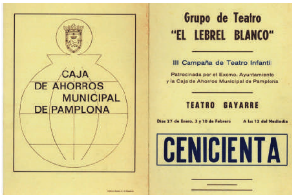
Folleto de la obra La Cenicienta .

Entre 1976 y 1979 organiza y desarrolla varias semanas de teatro y en las que intervienen una serie de grupos nacionales muy conocidos por el aficionado local pero escasamente vistos por estos lares. La primera semana se inaugura con una conferencia-coloquio de José Monleón. Al día siguiente se representa la obra Los palos de la compañía La Cuadra de Sevilla . Las funciones se ofrecen en el Pequeño teatro de la calle Amaya. Al año siguiente el espacio de las representaciones sufre un gran cambio, pasa a celebrarse en la Ciudadela. Los grupos actuantes fueron Akelarre de Bilbao, Retablo de Madrid, Teatro Municipal de Madrid, Els Joglars de Barcelona, Dagoll Dagom de Barcelona, Mediodía de Sevilla y cerrando esta segunda semana El Lebril Blanco. Según las crónicas periodísticas, en esta edición, asisten unos 18.000 espectadores repartidos entre las siete funciones programadas, lo que llena de satisfacción al equipo organizador del evento. En 1979, tras cerrar con éxito la IV Semana de Teatro en el marco de la Ciudadela en el mes de septiembre, el grupo monta otra Semana, siendo esta vez el escenario del teatro Gayarre quien acoja, en la segunda quincena de diciembre, las funciones teatrales, actuando los grupos Teatro do mundo de Lisboa, Denok de Vitoria, Mediodía de Sevilla y el propio Lebril Blanco los elegidos.