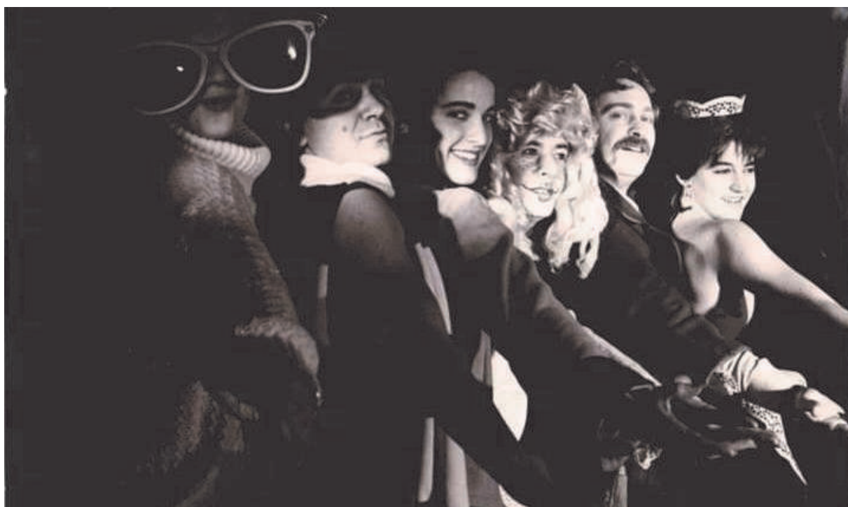
El grupo de teatro El Lebrél Blanco en una representación

La primera obra que el grupo estrena como producción propia es "1789" y que lleva un largo subtítulo La ciudad revolucionaria es de este mundo, basada en la revolución francesa, original del grupo parisino Theatre du soleil y lo hace en los primeros días de enero de 1976. Por este montaje, copia exacta de otra obra escenificada con anterioridad -al menos 1 año antes- por uno de los colectivos locales, El Lebrél Blanco recibe, por parte del diario El País, el premio como mejor espectáculo global del Estado en 1976. Además de este galardón es acreedor a diversos premios a escala nacional, entre ellos se puede destacar el logrado en el Festival de Sitges en 1979.