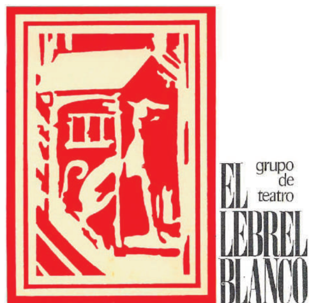
Logotipo del grupo.

El 23 de este mes de abril el grupo se desplaza a la capital de la Ribera para ofrecer a los niños tudelanos La Cautiva . La función se efectúa en el teatro Gaztambide. Tras La casita de chocolate (finales de abril) llega a las tablas del Gayarre las andanzas de El enano saltarín los días 27 y 28 de mayo. Con esta obra el grupo cierra la temporada 71-72 coincidiendo con la terminación de su primera campaña de teatro