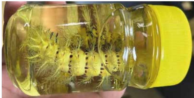
Figura 3. Cambio de color de larvas de Automeris dagmarae , preservadas en etanol al 70 %