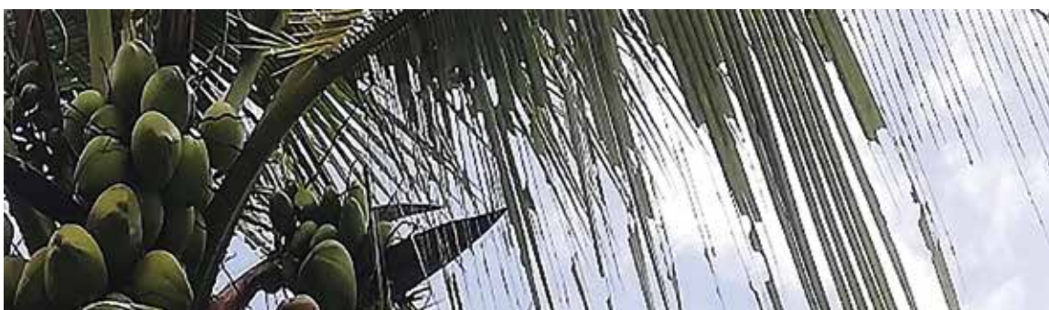
Figura 4. Palmeras de cocotero defoliadas por A. dagmarae en Aserri de Gariche

Si bien algunas personas utilizan como remedio tradicional ante el contacto con larvas urticantes los emplastos (abrir la larva y colocarse la hemolinfa sobre el área afectada) (21) , es preferible utilizar otras alternativas que sean médicamente recomendadas, como compresas frías, analgésicos orales o anestésicos de uso tópico (6) . Ahora bien, estos tratamientos sólo se limitan a aliviar los síntomas; sin embargo, hace falta mayor investigación sobre los mecanismos de acción de los venenos, así como el desarrollar posibles antídotos (sólo se cuenta con antídoto para especies del género Lonomia ) (22) .