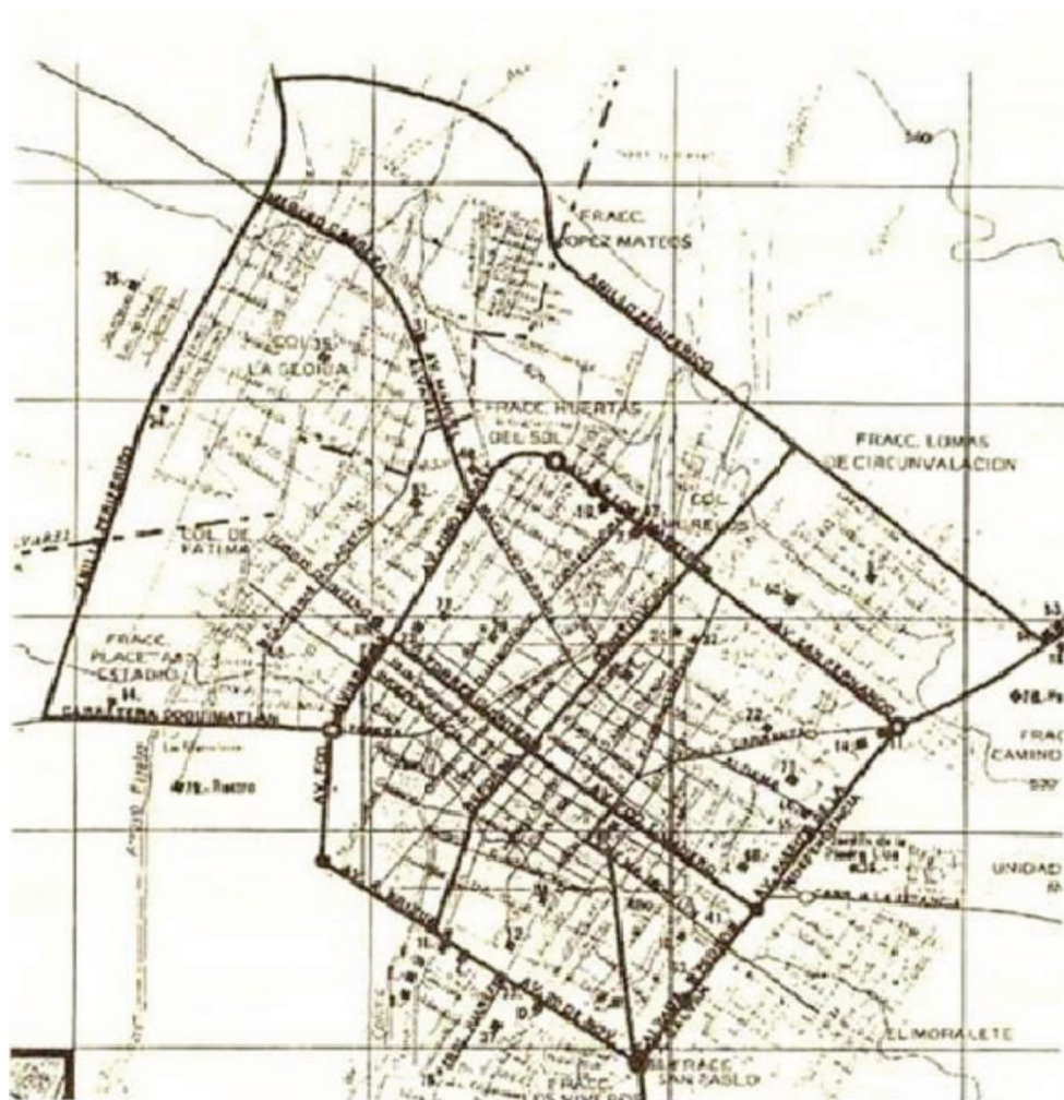
Mapa 2. Ciudad de Colima a finales de los años de 1970