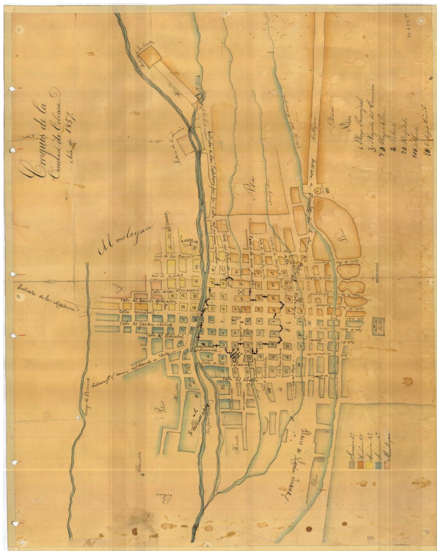
Mapa 1. Ciudad de Colima en 1857