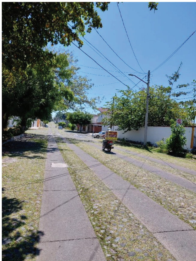
Figura 1. Pavimento con huella de rodamiento