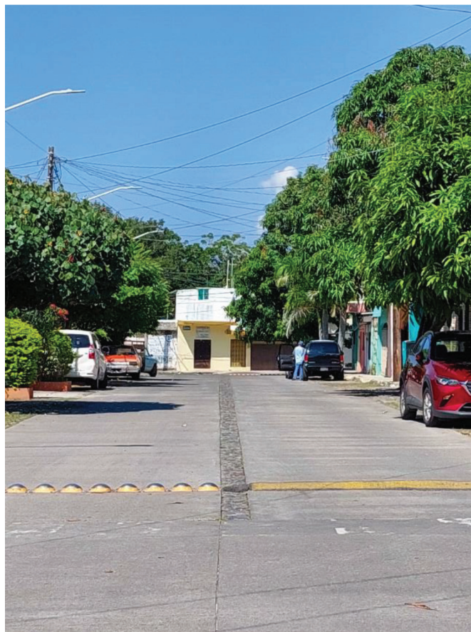
Figura 2. Recubrimiento de concreto hidráulico

o una vez autorizado; precisamente, el Reglamento de Desarrollo Urbano y Seguridad Estructural ya aludía a la seguridad de la población ante la incidencia de fenómenos naturales o artificiales, entre ellos los huracanes y las inundaciones, y ya establecía separar el drenaje sanitario del pluvial.