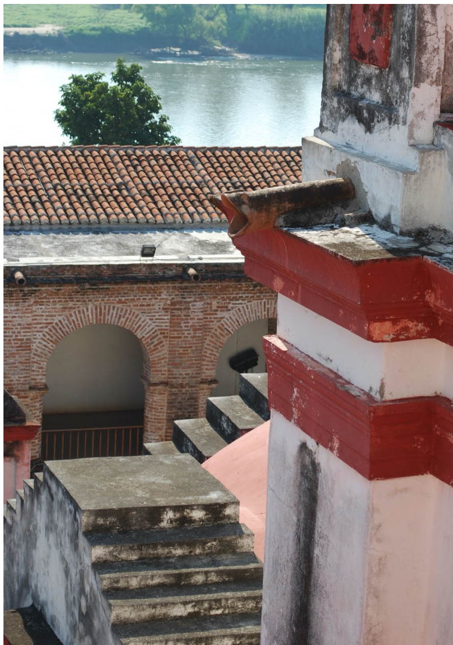
Figura 1. Gárgola con forma de Serpiente que se conserva en la torre el campanario de la iglesia de Chiapa de Corzo.