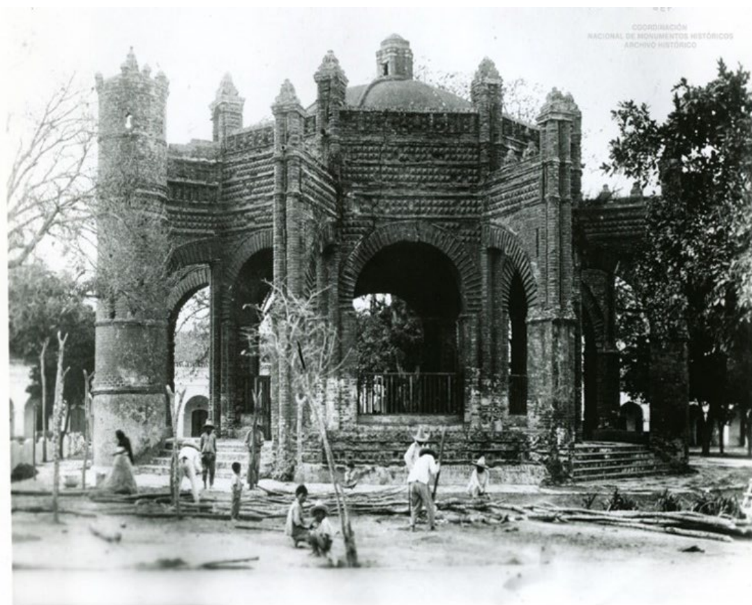
Figura 2. Foto de la pila de Chiapa de Corzo donde se muestran las gárgolas con cabeza de serpientes. Primera década del siglo XX.