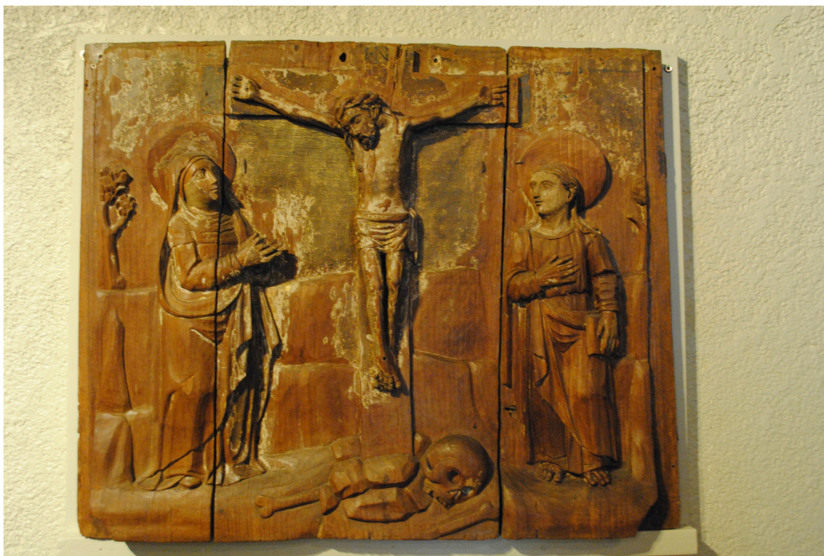
Figura 3. Fragmento de madera labrada que muestra la escena del Calvario de Cristo. Se piensa que perteneció al retablo de la iglesia del Calvario de Chiapa de Corzo. Museo Regional de Antropología, Tuxtla Gutiérrez, Chis.