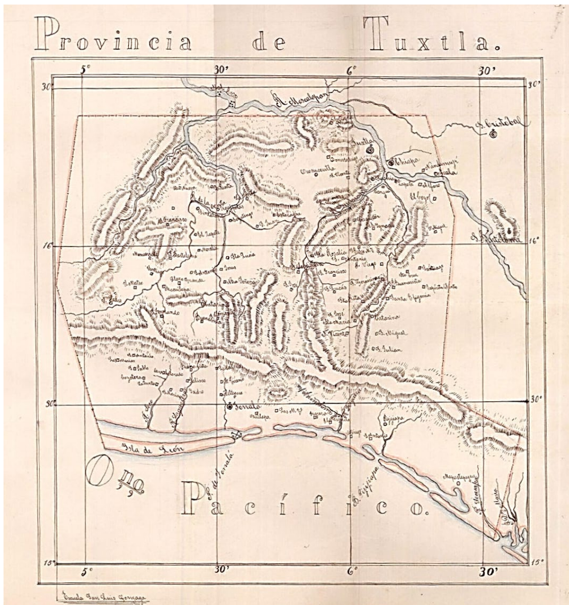
Mapa 1: área chiapaneca y zoque