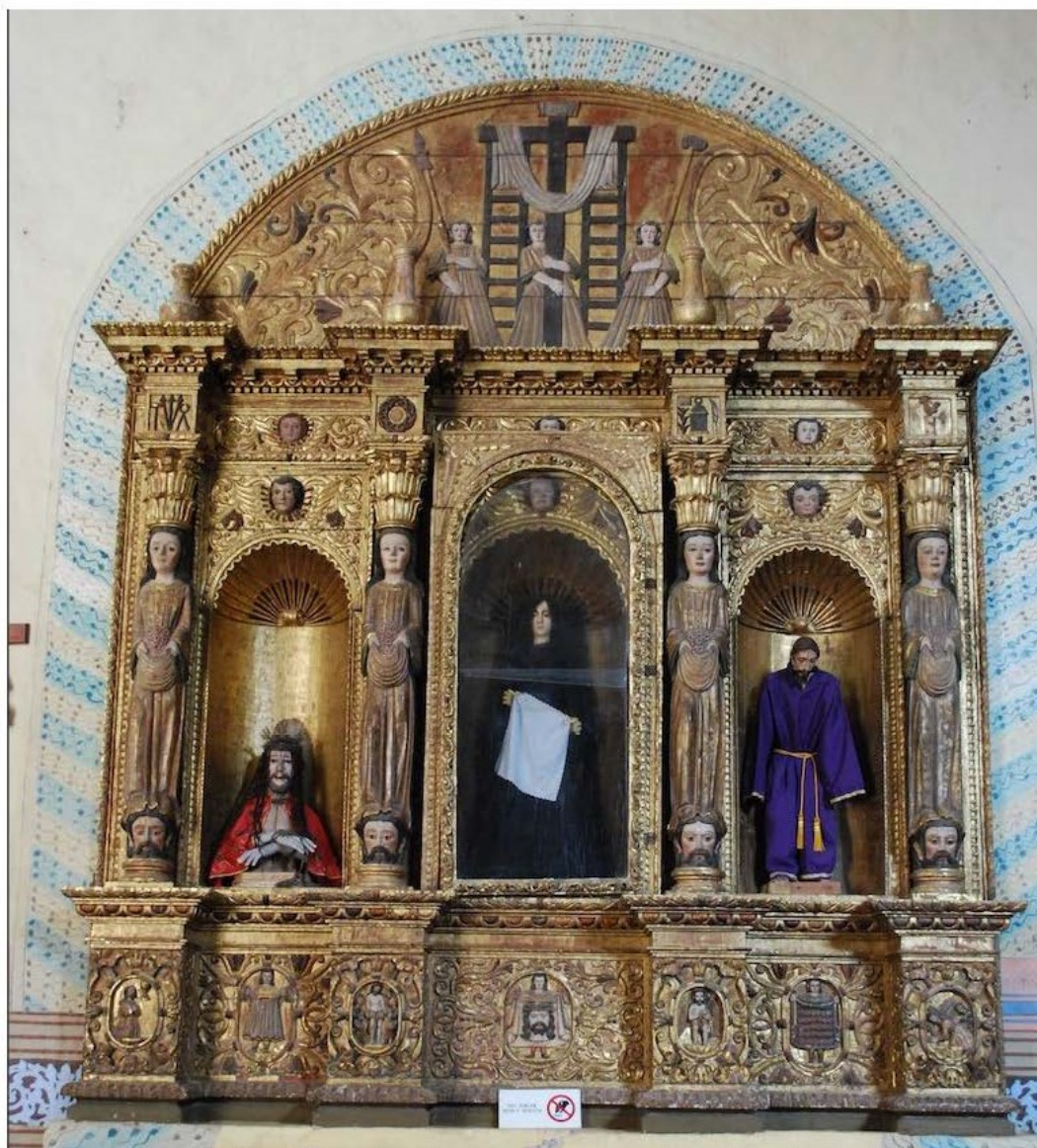
Figura 3. Retablo de Nuestra Señora de la Soledad. San Miguel Arcángel, Maní, Yucatán. Primera mitad del siglo XVII.