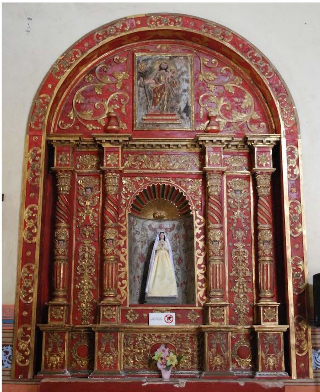
Figura 6. Retablo de la Purísima Concepción. San Miguel Arcángel, Maní, Yucatán. Finales del siglo XVIII. Fotografía del autor/a, 2017.