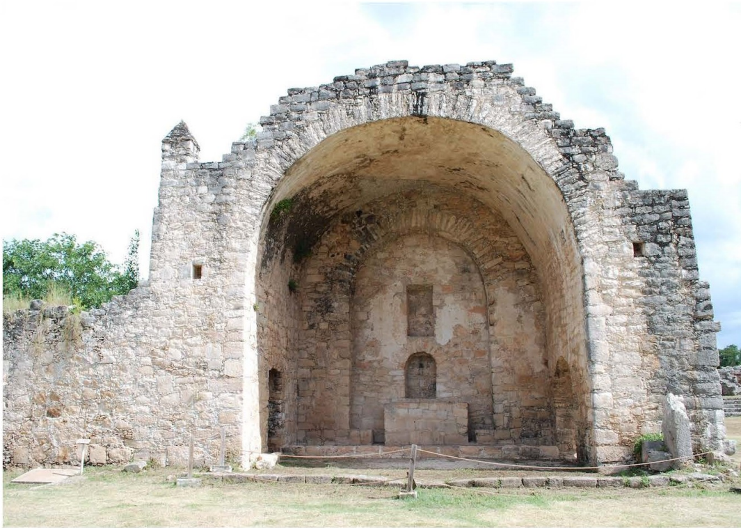
Figura 1. Capilla. Museo del Pueblo Maya de Dzibilchaltún, INAH.