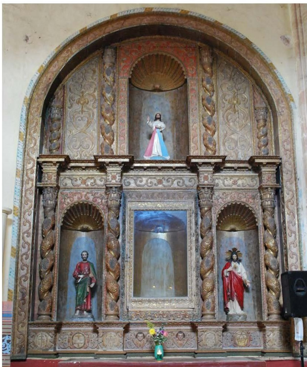
Figura 4. Retablo de Nuestra Señora del Lunar. San Miguel Arcángel, Maní, Yucatán. Finales del siglo XVII. Fotografía del autor/a, 2017.