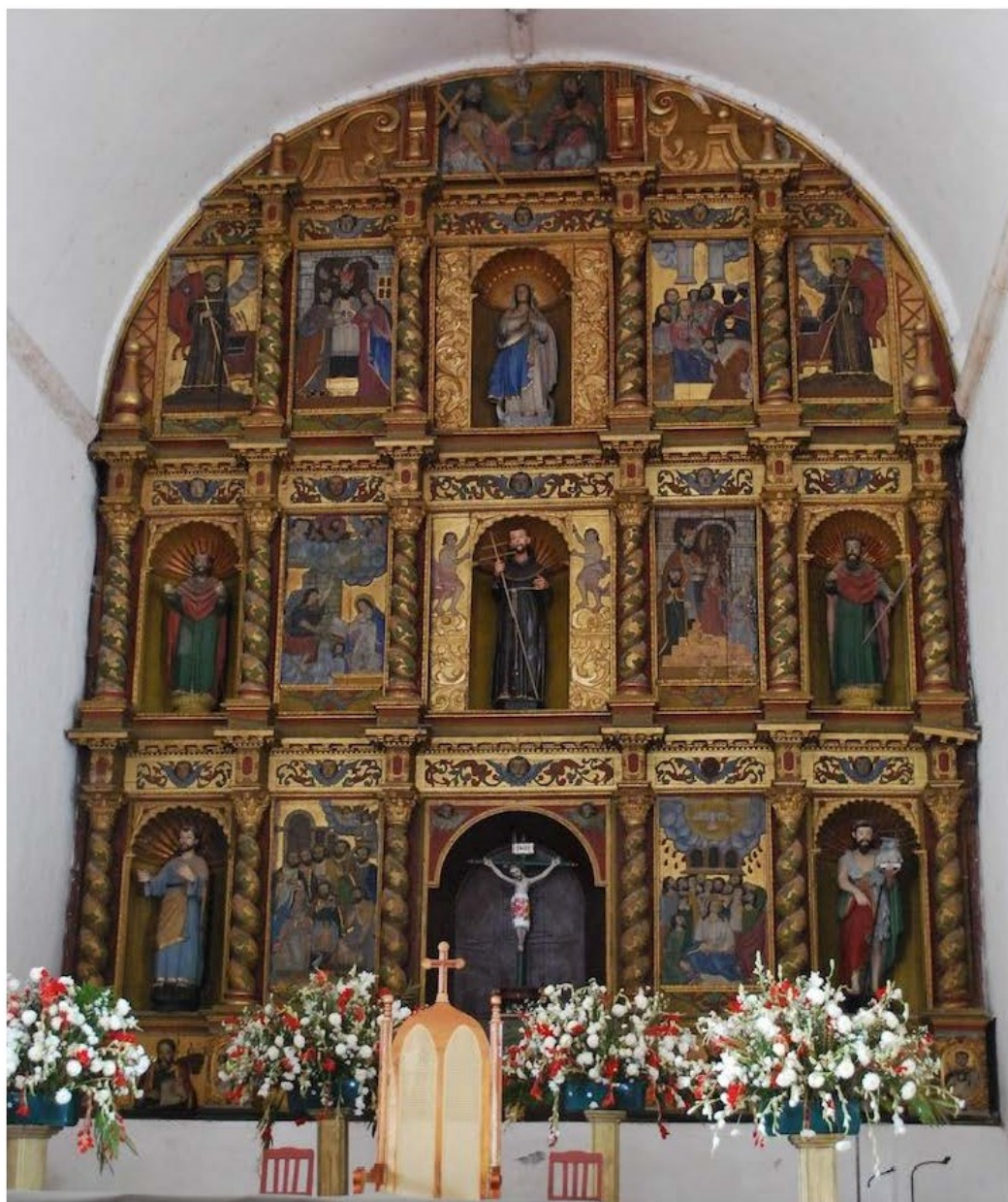
Figura 5. Retablo mayor. San Francisco de Asís, Oxkutzcab, Yucatán. Primer tercio del siglo XVIII.