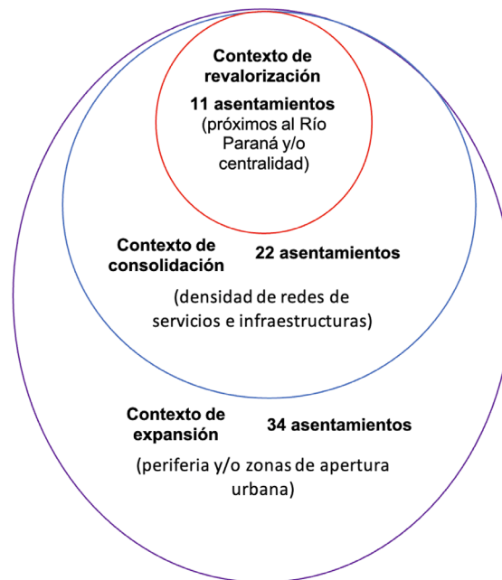
Figura 3. Asentamientos según contexto urbano.

En síntesis, a pesar de la pobreza y la precariedad en las condiciones de vida, los residentes de estos asentamientos han sabido aprovechar las ventajas y externalidad del entorno, lo cual evidencia la importancia de la articulación de la vida local con los procesos socio-urbanos adyacentes.