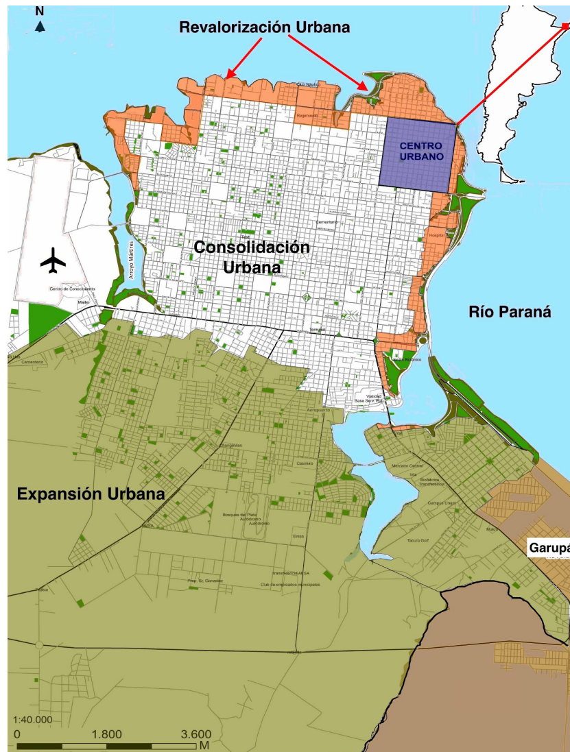
Figura 1. Mapa de Posadas y áreas urbanas estudiadas.

independientemente de la segregación, se ven expuestos a alguna forma de articulación con procesos socio-urbanos.