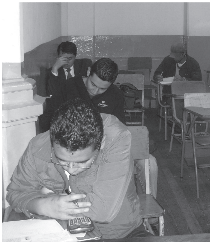
Foto 4. Salón de clases ET-ITC

La evaluación de la credibilidad de una fuente se hace fundamental, en nuestra época, en donde es tan frecuente que el estudiante, al ser colocado en la posición de consulta, acude casi ineludiblemente a Internet, encontrando a su disposición multitud de información, que en la mayoría de los casos, se asume verdadera, sin que se increpe sobre su veracidad, su origen o la verdadera capacidad del escritor. En este sentido dentro del proyecto se consideran criterios de: experiencia del autor, reputación del mismo dentro de una comunidad, ausencia o presencia de posibles conflictos de in-