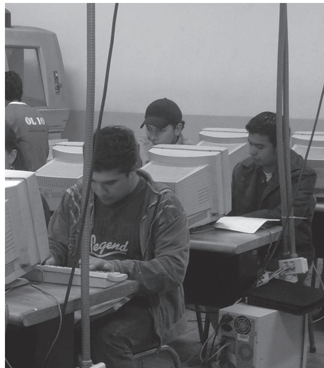
Foto 6. Talleres ET- ITC