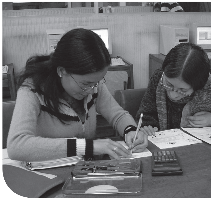
Foto 3. Estudiantes ET-ITC