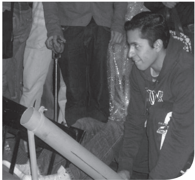
Foto 1. Concurso lanzamiento huevos. Semana cultural II semestre 2008

Sin pretender ser recurrente y repetitivo, respecto a aquellos discursos en donde se nos presenta una propuesta como “contraria a la educación tradicional, bancaria, memorística, transmisionista, etc.” Muy común en todo este tipo de documentos, debemos decir que el pensamiento crítico, comienza a constituirse en una propuesta interesante en los diferentes países de Latinoamérica, como por ejemplo México y Costa Rica, en donde se han desarrollado propuestas en tal sentido, sin excluir que en Colombia hay algunos grupos preocupados y estudiosos del tema.