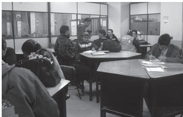
Foto 7. Estudiantes ET- ITC

se aplican dentro del contexto de la enseñanza de la Física, pensándola como generadora de pensamiento crítico, dándole importancia a la parte conceptual de la misma, que requiere, como cualquier otro texto, de interpretación, análisis y aplicación en la resolución de problemas. Solo nos queda entonces, a pesar del cambio que esto implica, ponerlo en práctica y esperar que los resultados sean los ideales y en algún segundo artículo presentar resultados sobre el pensamiento crítico de nuestros estudiantes.