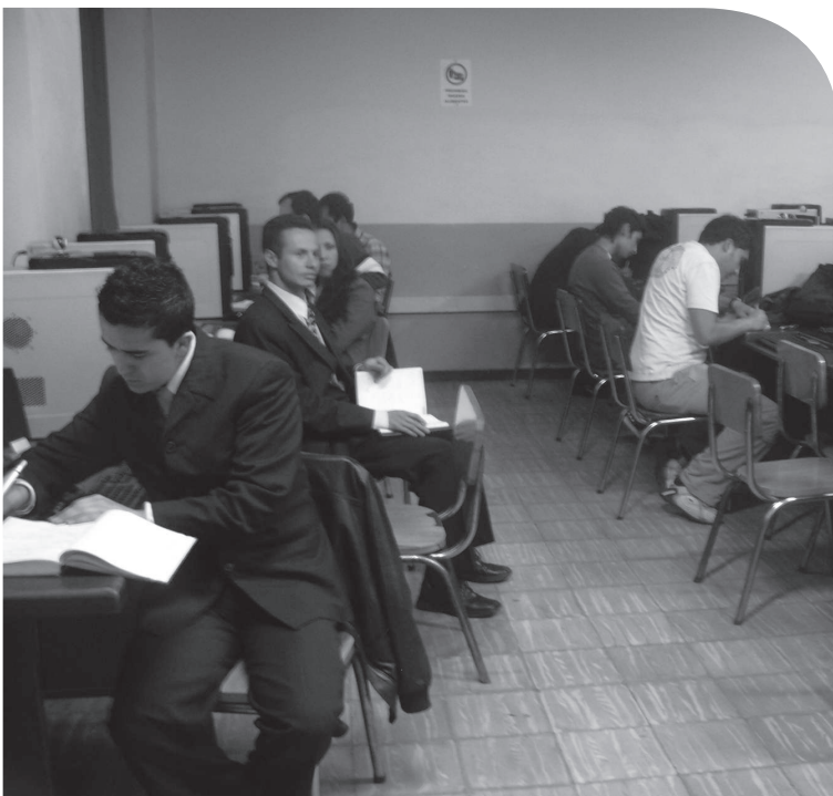
Foto 5. Estudiantes en prácticas en sala de sistemas ET-ITC

El proyecto se desarrollará con una metodología mixta: cualitativa – cuantitativa, con un diseño de series cronológicas, con 30 estudiantes del