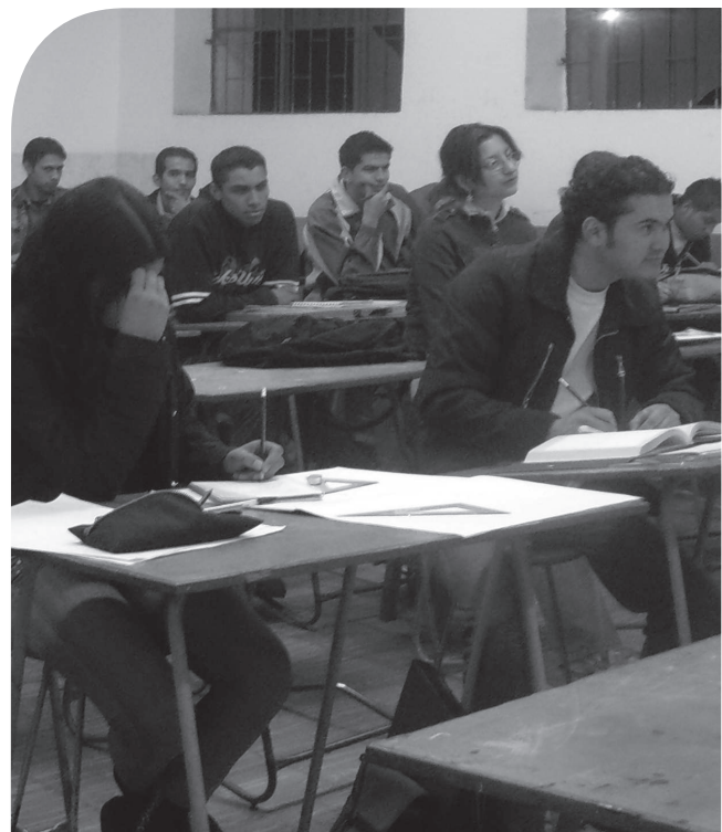
Foto 2. Estudiantes en sala de dibujo. ET-ITC.

Aun cuando no hay una definición unánime y unívoca de los que se denomina “ pensamiento crítico ”, comienza a verse en la literatura cierta unidad de terminologías en cuanto a las características esperadas en los sujetos con dicha forma de pensamiento, lo que facilita el ir agrupándolos, y a la vez ir identificando grupos de trabajo que claramente elaboran teorías firmes sobre el tema. Iniciaremos nuestra indagación sobre el tema citando algunos autores que se consideran importantes en la construcción de la definición de pensamiento crítico.