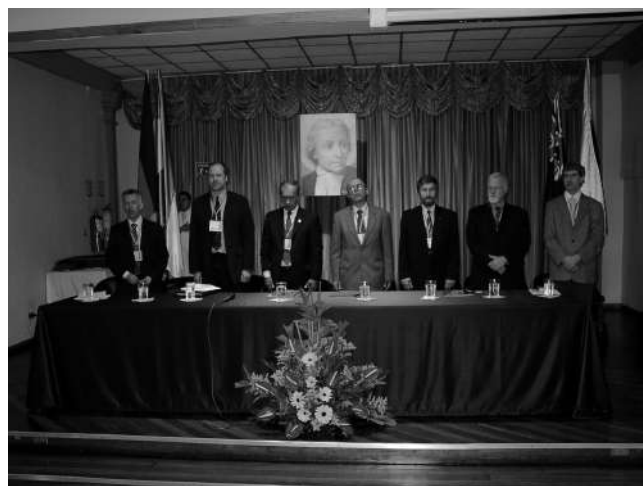
Foto 2. Inauguración I Congreso ETTI.

Este primer encuentro abarcó temas como: el sistema de educación y formación en Alemania, el sistema Australiano de educación Técnica y tecnológica, experiencias en educación técnica