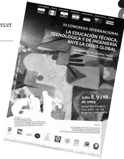
Foto 5. Poster promocional del tercer congreso que organizará ET ITC

anteriores, la Escuela Tecnológica ITC ahora en asocio con la Facultad Tecnológica de Universidad Distrital FJC, el Instituto Tecnológico de Soledad Atlántico –ITSA- y el Instituto Tolimense de Formación Técnica Profesional –ITFIP- del Espinal (Tolima), han proyectado el III Congreso Internacional denominado “ La Educación Técnica, Tecnológica y de Ingeniería Ante La Crisis Global -Incidencia en los Ámbitos Social, Económico, Ambiental y Educativo- ”, el cual se realizará en Bogotá los días 8, 9 y 10 de julio de 2009.