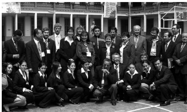
Foto 3. Participantes I Congreso de Educación ETTI