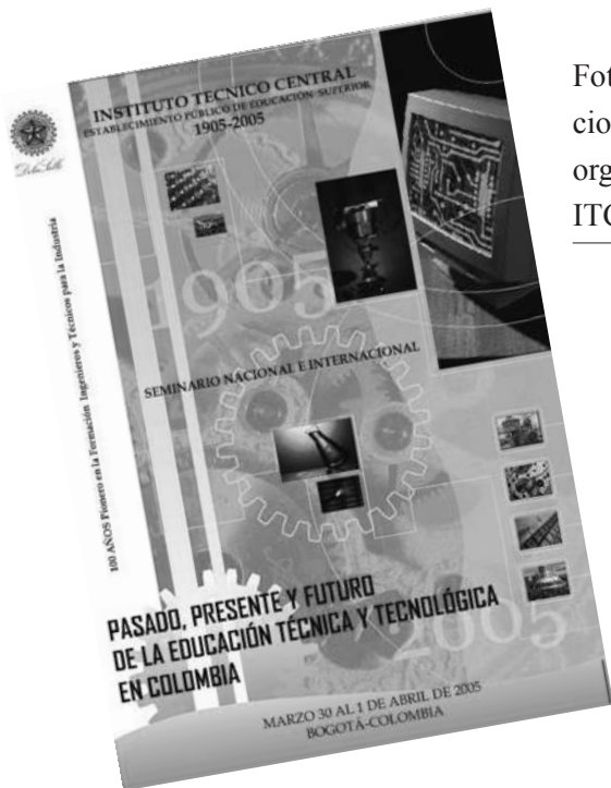
Foto 1. Poster promocional primer congreso organizado por la ET ITC