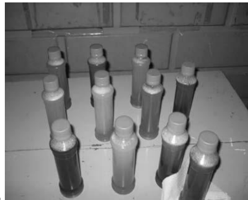
Foto 3. Primera muestra ecoempresarial ETITC, 2011. Jabón de manos para mecánicos elaborado por los estudiantes de Impacto Ambiental.

En una práctica de laboratorio, los estudiantes aprendieron a hacer jabones ecológicos, y confites a partir de cáscaras de naranja y maracuyá (foto 3).