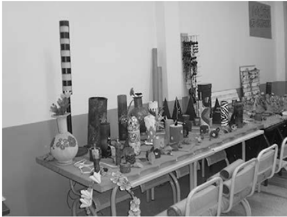
Foto 1. Exposición de productos elaborados en la cátedra Impacto Ambiental

Posteriormente, se invitó a estudiantes de otras asignaturas a participar, con la premisa de que los conceptos teóricos adquiridos en el aula de clase pudieran ser representados en prototipos que incitaran a investigar en torno a esas temáticas. Otros grupos de estudiantes, liderados por docentes de otras áreas y que involucraban en sus procesos académicos una dinámica ambientalista, se unieron a la idea de adelantar proyectos de aula que permitieran socializar sus propuestas. Se creó entonces la necesidad de generar un espacio donde se difundiera en la comunidad académica la importancia de cuidar el planeta y, por otro lado, despertar el espíritu empresarial. Así nace, en el año 2011, la primera muestra ecoempresarial de manera formal.