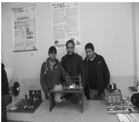
Foto 8. Prototipos elaborados por estudiantes de la cátedra Generación de Energía, del programa de Ingeniería Electromecánica

(Hidráulica, 2014), turbina Francis (página principal de la turbina Francis, 2014), turbina de hélice (Pyadira, 2013), energía mareomotriz (Twenegy, 2012) y energía solar fotovoltaica (Greenenergy Latinamerica, 2011). En la foto 8 se observa uno de los prototipos exhibidos.