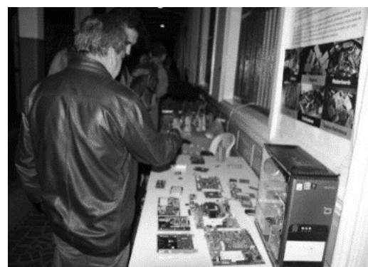
Fotos 11 Empresarios y visitantes en la V Muestra Ecoempresarial.

Por otra parte, los estudiantes del Bachillerato Técnico Industrial, en cabeza de su docente de Ciencias naturales, expusieron pósters sobre los residuos generados en la localidad de los Mártires; una muestra se observa en la foto 12.