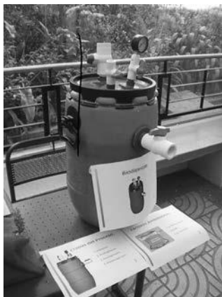
Foto 5. Biodigestor anaeróbico

Acudieron para realizar una exposición de prototipos móviles y pósters sobre la generación de energía eléctrica a partir de fuentes renovables. La exposición de prototipos móviles, alusivos a diferentes conceptos usados en la termodinámica, permitió explicar las leyes de la electricidad, con el empleo de elementos de computadores en desuso, fotocopiadoras y otros equipos electrónicos y eléctricos; otros prototipos, como el biodigestor anaeróbico, sirvieron para explicar la producción de metano, según se observa en la foto 5, así como otros prototipos, como secadores de frutas y hortalizas, calentadores de agua y cocinas solares. Toda una variada muestra, con el objeto de incentivar el espíritu empresarial y ecológico.