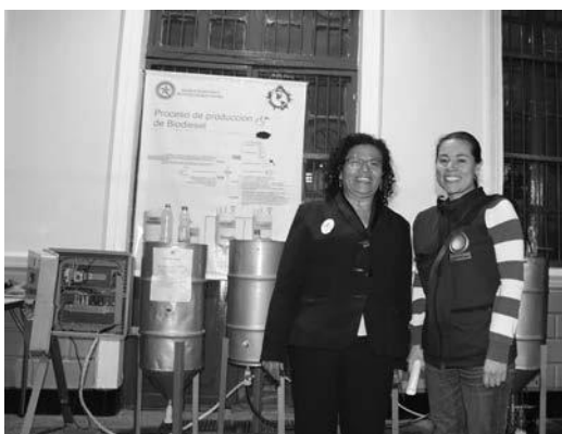
Foto 9. La Directora del grupo GEA y la funcionaria de la Secretaría de Medio Ambiente en la V Muestra Ecoempresarial.

Las fotos 10 y 11 dan cuenta de los empresarios y visitantes a la V Muestra Ecoempresarial.