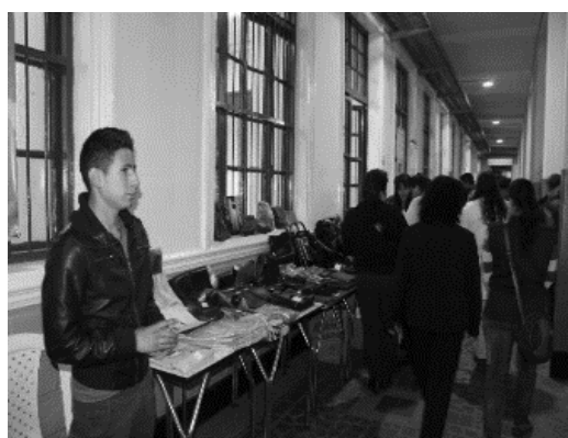
Foto 10. Empresarios y visitantes en la V Muestra Ecoempresarial.

Las fotos 10 y 11 dan cuenta de los empresarios y visitantes a la V Muestra Ecoempresarial.