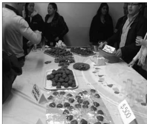
Foto 7. Estudiantes de Ingeniería de Procesos Industriales, exponiendo sus productos fabricados con base en la quinua.

Los productos fueron exhibidos y vendidos en la III muestra ecoempresarial de ese mismo año. (foto 7)