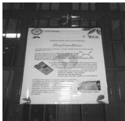
Foto 12. Muestra de exposición de pósters alusivos a los residuos sólidos, líquidos y gaseosos comerciales e industriales, generados en la localidad Los Mártires.

Por otra parte, los estudiantes del Bachillerato Técnico Industrial, en cabeza de su docente de Ciencias naturales, expusieron pósters sobre los residuos generados en la localidad de los Mártires; una muestra se observa en la foto 12.