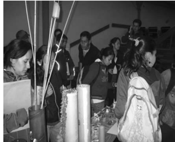
Foto 2. Primera muestra ecoempresarial ETITC, 2011. Artículos elaborados por estudiantes de la cátedra Impacto Ambiental a partir de tubos de cartón, papel periódico, cáscaras de huevo y medias veladas.

Esta primera muestra contó con una propuesta de los estudiantes de la asignatura Impacto Ambiental. En este caso, los estudiantes propusieron un valor agregado a materiales en desuso: tubos de cartón, para elaborar inciensarios, floreros, portalápices, alcancías; papel periódico, para hacer canastillas y floreros; cáscaras de huevo enteras, para hacer muñecos, y en pedazos, para decorar; medias veladas, para hacer flores y mariposas, entre otros (foto 2).