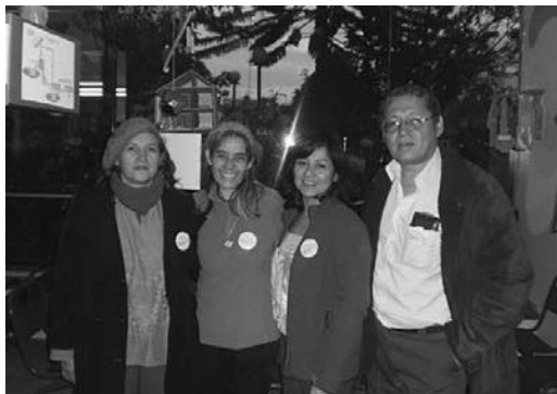
Foto 4. Grupo GEA, organizador de las Jornadas de la Tierra y de las muestras ecoempresariales.

Física Eléctrica, Generación de Energía y Termodinámica, coordinados por el grupo GEA, como se observa en la foto 4,