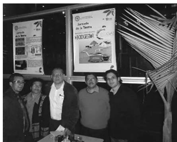
Foto 13. Exposición de pósters y prototipos de producción de energía a partir de biomasa, elaborados por los estudiantes de la cátedra de Generación de Energía.

Los estudiantes de la cátedra de Generación de Energía también expusieron pósters sobre la producción de energía a partir de biomasa, como se observa en la foto 13.