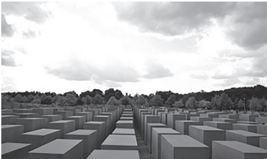
Figura 6. Peter Eisenman y Buro Happold, Memorial del Holocausto en Berlín , 2005 Alemania.

dispositivos de activación de diversas memorias y no como su reemplazo por un único relato. 53