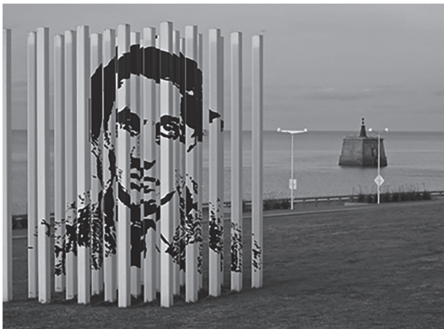
Figura 4. Parque de la Memoria, Buenos Aires, Argentina.

Fuente: “30.000. Nicolás Guagnini”, Parque de la Memoria . https://parquedelamemoria.org.ar/30-000/ . Nicolás Guagnini, 30.000 , 25 columnas de acero de 4 x 0,12 m, 1999-2009. La escultura reproduce el retrato del padre del artista Nicolás Guagnini que desapareció durante la dictadura. Mediante un efecto óptico, el retrato aparece y desaparece de acuerdo con el punto de vista donde se encuentre el espectador.