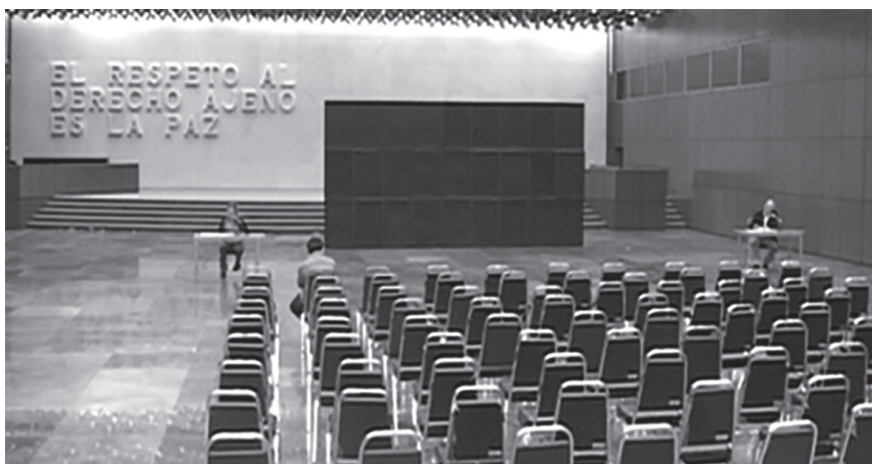
Figura 8. Santiago Sierra, 1549 crímenes de Estado , 2007. Ciudad de México