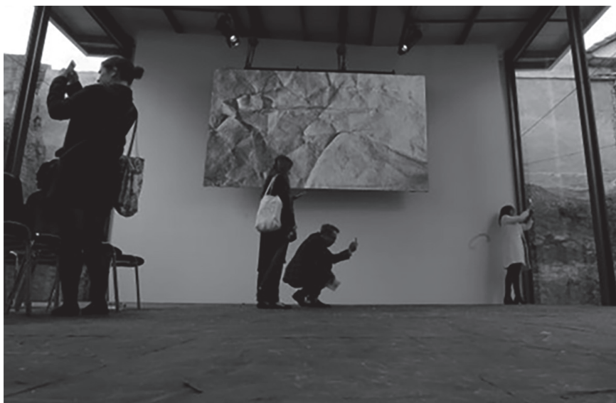
Figura 5. Vista interior de “Fragmentos. Espacio de Arte y Memoria”. Museo Nacional de Colombia.