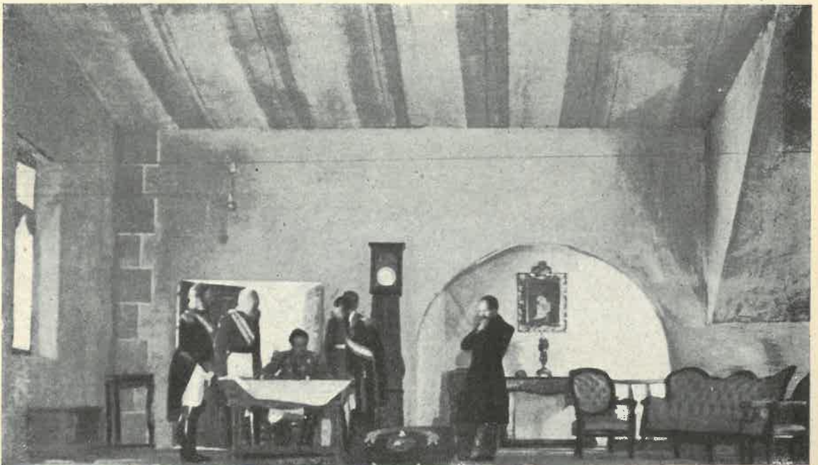
Dos escenas de «Baile en Capitanía» de Agustín de Foxá representado por el granadino Teatro Lope de Vega, de Granada