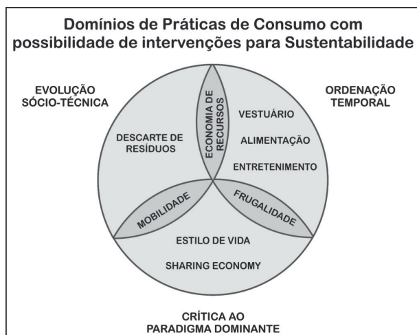
Figura 2 Framework de Domínios de Consumo para Lentes das Práticas