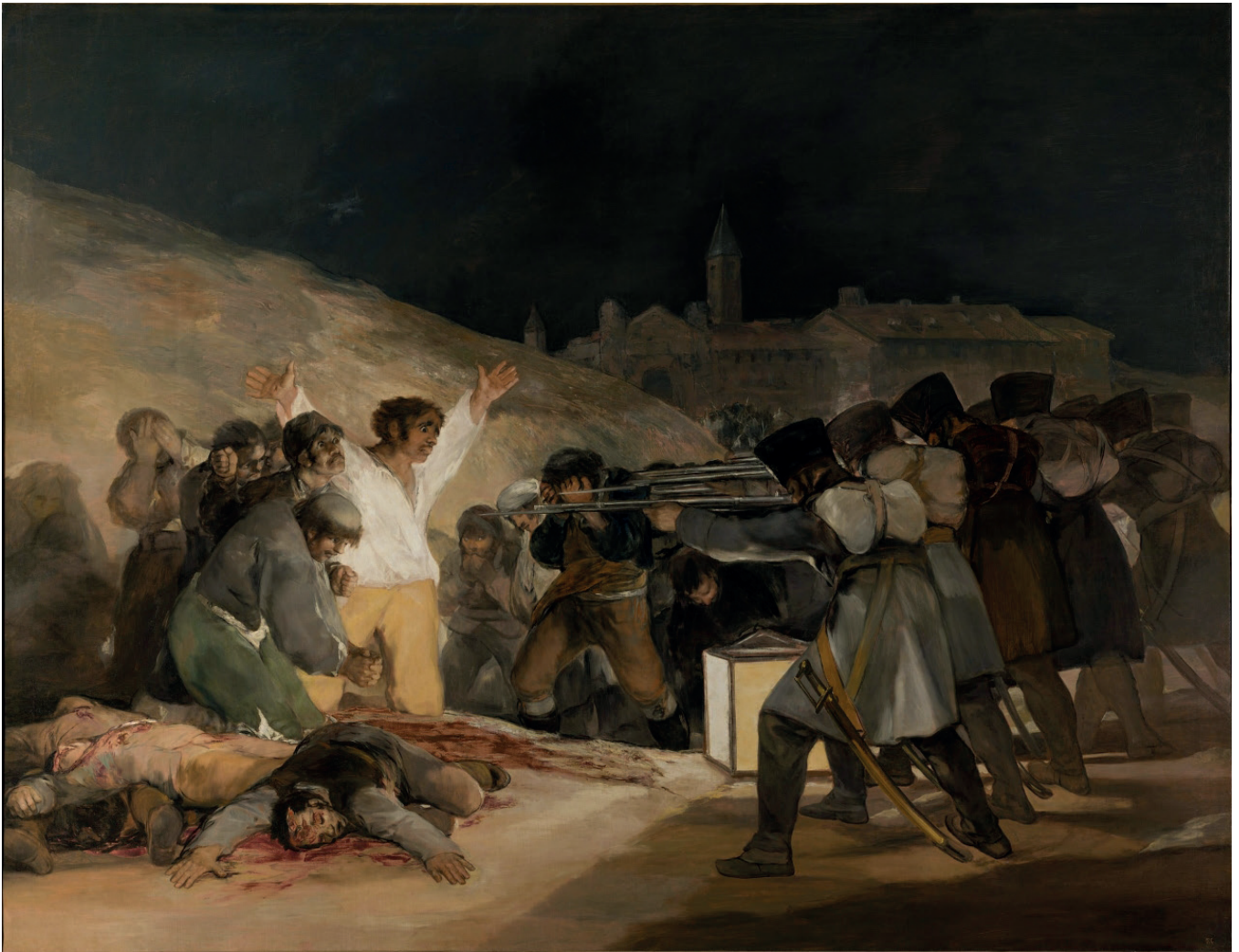
Figura 7. Francisco de Goya. Los fusilamientos en el Monte del Príncipe Pío

nada fruta, como homenaje a la obra de Erik Satie. Para Valero “ la conexión entre pintura y música se produce de una manera subjetiva y está causada por la impresión que causa el cuadro en el espectador ”. 4