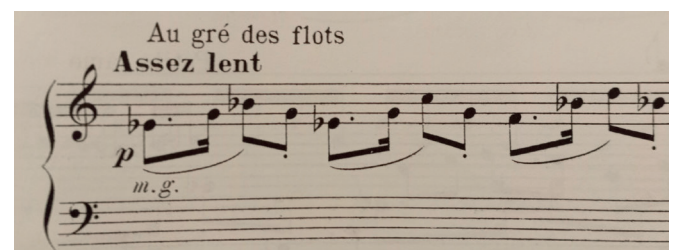
Figura 1. Erik Satie. Sur un voiseau. Au gré des flots (Sobre las olas)

Erik Satie, músico francés autor de las Gymnopédies , envidiaba a los artistas plásticos porque ellos terminaban de pintar y allí estaba la obra de arte para la eternidad; en cambio el compositor finalizaba una partitura que para transformarse en música debía esperar a ser interpretada. Satie fue un innovador genial, en sus obras musicales colocó indicaciones muy precisas, pero de una manera absolutamente original, sugiriendo estados de ánimo del intérprete, expresiones inauditas hasta entonces. Además, tenía un sentido del humor muy peculiar y era bastante irónico.