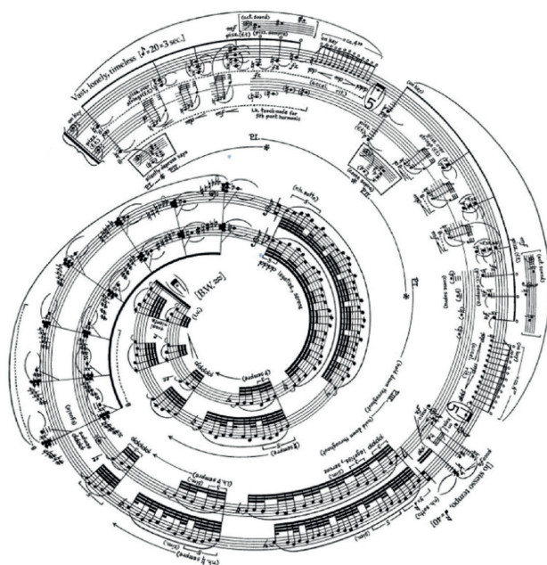
Figura 6. George Crumb. Spiral Galaxy .