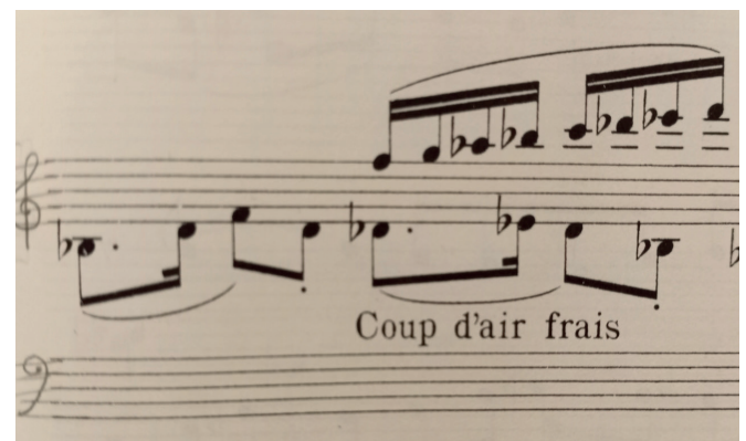
Figura 2. Erik Satie. Sur un voiseau. Coup d'air frais (Ráfaga de aire)