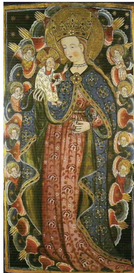
Ilustraciones 2 y 3. Imagen titular del y después de su restauración. Retablo de Nuestra Señora de los Ángeles en Cubel.