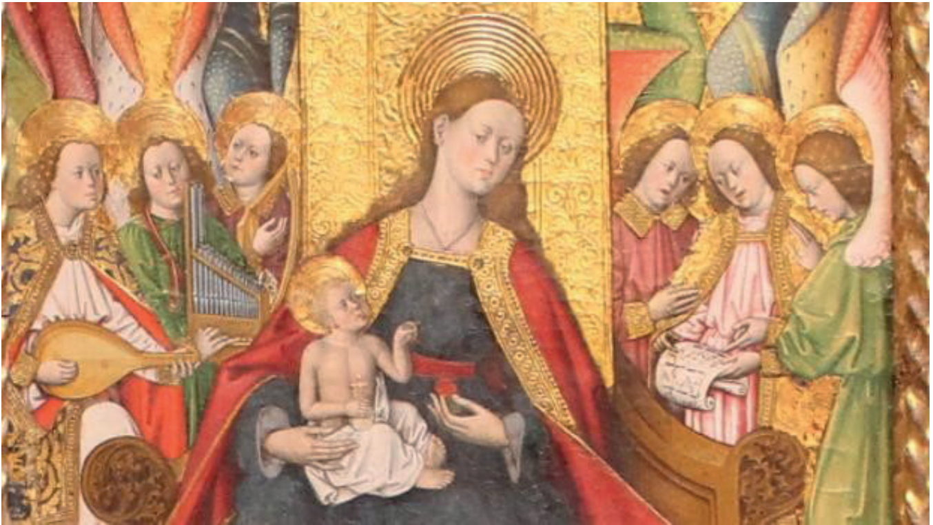
Ilustración 1. Detalle de la tabla central del retablo de la Virgen de la Corona de Erla.

en un deplorable estado de conservación. Estaba temporalmente recogida en casa del cura ecónomo de la ermita, quien, con muy buen criterio, había decidido sacarlo de su primitivo emplazamiento a la espera de que se pudiera proceder a su restauración (VV.AA., 1987). El mal estado de la pintura estaba justificado al haber permanecido durante mucho tiempo sin cubierta la ermita de donde procede, la de la Virgen de la Corona (VV.AA., 1998).