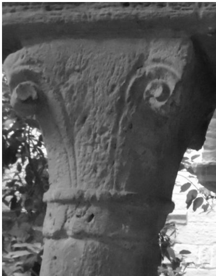
Fig.4 – Capitel da galeria leste, século XI: ascendência coríntia, sem folhagem.

pelo autor catalão nunca tenha existido, mas ele afirma sua existência para poder classificar os capitéis como coríntios. Dessa maneira, para nós, o capitel teria sido esculpido da maneira como se apresenta, apenas com as volutas nos ângulos, o que não configura um erro do escultor nem uma defasagem gerada pelo tempo.