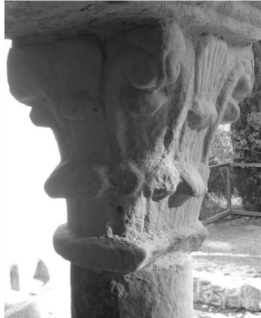
Fig.3 – Capitel externo da janela norte da sala capitular, século XI, “cópia”, em ângulos diferentes.

Segundo Sitjes i Molins (1973: 57), dois outros capitéis – localizados ainda na galeria leste (Fig.4) – teriam também ascendência coríntia, mas a folhagem, elemento fundamental do capitel coríntio tradicional, teria desaparecido, tendo apenas restado os caulículos que terminam em volutas angulares. Uma observação atenta desses capitéis não parece nos indicar que haveria mais elementos esculpidos – folhas de acanto, sobretudo, como nos outros capitéis. Acreditamos que essa folhagem citada