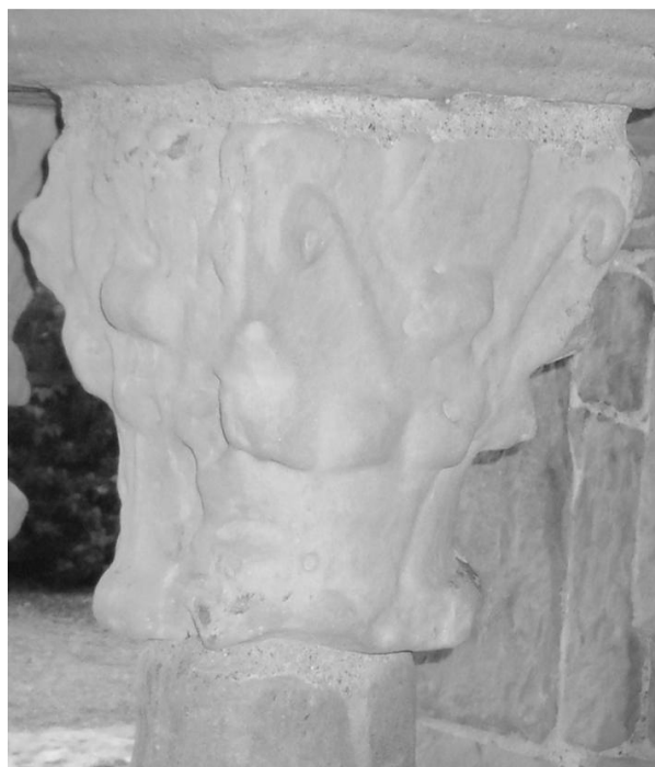
Fig.5 – Capitel interno da janela norte da sala capítular, século XI, “cópia”.

se eles seriam apenas uma tentativa de cópia ou se as variações e detalhes diferentes não seriam uma característica valorizada – e, inclusive, buscada – na confecção de tais capitéis.