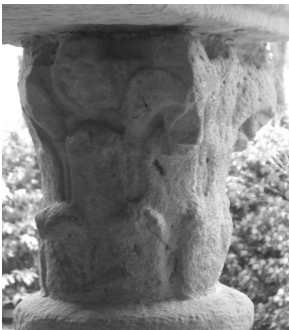
Fig. 2 – Capitel externo da janela sul da sala capitular, século X.

influências longínquas. Eles são obra de um artista cordobês. (Gaillard, 1938:33) 6