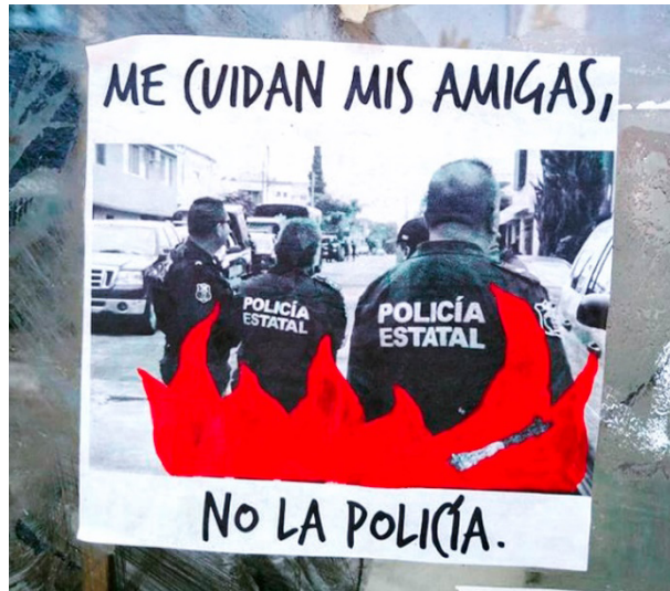
Fig. 2 San Luis Potosí. Paste up realizado con una fotocopia. San Luis Potosí. Año 2020.

La estructura de los paste up hace visible la postura ideológica de Gráfica X Morritas, la cual se asocia con el feminismo al exponer gráficamente una conciencia social acerca de las condiciones en las que se encuentra la población femenina de la ciudad. La postura de la agrupación revela una politización de sus actividades que escapa de la programación patriarcal, al comprenderse como sujetos sociales involucradas en la desarticulación de los sistemas androcéntricos. Por ejemplo, se han organizado para mostrar las contradicciones que representan las instituciones de seguridad pública, las cuales abusan del poder con fines delictivos, por lo que se observan frases como La policía no nos cuida, viola, acosa y asesina .