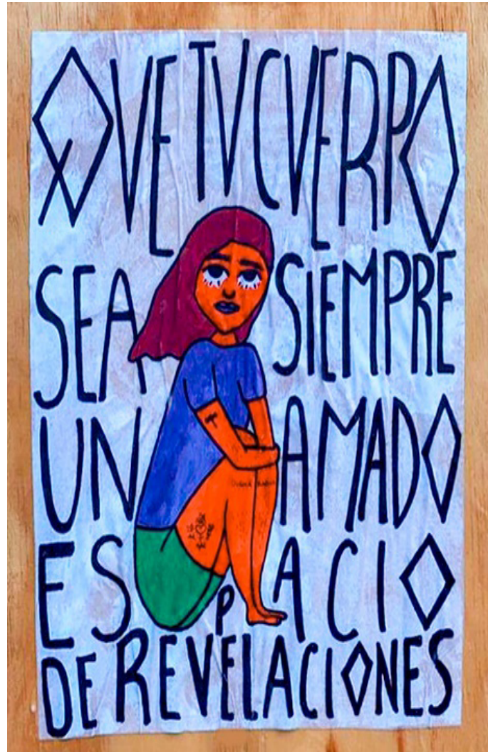
Fig. 7. Paste up sobre el amor propio. San Luis Potosí. Año 2021.

Sin embargo, para la escritura de la historia es necesario el registro de las actividades de Gráfica X Morritas porque son efímeras, lo cual produce la desaparición de las piezas al encontrarse en un ámbito público. Ello posibilita la interacción directa de las obras con los transeúntes quienes aceptan o rechazan los contenidos discursivos de las propuestas del colectivo mediante el mantenimiento o el desprendimiento de las piezas. Para el caso de análisis, las propuestas son despegadas de los soportes debido a la carga contestataria que cuestiona las relaciones sociales tradicionales en la localidad al proponer ideas vinculadas al amor propio, la libertad y la justicia. Así como por los edificios intervenidos que no han permitido la exhibición de los actos delictivos que se cometieron dentro o cerca de ellos, por ejemplo, las pegas en el Museo del Ferrocarril o las instalaciones de la universidad.