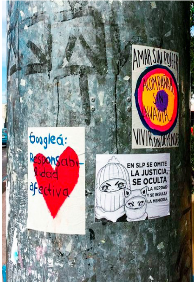
Fig. 3. Ejemplo de los temas representados en Paste up. San Luis Potosí. Año 2020.