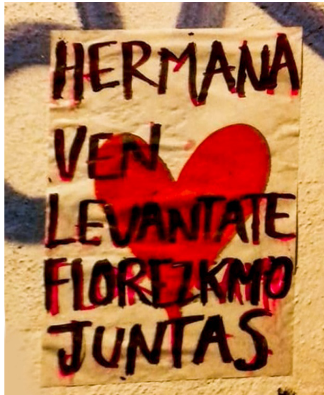
Fig. 6. Paste up que invita a la sororidad. San Luis Potosí. Año 2020.

Gráfica X Morritas es una entidad activa en la sociedad que se encuentra en un proceso de escritura sobre la historia de las mujeres, tanto de la sociedad de San Luis Potosí como de la práctica del street art , debido a su capacidad de actuación que incide en las dinámicas sociales de la urbe. El relato de su actividad se ve materializado en diferentes acciones. En primer lugar, se observa con la redefinición que hacen del movimiento gráfico, al hacer visible la participación de las mujeres mediante la colocación de paste up de carácter feminista en la localidad y por la configuración de estilos de creación basados en sus necesidades expresivas. En segundo lugar, se visualiza con la búsqueda del cambio de la identidad de las mujeres en el ámbito social, al dejar de ser pasivas para transfigurarse en figuras activas que poseen presencia en los procesos de apropiación gráfica de la infraestructura, así como en las dinámicas de resignificación de los espacios públicos, dado que contribuyen en convertirlos en soportes de expresión.