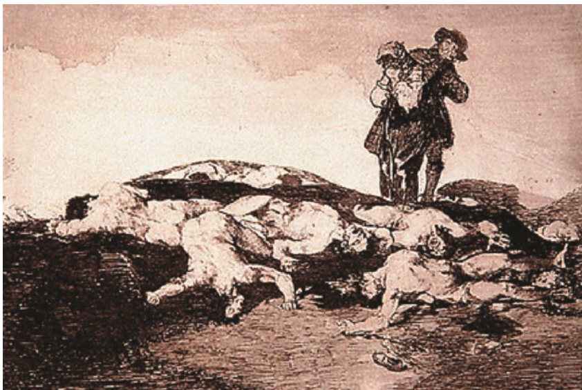
ENTERRAR Y CALLAR. Realizada entre 1810 y 1815, publicada en 1863. Aguafuerte, punta seca, y buril; 163 x 237 mm.