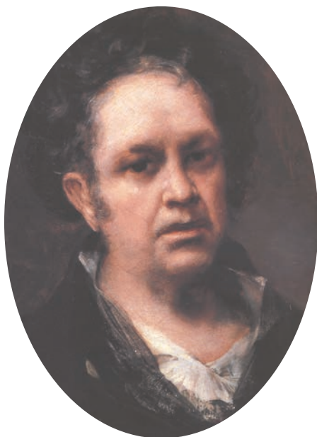
AUTORRETRATO. Francisco de Goya. Cerca de 1815. Óleo sobre lienzo. 46 x 35 cm. Museo del Prado. Madrid.