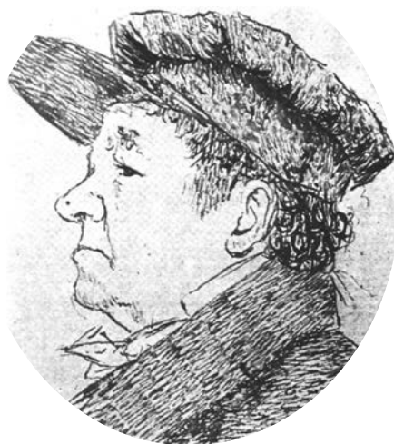
AUTORRETRATO. Francisco de Goya. 1824. Dibujo. 70 x 81 mm. Museo del Prado. Madrid.