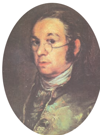
AUTORRETRATO. Francisco de Goya. 1793. Óleo sobre madera. 19 1/2 x 11 3/4 pulgadas. Museo Goya, Castres.