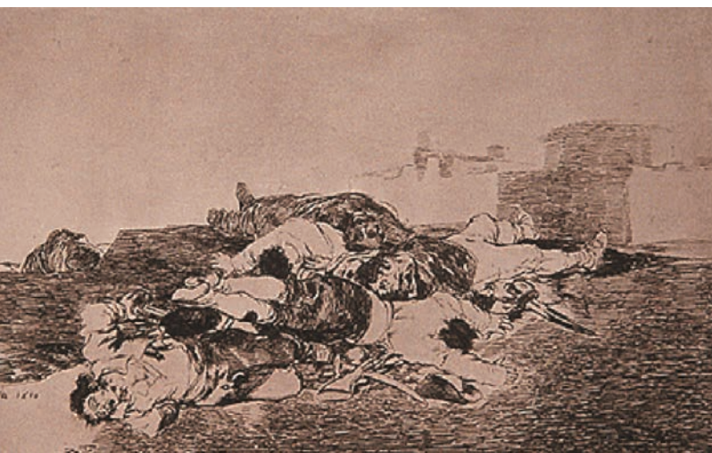
TANTO Y MÁS. Realizada en 1810, publicada en 1863. Aguafuerte, y buril; 162 x 253 mm.

persistente en la mayor parte de su producción. Esta presencia obsesiva que se hace patente en las obras de este período, capta la mirada del espectador y produce su satisfacción pulsional. Para Lacan, citado por Aumont, Jacques (1992), quien introdujo la idea de que el cuadro, al ser objeto de mirada, satisface la pulsión escópica, ciertos estilos de pintura que acentúan los rasgos expresivos, alimentan “excesivamente” esta mirada de una manera que, el psicoanalista francés, califica de “perversa” al cultivarse la pulsión por sí misma.