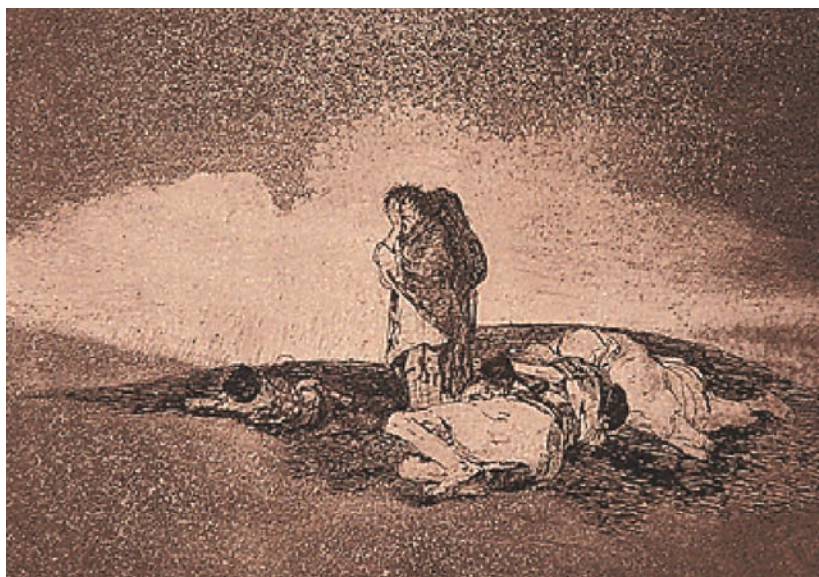
NO HAY QUIEN LOS SOCORRA. Realizada entre 1810 y 1815, publicada en 1863. Aguafuerte, aguatinta bruñida, buril y bruñidor; 154 x 207 mm.

obra de Goya, lo que constituye una alternativa radical a lo sublime bélico y militar de las pinturas de la época, y configura