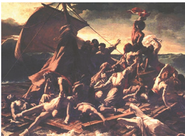
LA Balsa de la Medusa. Théodore Géricault. Óleo sobre lienzo. 1819.

La muerte de Luis XVI, metafóricamente la muerte del padre, es un hecho que corta definitivamente con un período anterior; es la muerte de la monarquía europea y aunque va a tardar mucho en su agonía, queda en la conciencia de todos hombres.