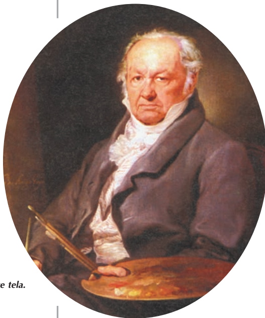
RETRATO DE GOYA. Vicente López. óleo sobre tela. 93 x 75 cm. Museo del Prado. Madrid.