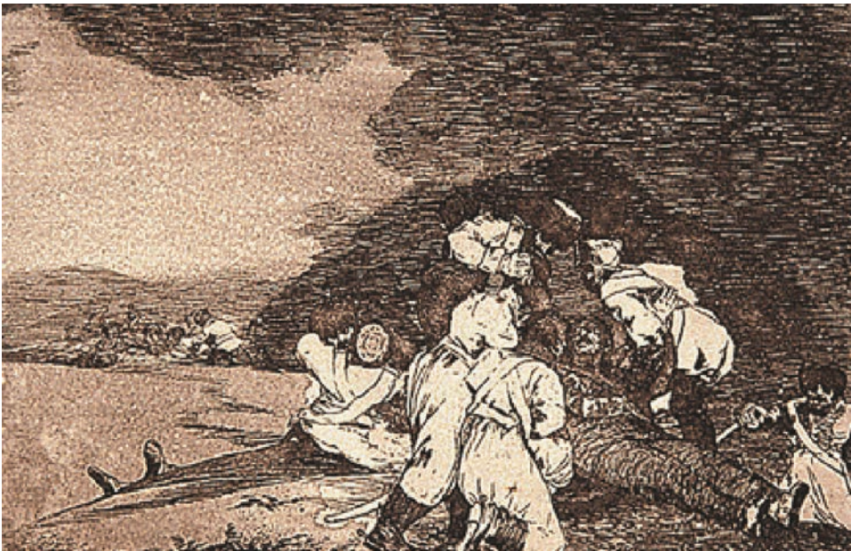
BIEN TE SE ESTÁ. Francisco de Goya. Realizada entre 1810 y 1815, publicada en 1863. Aguafuerte, y buril. 144 x 210 mm.

franceses a lograr que el pueblo español salte de la edad media a la modernidad luego ha sido muy reflexionado por el artista, quien termina asumiendo su propia humanidad compleja. Y esto está presente en toda su obra, que no plantea un juicio, sino una interrogante. Goya pone los elementos para que uno juzgue, y de tal manera que las cosas pueden ser reversibles; quien hoy es el dominador, mañana puede ser el dominado. A diferencia de Delacroix, no adopta una posición partidista, donde los papeles de buenos y malos están claramente repartidos y donde no hay nada de heroico, de noble y alocionador en la guerra que nos muestra.