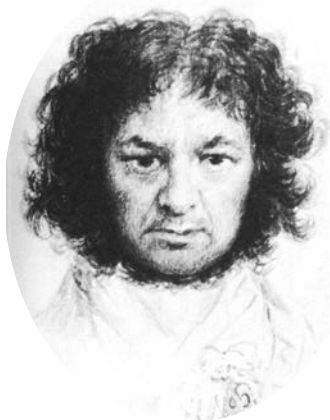
AUTORRETRATO. Francisco de Goya. 1795-1797. Aguada de tinta china. 233 x 144 mm. Dik. Fund. Metro. Museo de arte de Nueva York.