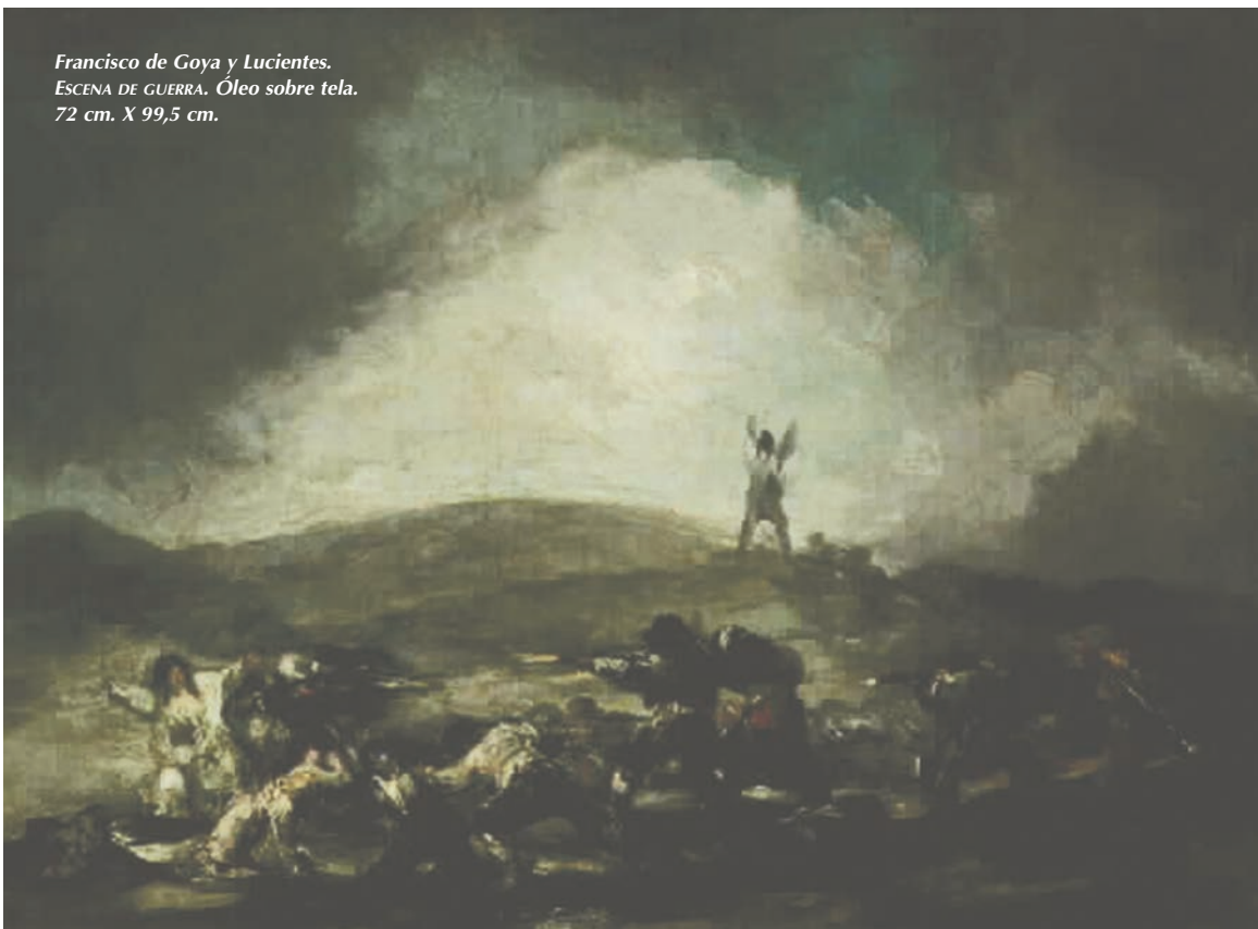
Francisco de Goya y Lucientes. ESCENA DE GUERRA. Óleo sobre tela. 72 cm. X 99,5 cm.

por las sombras de la barbarie; la esperanza ha sido traicionada, lo que parecía progresar en el sentido de la libertad pierde su eje positivo. Se realiza un cambio mediante el cual un principio que se había mostrado como fuente de luz se convierte en fuente de tinieblas.