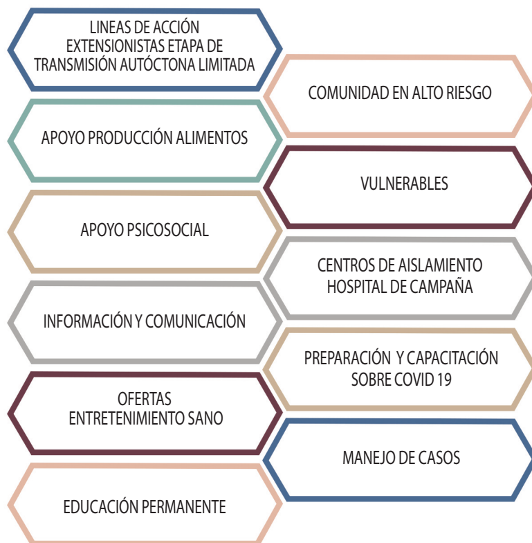
Figura 2. Principales líneas de acción extensionista, en la Universidad de Oriente, durante la Fase de Transmisión Autóctona Limitada