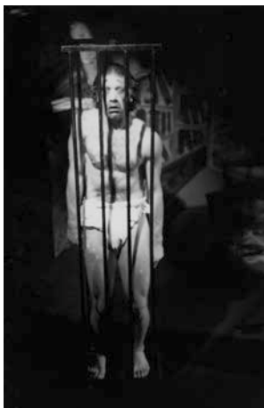
“Una libra de carne”, de Agustín Cuzzani. Escenografía y puesta en escena de Luis Thenon. Producción A.R.T. (Atelier de Recherche Théâtrale). Québec, Canadá, 1997.

artísticas necesarias a la comunicación de las ideas motrices del tema tratado.