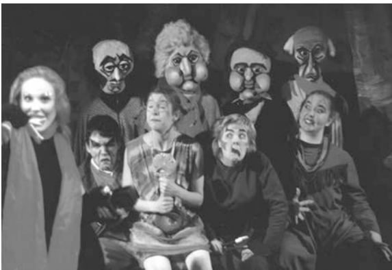
"Una libra de carne", de Agustín Cuzzani. Escenografía y puesta en escena de Luis Thenon. Marionetas de Puma Freytag. Producción A.R.T. (Atelier de Recherche Théâtre). Québec, Canadá, 1997.

parámetros de la relación entre el destinador y su destinatario , entre el sujeto de la acción y el objeto de la acción y, por último, la relación entre ayudante y oponente , cuyas funciones son las de facilitar o la de impedir la comunicación. Este sistema actancial de Greimas lo retoma Ubersfeld 7 para introducir en él una variante fundamental al modificar la relación entre el sujeto y el objeto.