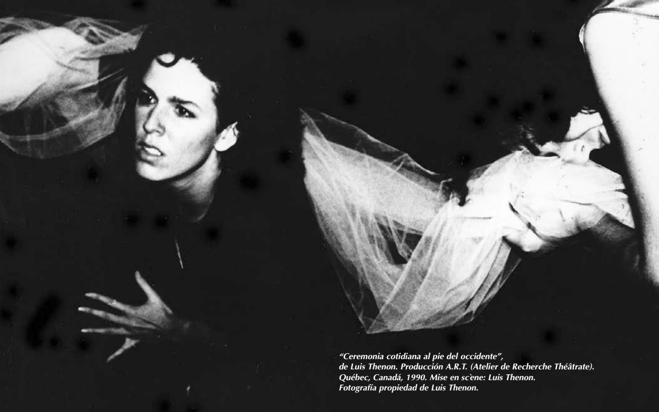
"Ceremonia cotidiana al pie del occidente", de Luis Thenon. Producción A.R.T. (Atelier de Recherche Théâtre). Québec, Canadá, 1990. Mise en scène: Luis Thenon.

su estatus de obra literaria, leíble, y aun cuando toda representación escénica teatral se desagrega de todo condicionamiento literario, partiremos de la premisa de que ambas son difícilmente disociables y como consecuencia de ello, toda descomposición practicada sobre el conjunto indiscernible del hecho teatral nos obliga a decidir sobre la atribución a cada una de las partes involucradas, de uno de los polos conceptuales que identificaremos como prioridad y primacía .