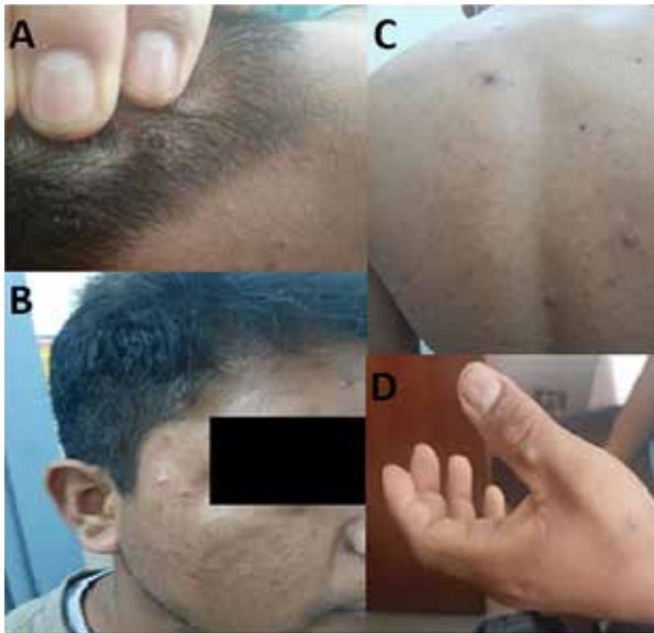
Figura 1: Lesiones dérmicas umbilicadas en A) Cuero cabelludo B) Región temporal C) Región posterior del tórax D) Dorso de la mano izquierda.