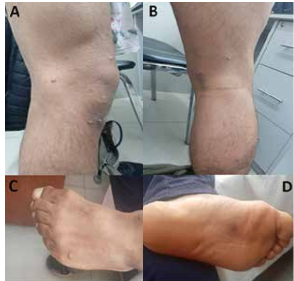
Figura 2: Lesiones dérmicas umbilicadas en A) Rodilla derecha B) Región poplíteea derecha C) Dorso del pie izquierdo D) Planta del pie izquierdo.