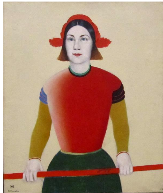
Fig. 6. K. Malévich, Muchacha con mástil rojo , 1933. Firmado por El cuadrado negro

A partir de 1930, sin embargo, Malévich amplía su investigación a los estilos históricos y la historia del arte en general, con explícitas referencias a las fuentes de inspiración del realismo socialista: el Renacimiento, el realismo decimonónico y el postimpresionismo. Como ejemplos, -muchas veces firmados, precisamente, por El cuadrado negro-, Caballería roja (1932); Muchacha con mástil rojo (1933) (fig. 6); los retratos y autorretratos pintados entre 1932 y 1934, incluyendo el irónico Plusmarquista en productividad en el trabajo (1932), etc. Desde las interpretaciones de Barr o Danto, estas obras solo podrían entenderse como acongojada adaptación regresiva al vendaval figurativo de esos años de estalinismo cultural. Ello tiende a obviar que el suprematismo no es el resultado histórico de la purificación abstracta