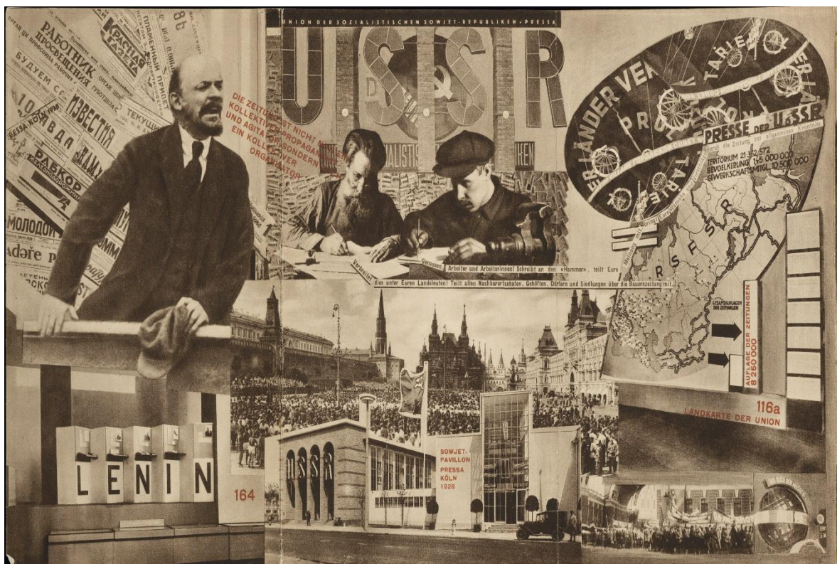
Fig. 5. E. Lissitzky. Fotomontaje en el catálogo de Presse , Colonia, 1928

la fotografía, la tipografía y, sobre todo, el fotomontaje militante. Un ejemplo es su fotomural para la exposición Presse de Colonia (1928). Una obra que el autor consideraba “la única obra de arte bolchevique de la exposición”, con los eslóganes “La prensa organiza el control de las masas bajo la actividad de los soviets;” aunque “La prensa no es solo una propagandista y agitadora colectiva; sino también una organizadora colectiva” (Lissitzky [1929] en Lissitzky-Kuppers, 1976: 75). Esta obra es un claro ejemplo de cómo la factura en su versión constructivista y productivista se convirtió en un término político por cuanto relacional, determinado por la audiencia y no solo el artista, que al expresarse mediante el fotomontaje, integraba en una narrativa preconcebida la imagen documental y reconocible, con un objetivo práctico (fig. 5). 9 Por establecer un paralelismo con otros desarrollos europeos, si el collage cubista confería al objeto un nuevo sentido en el espacio autosuficiente de la pintura y el fotomontaje dadaísta subrayaba la discontinuidad entre el objeto y el contexto, el fotomontaje soviético operaba por selección de datos funcionales a un discurso que buscaba incidir en la realidad social.