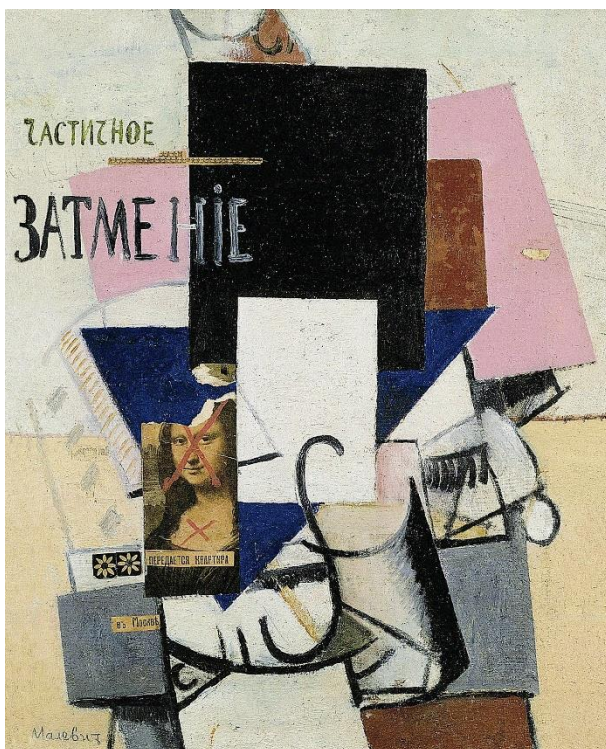
Fig. 3, K. Malévich, Composición con Mona Lisa , 1914

aportaciones originales de estos artistas. Si Barr y sus continuadores destacaban la perfección formal de las vanguardias, y los deconstructivistas ponían el énfasis en la dislocación de estas formas, Buchloh (1984: 90) proponía desde October ampliar la definición de lo moderno en vista del compromiso político y la propia transformación de la noción de artista en propagandista al servicio de los Soviets: el “correlativo histórico lógico de la introducción de la industrialización y la ingeniería social en la Unión Soviética [e...] intermediario necesario en la transformación del paradigma modernista.”