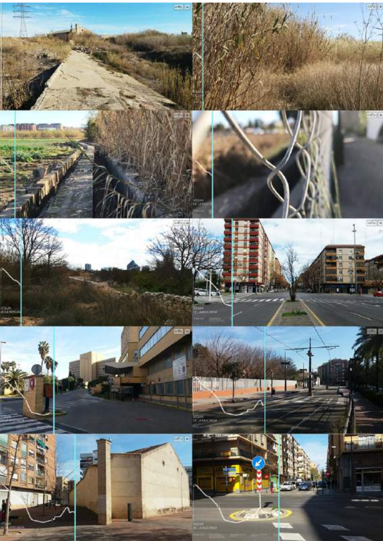
Fotomontaje sobre la aplicación interactiva en diferentes lugares del recorrido

caminar el recorrido, ya que la visualización del recorrido depende directamente de la interacción del usuario.