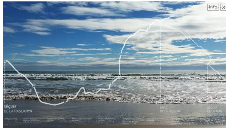
Imagen de la aplicación interactiva, en el final del recorrido

Mostramos interés por todas estas manifestaciones cartográficas desarrolladas con estas cualidades tecnológicas, junto con los modos de