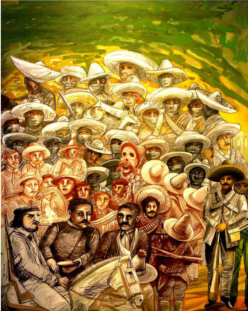
El Che, Pancho, Villa, Emilia