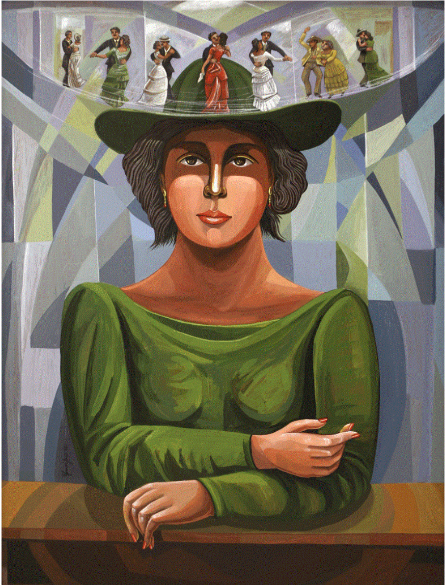
Baile en el sombrero