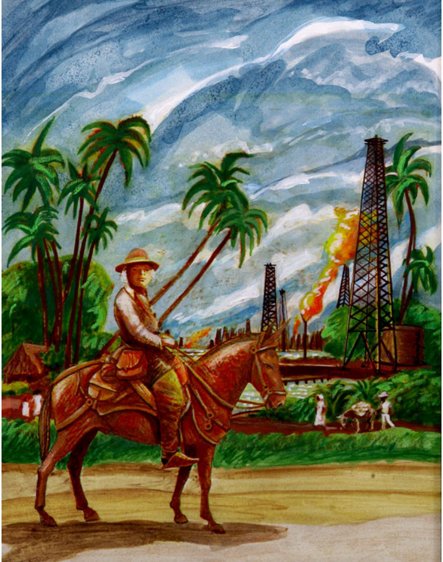
El belga en la Costa Oriental