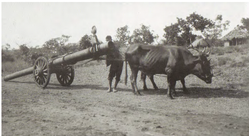
Imagen 4: Mene Grande. Yuntas de bueyes que realizaban el transporte de tuberías de perforación y troncos pesados. Para el pozo Zumaque N° 1. Octubre 16, 1914).