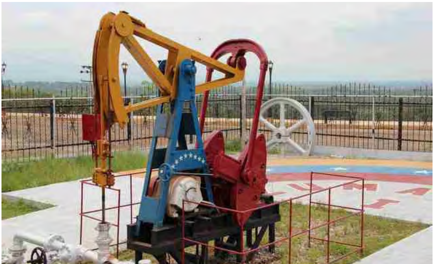
Imagen 5: El Parque dedicado al pozo Zumaque N° 1 en Mene Grande, Cerro La Estrella.

El volumen de producción más elevado de su historia fue de 1334 barriles de crudo mensuales, logrado en diciembre de 1959. En la década de los años 60 la producción de crudo se mantuvo aproximadamente entre 1.500 a 1.600 barriles mensuales. En 1971, la balanza de la producción del Zumaque se inclinó hacia la decadencia, obteniendo una baja en la producción estimada en 218 barriles de crudo mensuales.