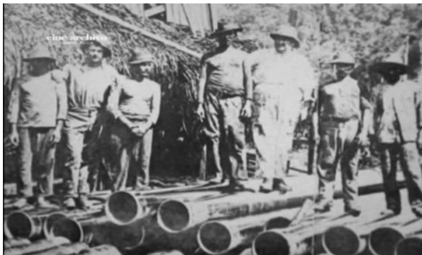
Imagen 2: Trabajadores del Zumaque N°1.

Por otra parte, la economía de Venezuela estaba basada en la producción agrícola de café, cacao, algunos frutos menores, la cría de ganado vacuno y la pesca. Los venezolanos dedicaban en ese entonces buena parte de su tiempo libre a los deberes sociales, religiosos, pero sobre todo al cultivo de una valiosa tradición basada en los principios familiares. Muchas epidemias como la malaria y el paludismo azotaban a toda la población.