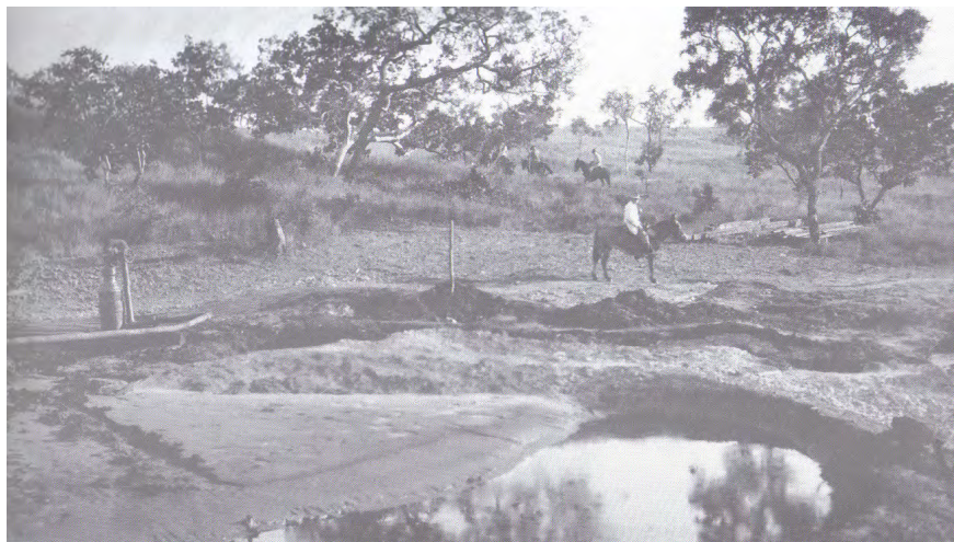
Imagen 3: Vista del pozo Zumaque 1 en el cerro La Estrella en Mene Grande, y la muestra de arena que acompañó al petróleo en su flujo inicial. Octubre 14, 1914.