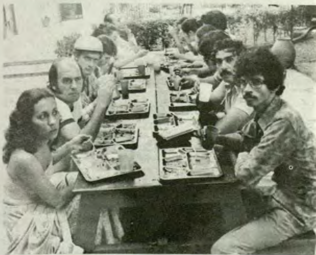
1979. Gira de FUENTEOVEJUNA a Nicaragua. Compañía Nacional de Teatro.

Otro signo alternativo de esta década y de la siguiente fue la teología de la liberación. Este signo representó una manifestación de resistencia basada en los principios cristianos de la equidad: la justicia y la solidaridad. La teología de la liberación arremete contra el tradicional uso de la fe cristiana como resignación; así, la Iglesia debe tener como función básica dar voz a “los sin voz”, propiciar la discusión de los problemas que afectan a la mayoría de la población, a partir del discurso cristiano. Este movimiento plantea a las oligarquías y a las élites dominantes un problema en términos del sostenimiento de los fundamentos filosóficos y morales de los esquemas sociales y económicos desarrollados por ambas, los cuales han conducido a la explotación de grandes fragmentos de la sociedad. 9